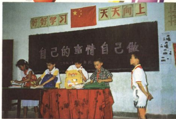
从小开始培养少年儿童自己的事情自己做