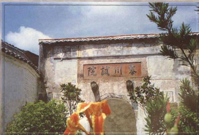
古代黎川试院旧址