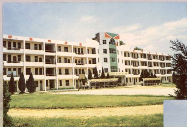
省重点职业高级中学——县职业 中专教学大楼