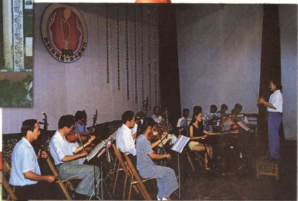
抚州地区唯一的教育乐队——黎川县教委乐队在全县庆祝第十四个教师节文艺演出中大展风采