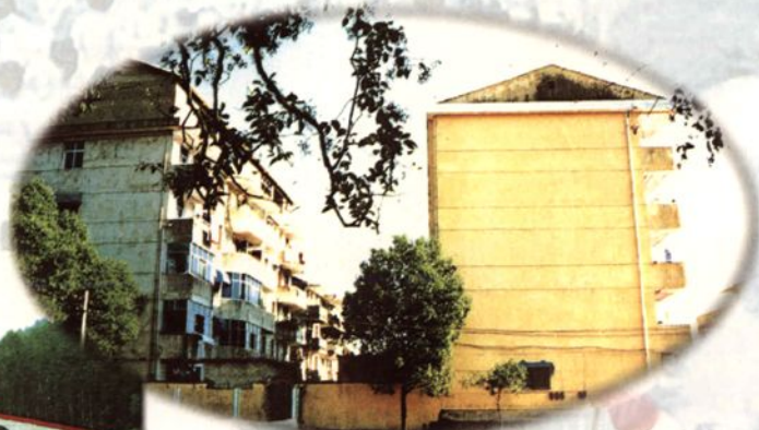
县城教师宿舍楼群