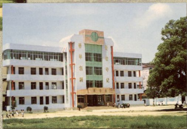
县实验中学教学大楼