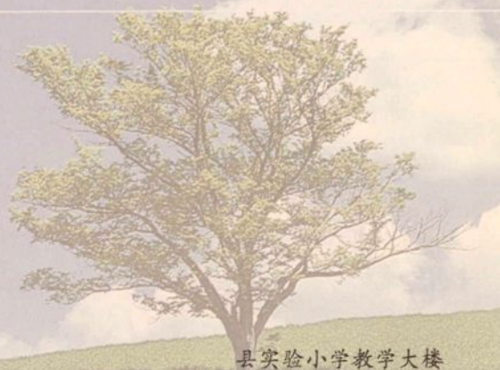
县实验小学教学大楼