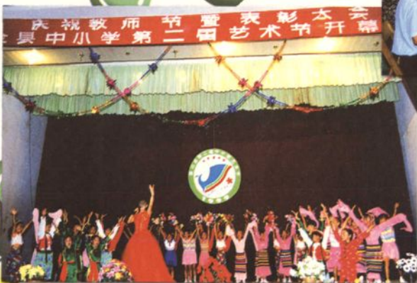
1999年9月，县教委举行全县中小学第二届艺术节，从中挑选出10个节目参加抚州地区中小学第六届艺术节竞赛，获团体第一名