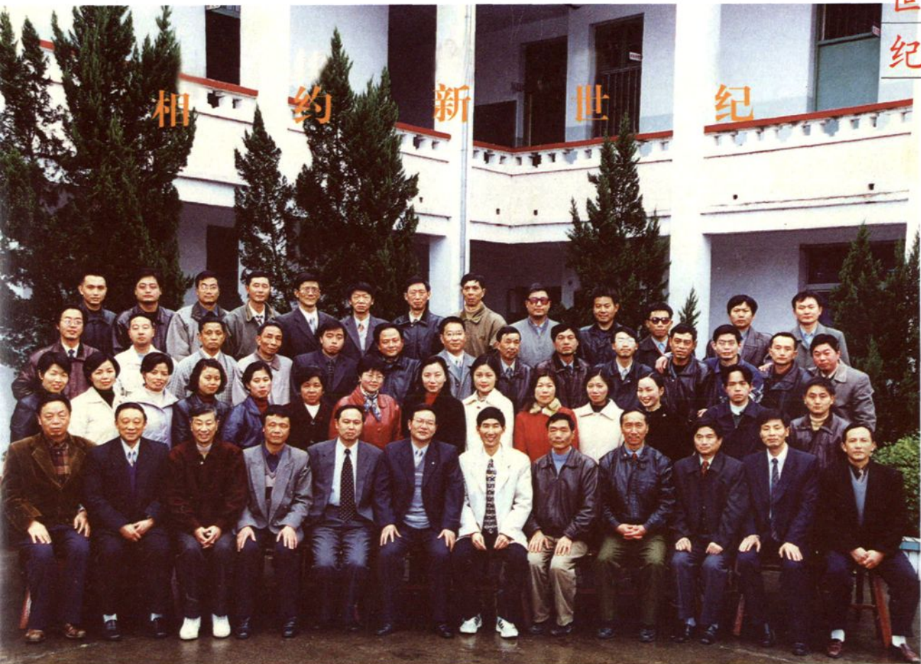
县教委机关工作人员