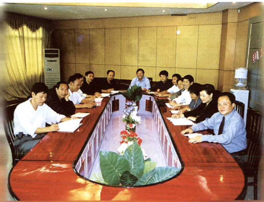
县教委领导班子成员在研究工作