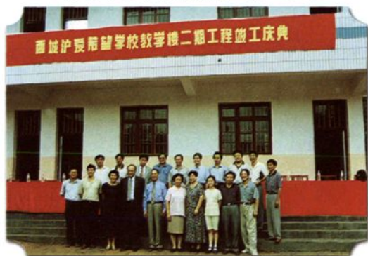
由上海市外事办援建的西城乡沪爱希望学校教学楼二期工程竣工