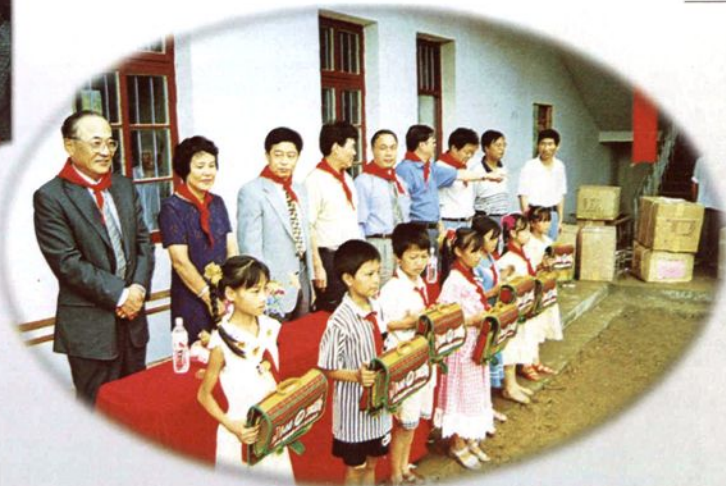
上海市日立凉霸公司出资兴建西城乡五通村希望小学并向孩子们捐赠学习用品