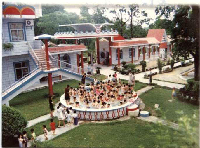
省示范性幼儿园——县幼儿园一角