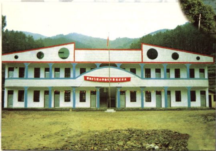
1998年救灾复校后新落成的厚村乡飞源村小学教学大楼