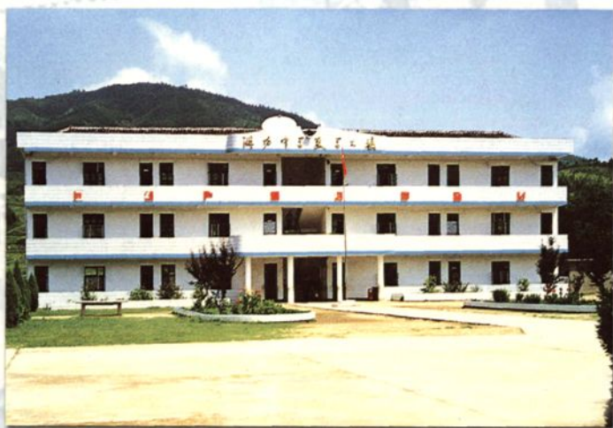
闽赣省委、省革委会所在地湖坊乡中学教学大楼