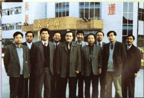
2001年3月，市委副书记许德仁（前排左三），市委常委、宣传部长曾志勇（前排左四）在县委书记叶建青（前排左二），县委副书记黄小明（前排右二），县委常委、宣传部长王水谟（前排左一）的陪同下视察县一中