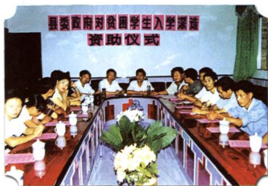
县委、县政府在财政尚困难的情况下，拿出部分资金帮助贫困家庭学生圆了大学梦