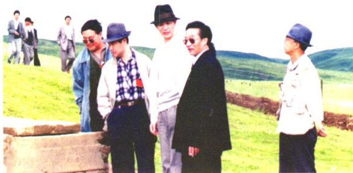
◁ 省卫生厅卓凯星厅长、州卫生局领导检查人畜饮水工程