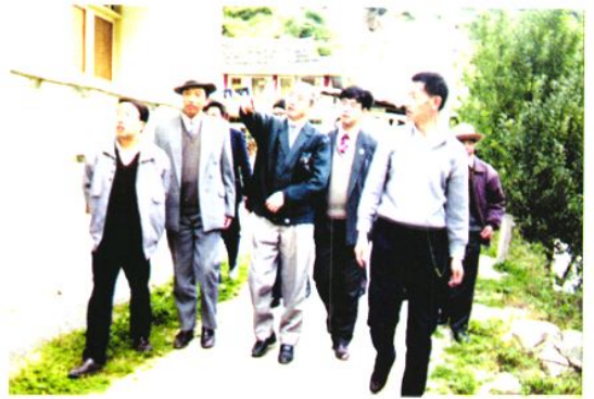
△ 参会领导视察州防疫站