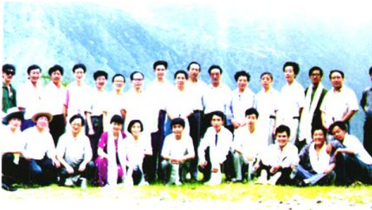
△ 省卫生厅参会领导