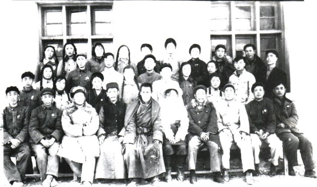
△ 1955年4月12日成立的甘孜县民族卫生工作者协会全体会员留影

དཀར་མཛེས་རྗེ་མི་དཀའ་འབྱོར་རྟེན་ལས་ཉེན་མཁའ་ལྷན་ཚོགས་གསར་བཙུགས་ཀྱི་རིམ་བུ། 甘孜县民族卫生工作者协会成立纪念—一九五五.四.十二