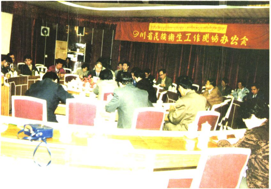
△ 1994年8月四川省民族卫生工作现场办公会在康定召开