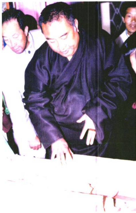
△ 原全国人大常委会副委员长第十世班禅大师视察我州德格县藏医院