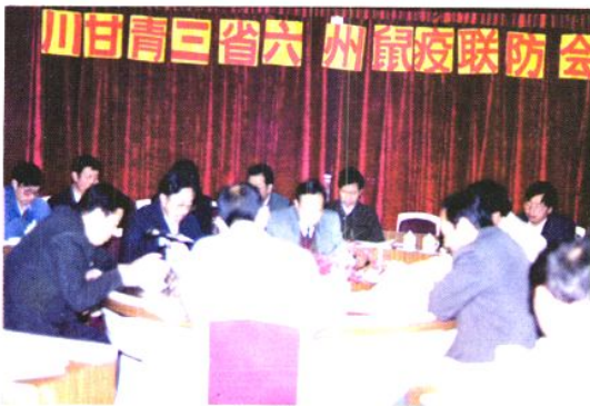
△ 川甘青三省六州鼠疫联防会