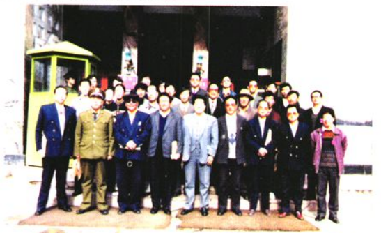
△ 原州政府分管领导(现州人大主任)胡克礼与参会代表合影