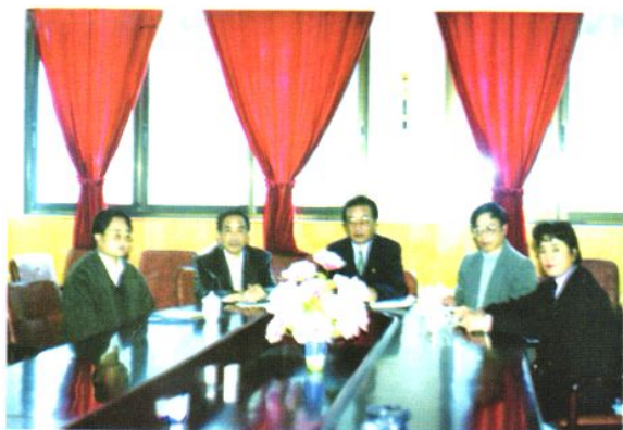
△ 甘孜藏族自治州卫生局现任领导班子