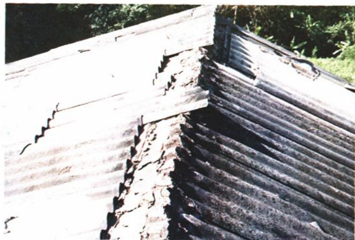
1988年受澜沧、耿马地震波及,屋瓦滑落。