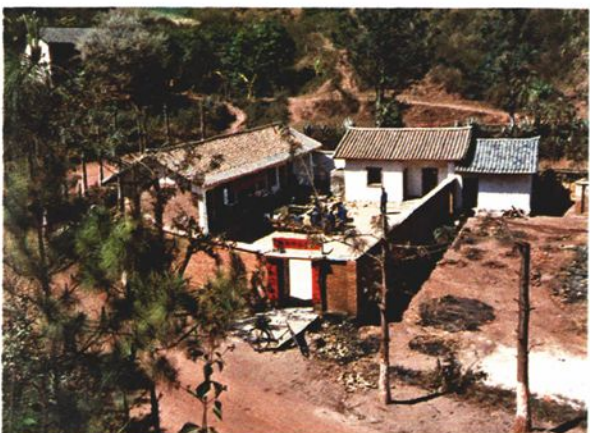
按板镇安康村敬老院