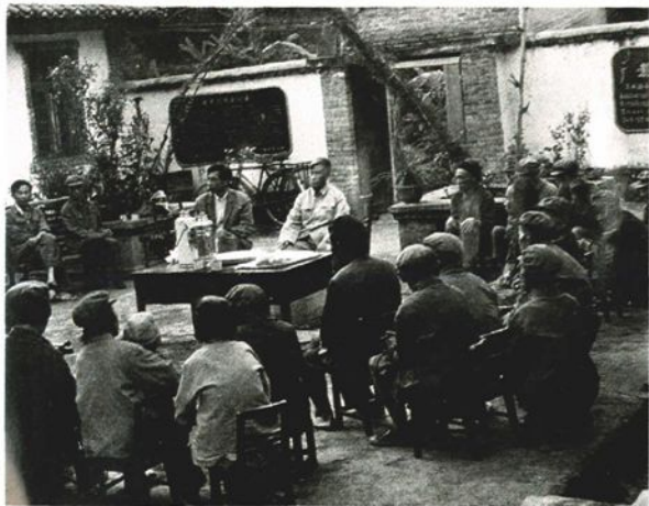
1988年敬老节,县委、县人民政府领导到按板镇养老院慰问。