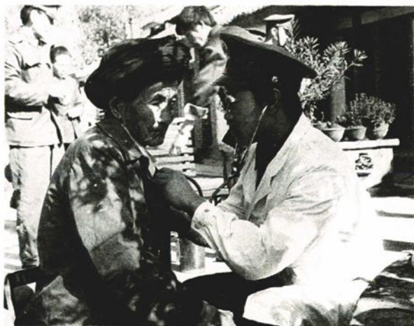
驻县85分队卫生员为五保老人体检。