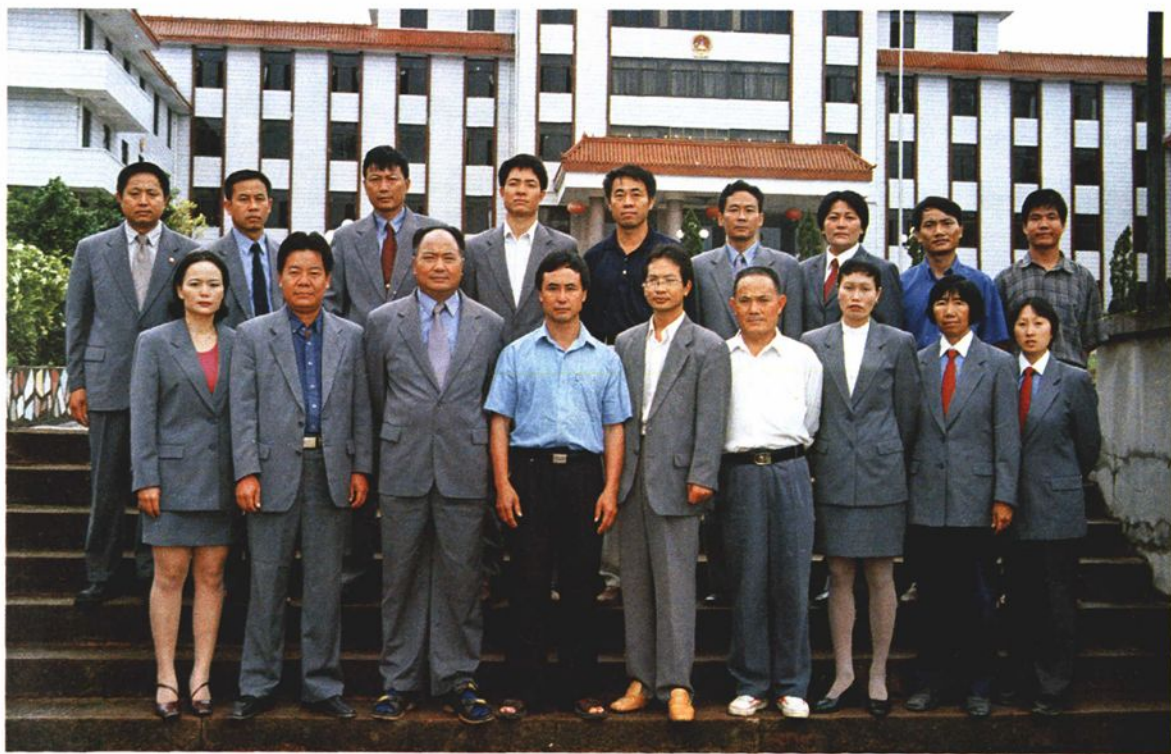
民政局全体职工:(从左至右)