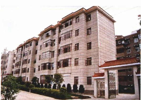
民政局职工住宿区