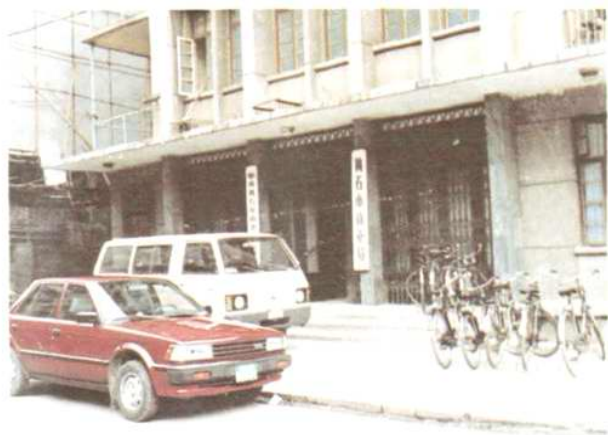
黄石市商業局辦公樓 地址：黃石市消防路14號