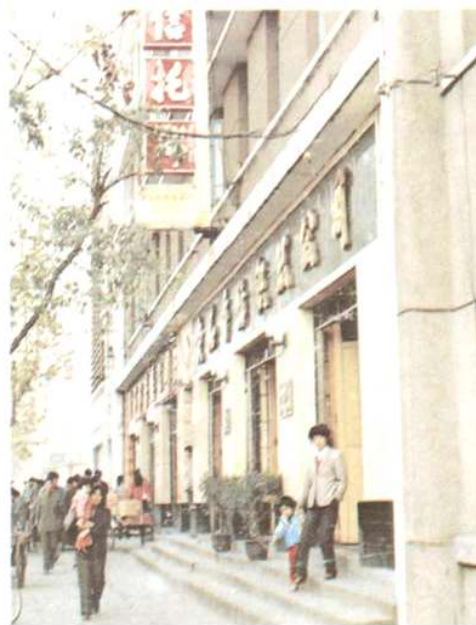
黃石市紡織品公司辦公樓 地址：交通路18號