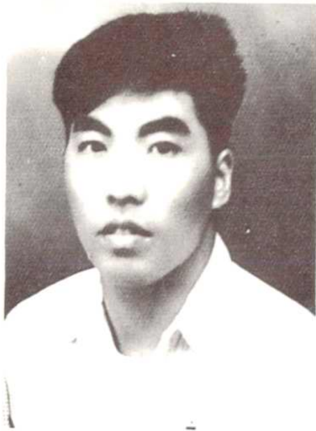
边書台 曾任工商科副科長