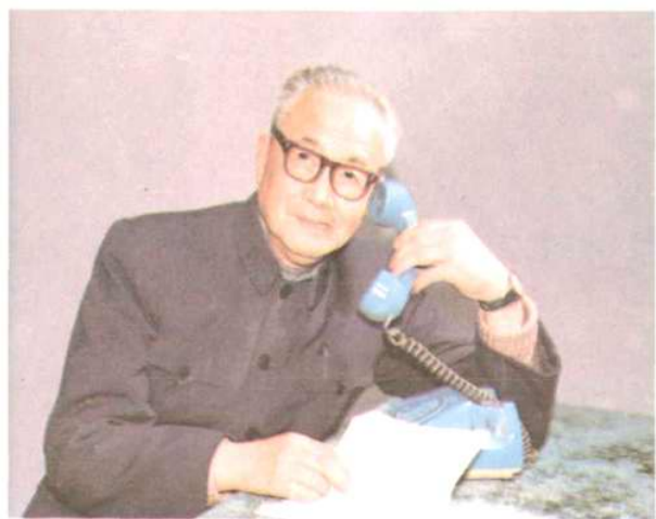
黃連 曾任局黨委書記。