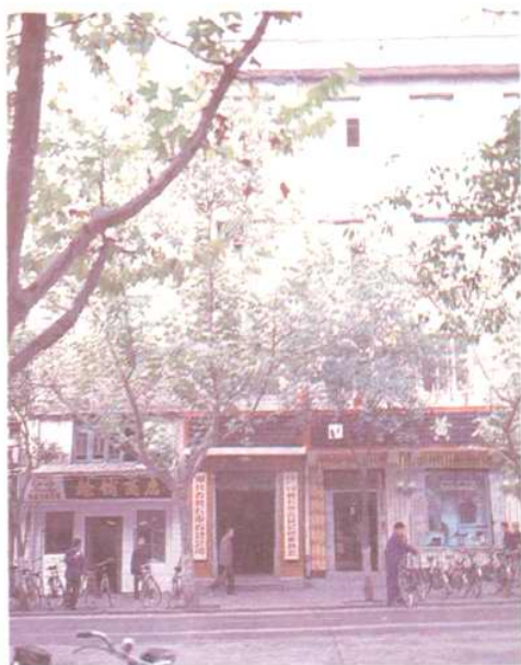
黃石市百貨公司辦公樓 地址：交通路14號