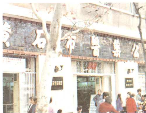
黃石市醫藥公司辦公樓 地址：交通路13號