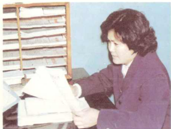
鄒 運 曾任局黨委副書記。