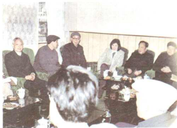
終審定稿會的情景