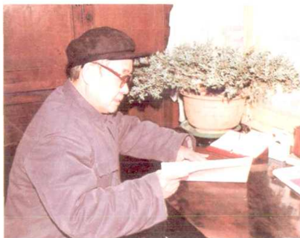
藏 偉 曾任局黨委書記。