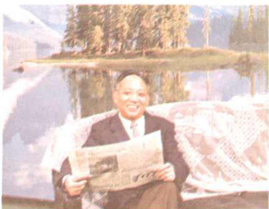
馮春曾任副局長、局長。