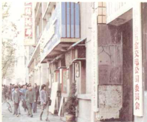
黃石市五金公司辦公樓 地址：交通路23號