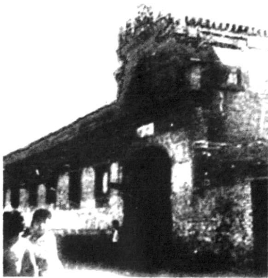
1922年中共唐山地方委员会所在地——解放路 礼字五条七号（欧阳小楼）

唐山市是建立中国共产党地方组织较早的地区。1921年4月底以前，唐山就组建了中国共产党天津组织唐山站分部 ① 。京奉铁路唐山制造厂工人邓培是唐山最早的党员 ② 。中国共产党全国第一次代表大会以后，中国共产党创始人之一李大钊多次派人来唐山指导工人运动，组织工会，发展党的组织。1922年4月，唐山制造厂建立了中共地方委员会（地方支部），邓培任书记，阮章、梁鹏万分别担任组织、宣传委员。委员会隶属中共北京地方支部。同年6月，经邓培、阮章介绍，唐山矿工人李星昌、只奎元等入党，建立起开滦唐山矿第一个中共党支部。同年8月，在唐山制造厂、开滦唐山矿两个支部的基础上，按中共“二大”通过的《中国共产党章程》成立了中共唐山地方执行委员会（简称中共唐山地委），地委书记为邓培，组织委员为阮章。中共唐山地委建立后，把领导劳工运动作为党的主要任务，在李大钊为首的中共北京区委领导下，唐山的工人运动进入了有组织有领导的发展阶段。当年10月，组织领导了京奉路唐山制造厂、开滦煤矿、启新洋灰公司等大型厂矿近5万人的大罢工。毛泽东在