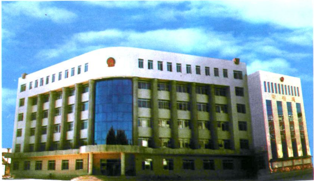
第五期图们市人民法院址（2000年9月28日落成现图们市友谊街84号位置）建筑面积5,000平方米