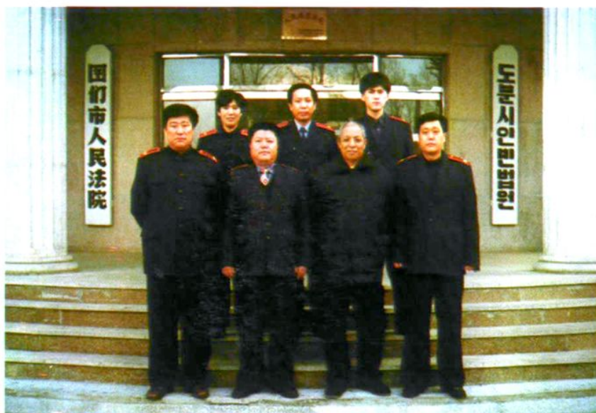
图们市人民法 院志编纂组全体成 员合影