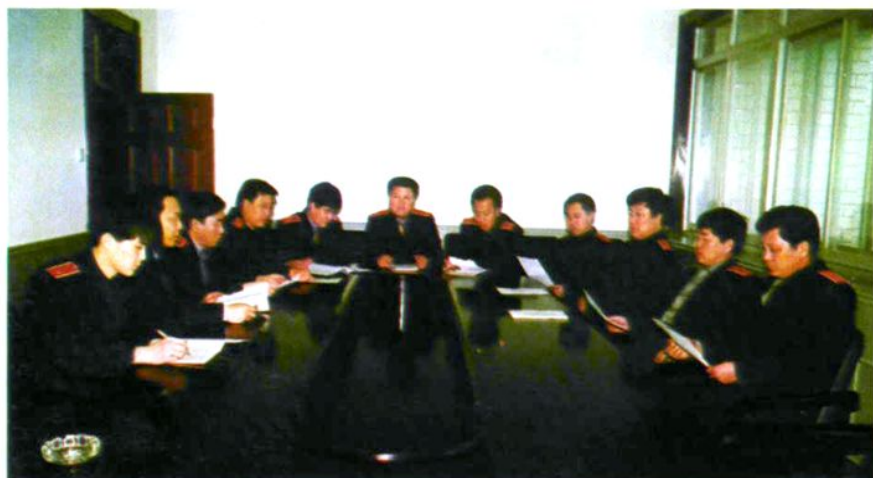
图们市人民法 院审判委员会讨论 案件