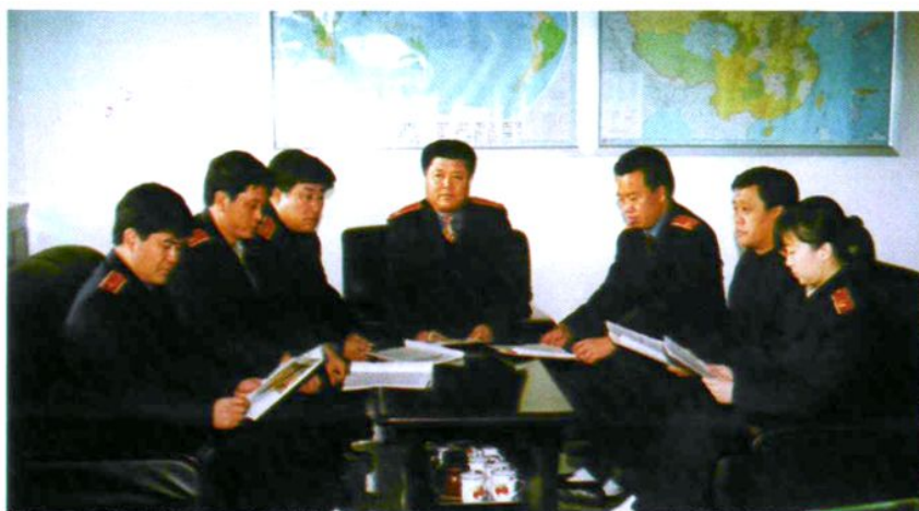
图们市人民法院 党组会议