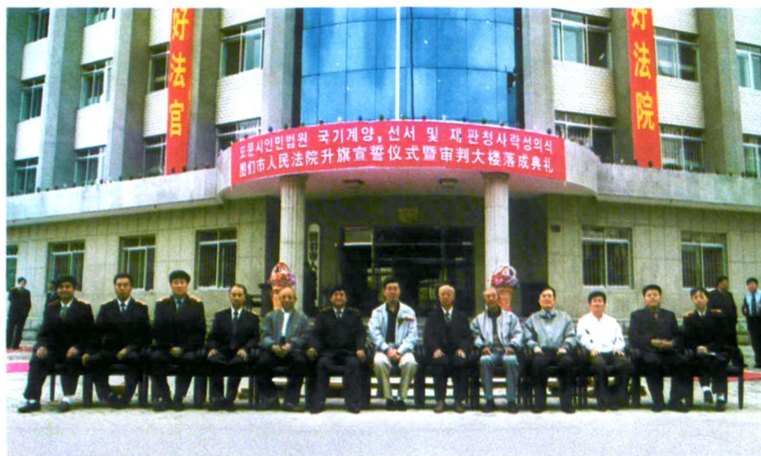
党组成员和退休干部合影