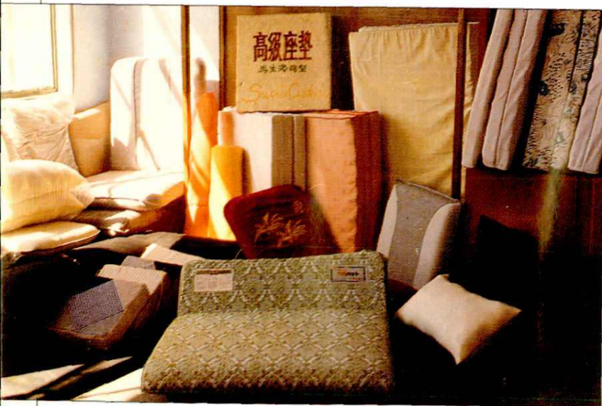
昆山赛露达有限公司产品