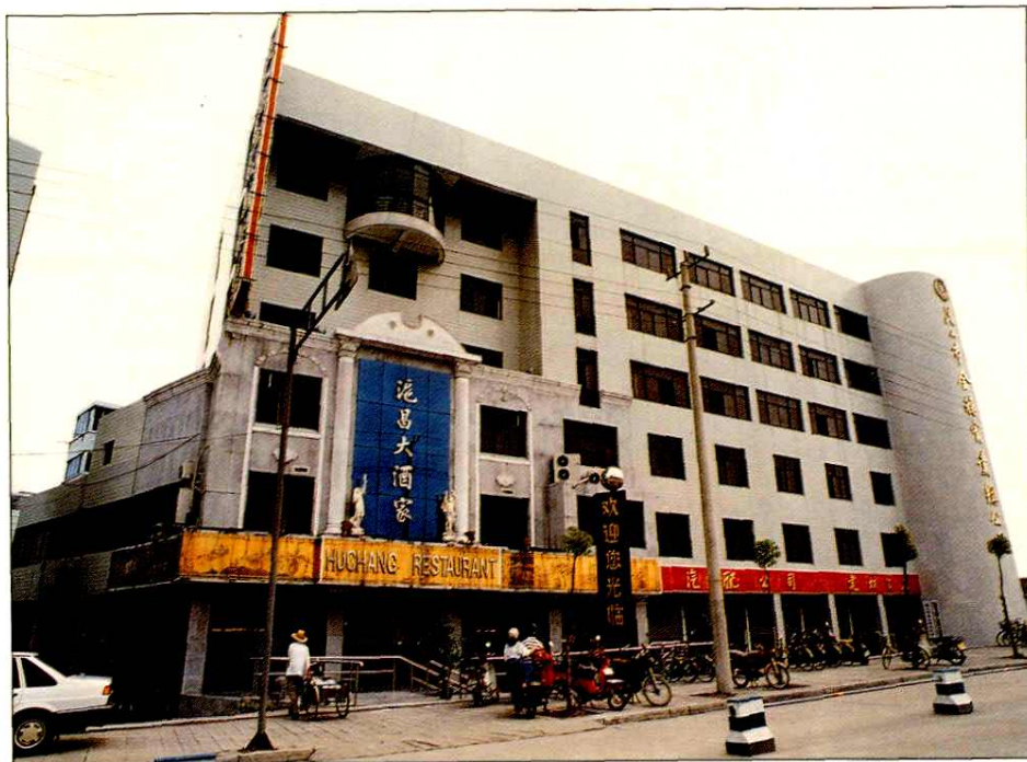
农业公司沪昌大酒家