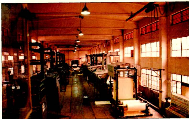
协孚人造皮有限公司