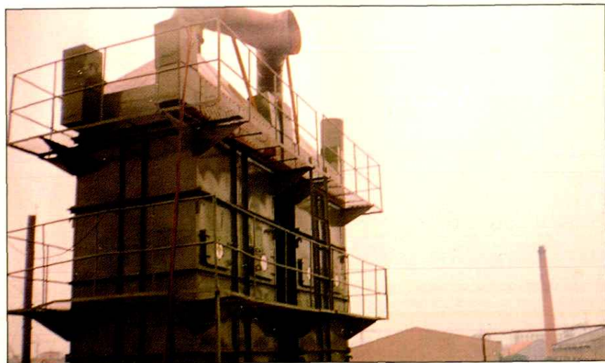
人造革制造业增塑剂废气静电净化回收设施