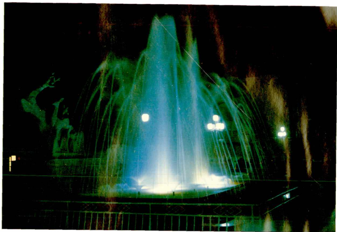
市政府广场夜景一角