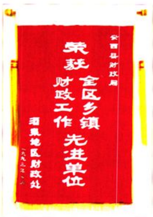
1993年荣获全区乡镇 财政工作先进单位