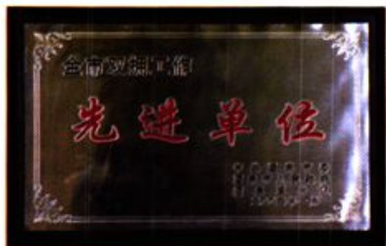
2003年安西县财政局获全市双拥工作先进单位