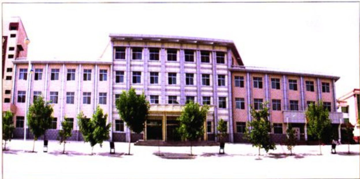
安西县财政局办公楼