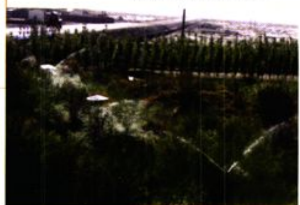
日元贷款风沙治理项目