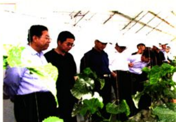
副省长陆武成视察安西县国家农业综合开发科技推广综合示范项目