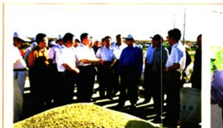
省长陆浩视察安西县农业综合开发项目建设情况