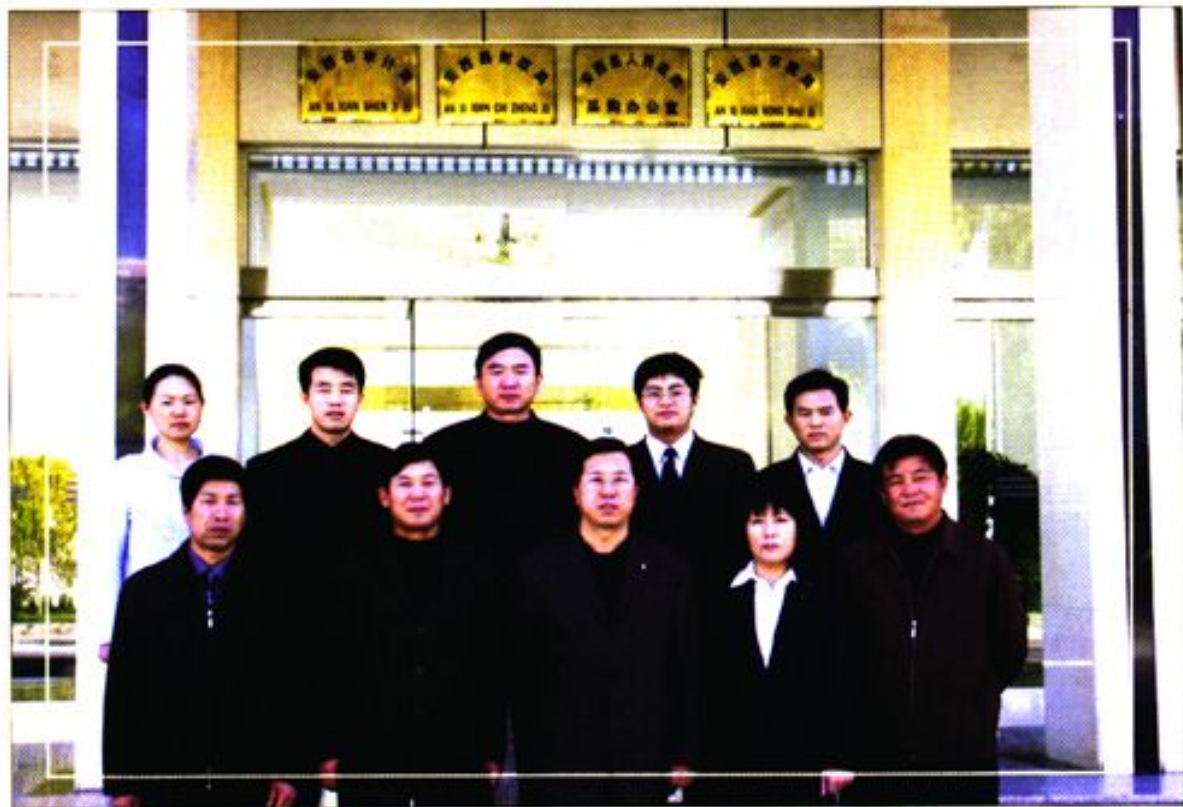
《安西县财政志》编纂领导小组及编纂成员合影