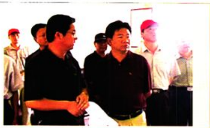
甘肃省农发办主任马自学视察 安西县农业综合开发项目建设情况