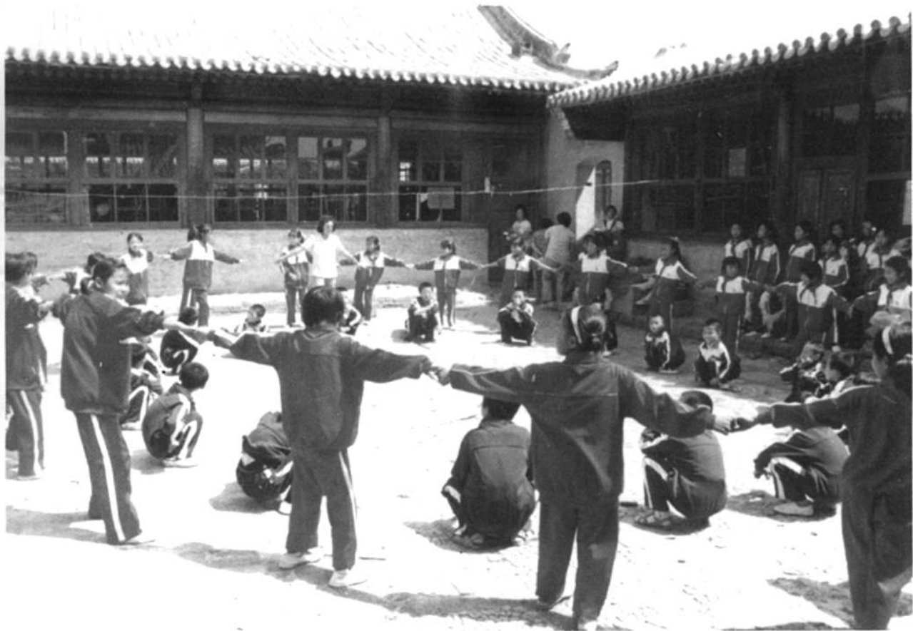
朔城区第一小学的学生在校园做课间活动。