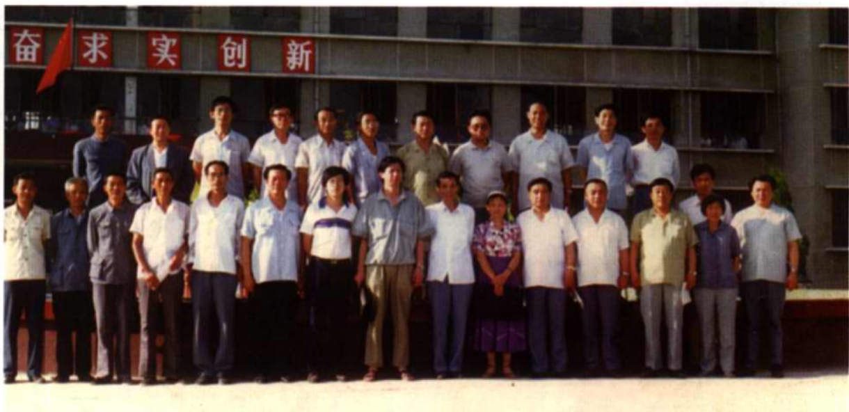
省市有关领导与全国集资办学检查组成员合影留念。