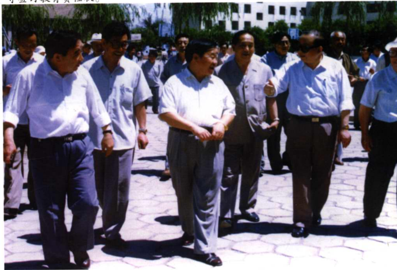
在省工作的朔城区籍老干部回乡参观学校，图为在城区一中参观。