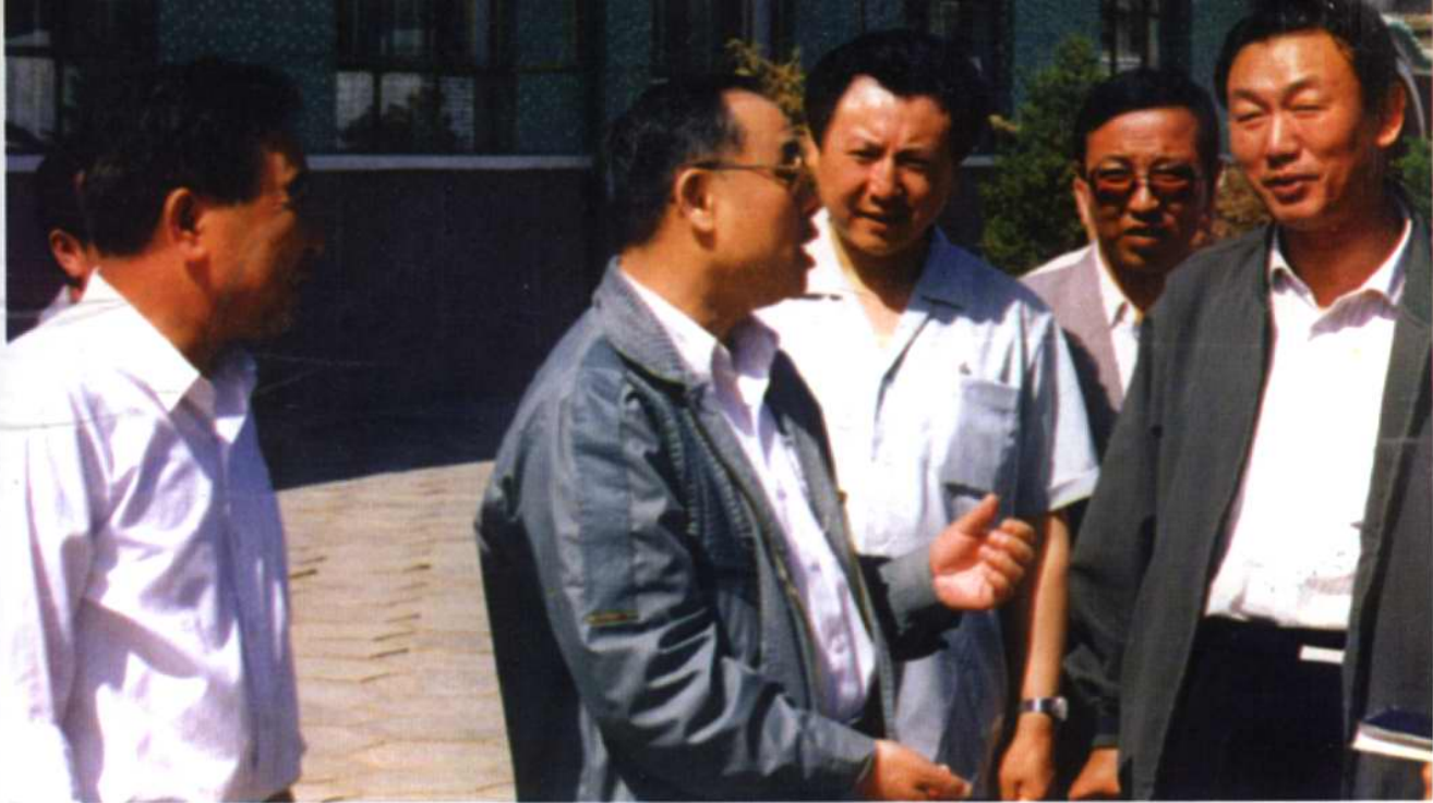
副区长落国和（左三）陪同副省长吴达才（左二）、市长董福山（左五）、副市长李尧（左一）参观北邢家河学校。