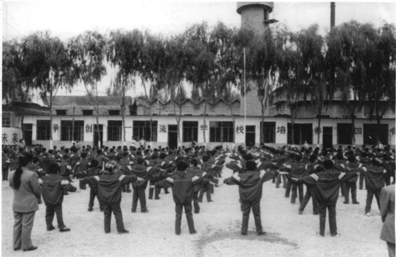
神头镇大洼小学的学生在上课间操。