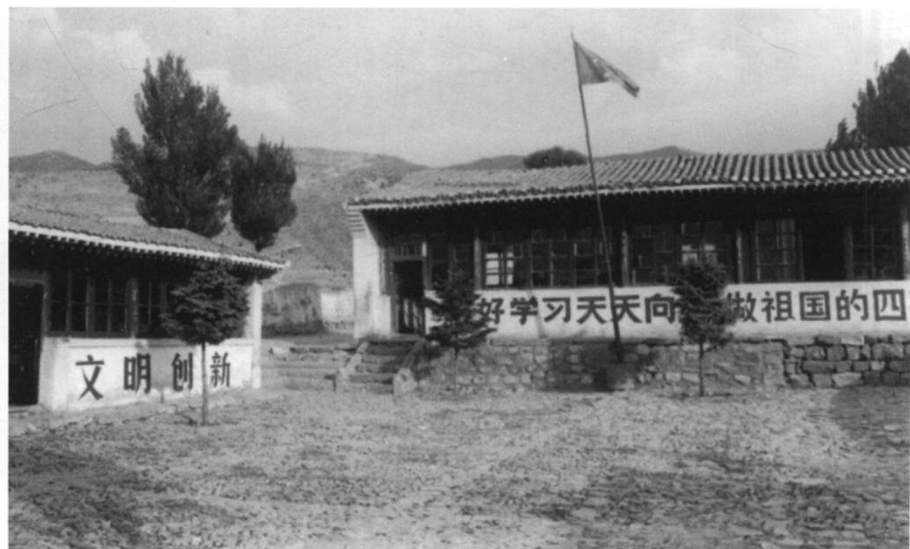
南榆林乡王化庄学校。