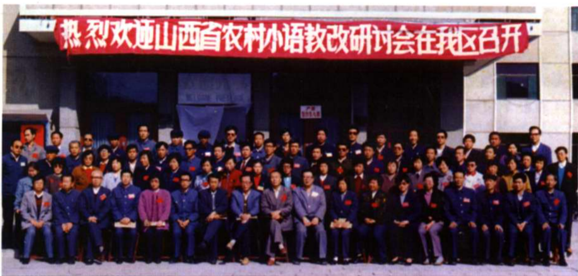
1992年，山西省农村小语研讨会在朔城区召开，图为全体成员在城区宾馆合影。