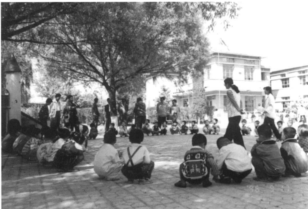
朔城区第一机关幼儿园的学生在做户外活动。