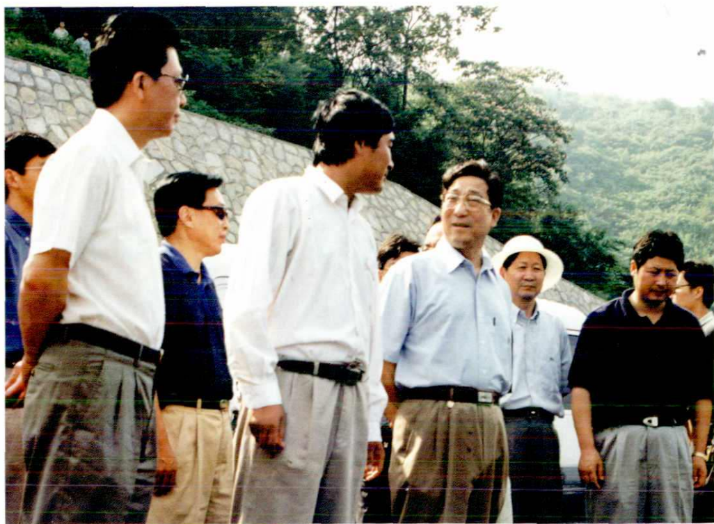
2000年6月30日省长柴松岳在听取施工单位负责人的介绍。省人大常委会副主任张友余（左四戴帽者），副省长卢文舸（左一），嵊州市长谭志桂（左五）。