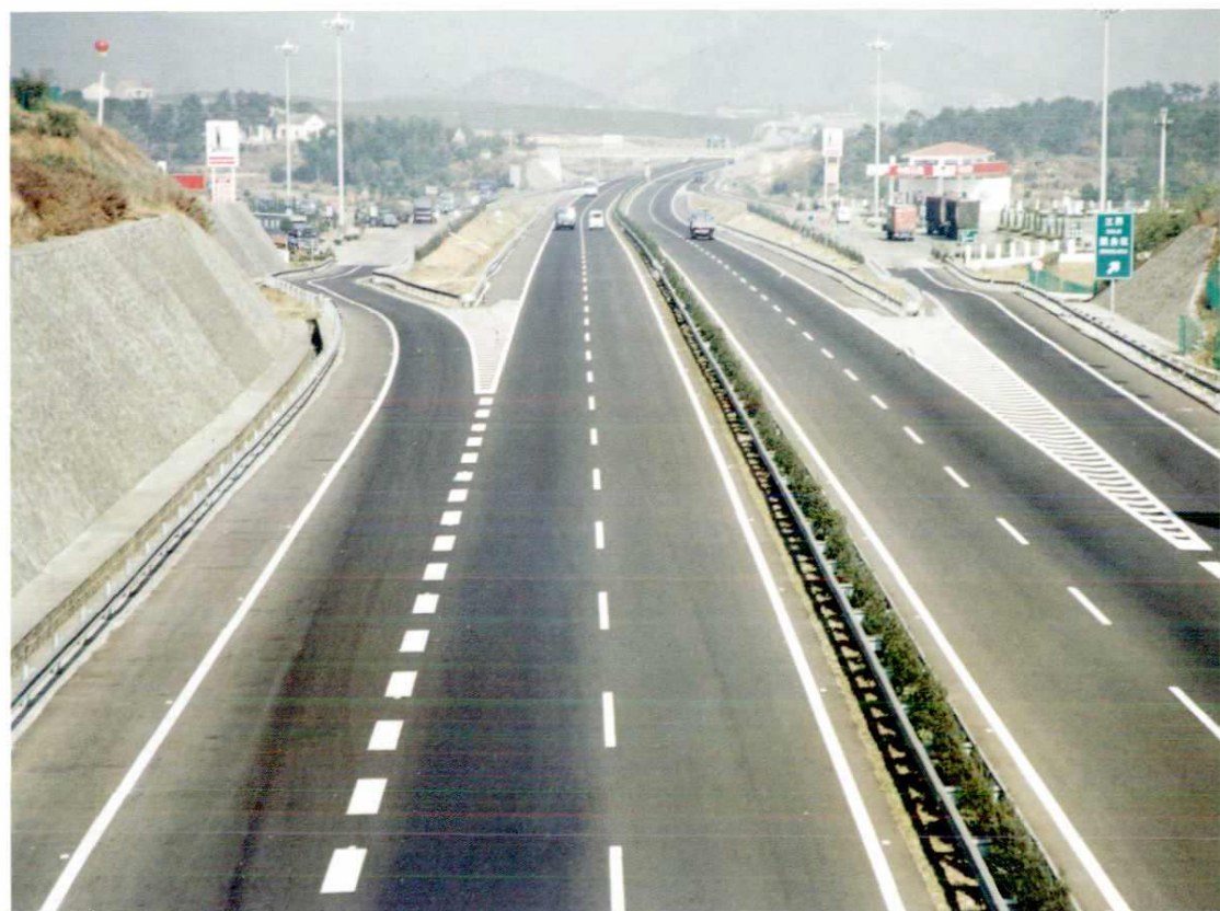
上三高速公路嵊州段