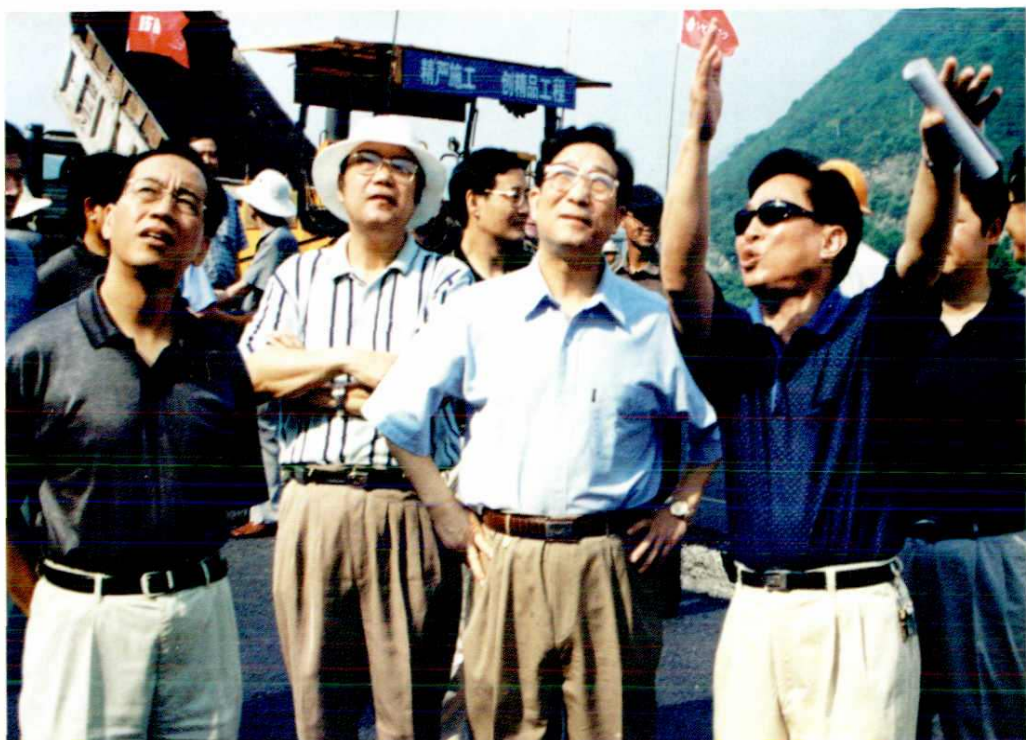
2000年6月30日省长柴松岳（左三）在听取上三高速公路总指挥吴非熊的情况介绍。绍兴市市委书记董君舒（左一）、交通厅长郭学焕（左二）。