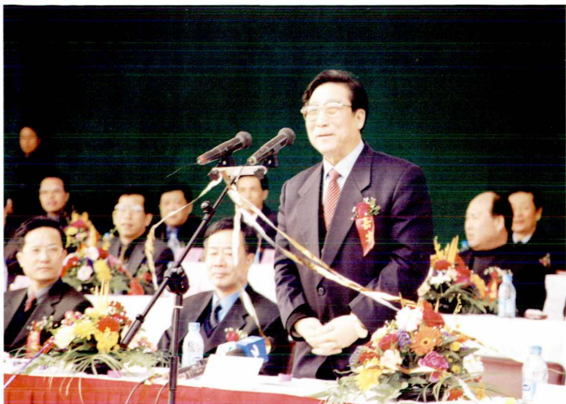
2000年12月26日省长柴松岳宣布上三高速公路通车