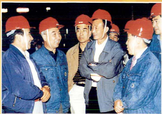
1996年8月31日中共中央政治局委员、国务院副总理吴邦国（右二）在八钢视察