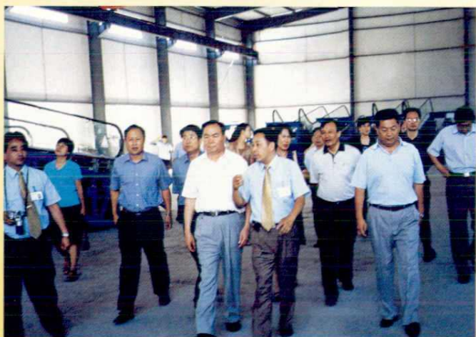
2003年8月16日，中共中央政治局委员、自治区党委书记王乐泉视察头屯河工业区