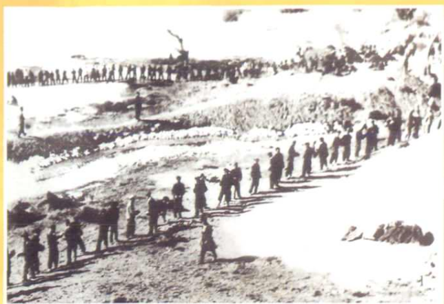
1.1951年八钢初建，人民解放军指战员人拉肩扛，往工地运送建筑材料