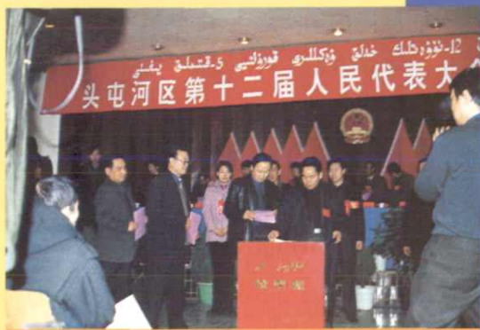
头屯河区第十二届人民代表大会