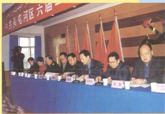
中共头屯河区六届二次全委扩大会议