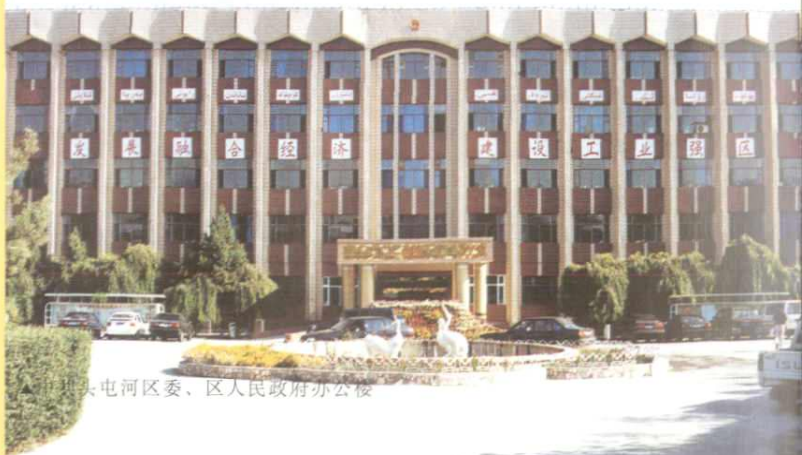
头屯河区委、区人民政府办公楼