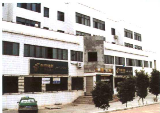
头屯河区邮政分局