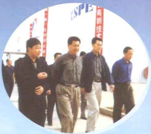
2001年9月22日，自治区党委常委、市委书记杨刚（前排左二）一行来金石沂青厂视察指导工作