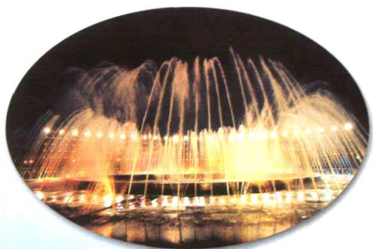
八钢文化广场夜景