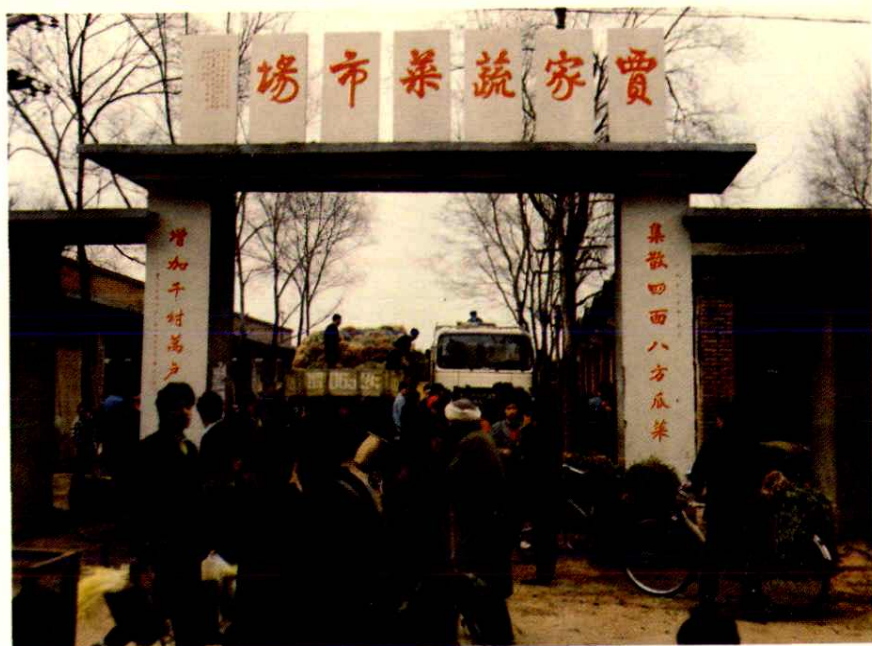
简阳县贾家蔬菜批发市场