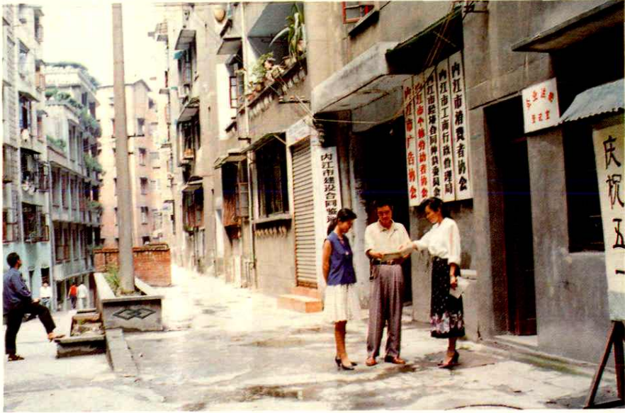
内江地区工商行政管理局(现市工商局) 1984年8月新建投入使用的办公宿舍大楼