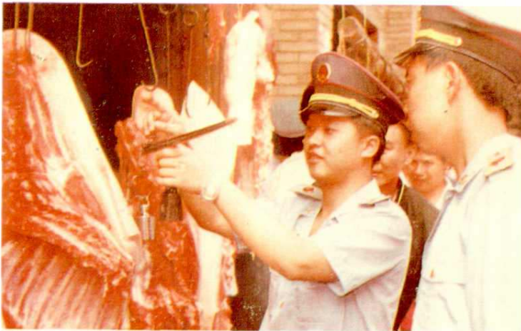
资中县渔溪区工商行政管理干部在市场上检查