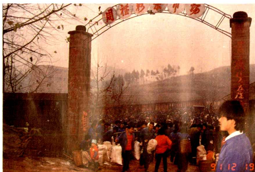
安岳县周礼粉条市场