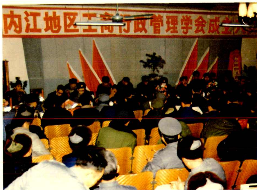
内江地区工商行政管理学会于1985年1月召开成立大会