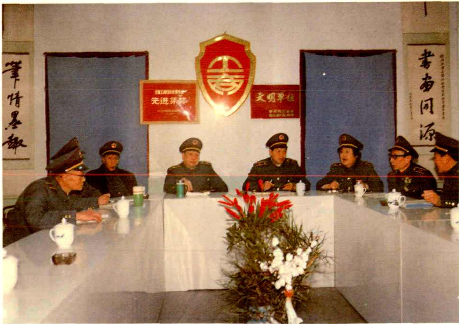
中共内江地区工商行政管理局党组召开扩大会议