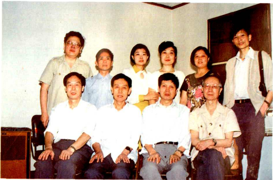
《内江地区工商行政管理志》编纂办公室人员合影