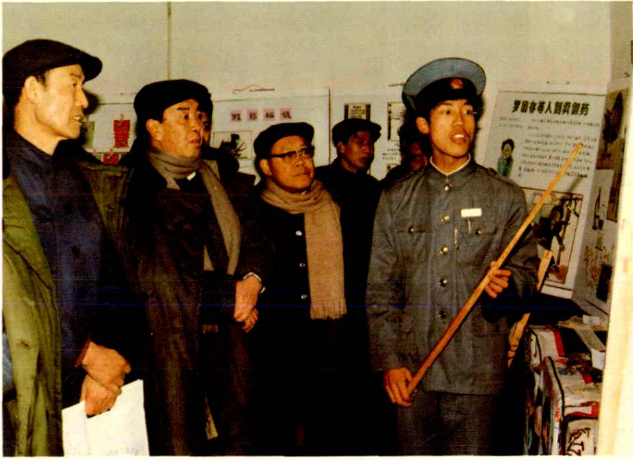
内江地委副书记谢盛耀、副专员吉福仓，四川省工商行政管理局副局长张文沛参观内江地区工商行政管理局举办的市场管理展览