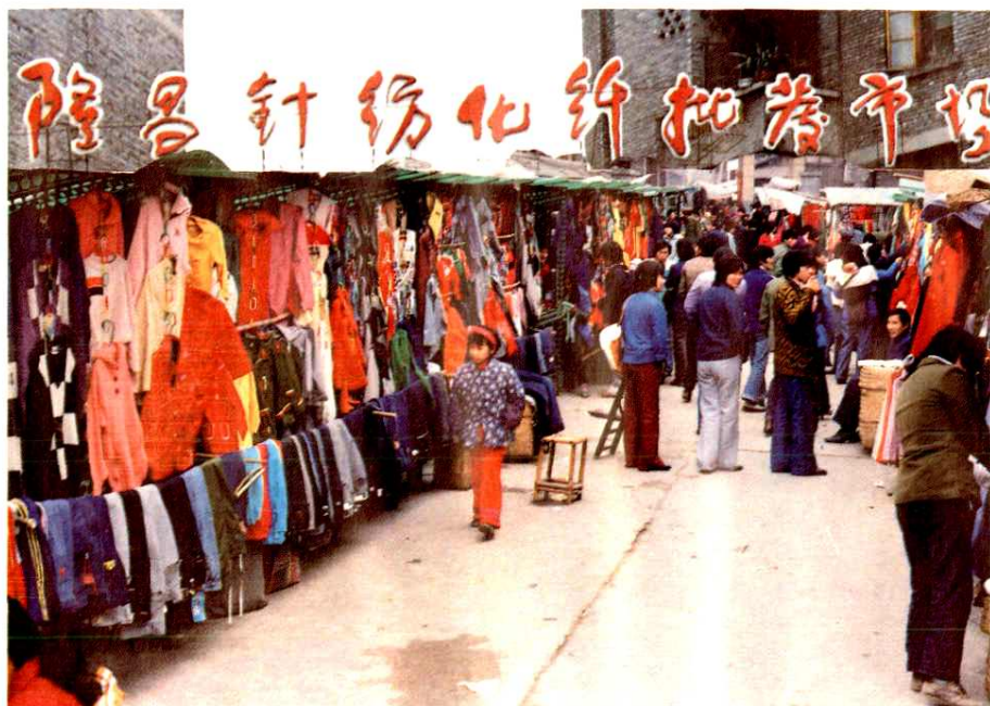
隆昌县金鹅镇针纺化纤批发市场