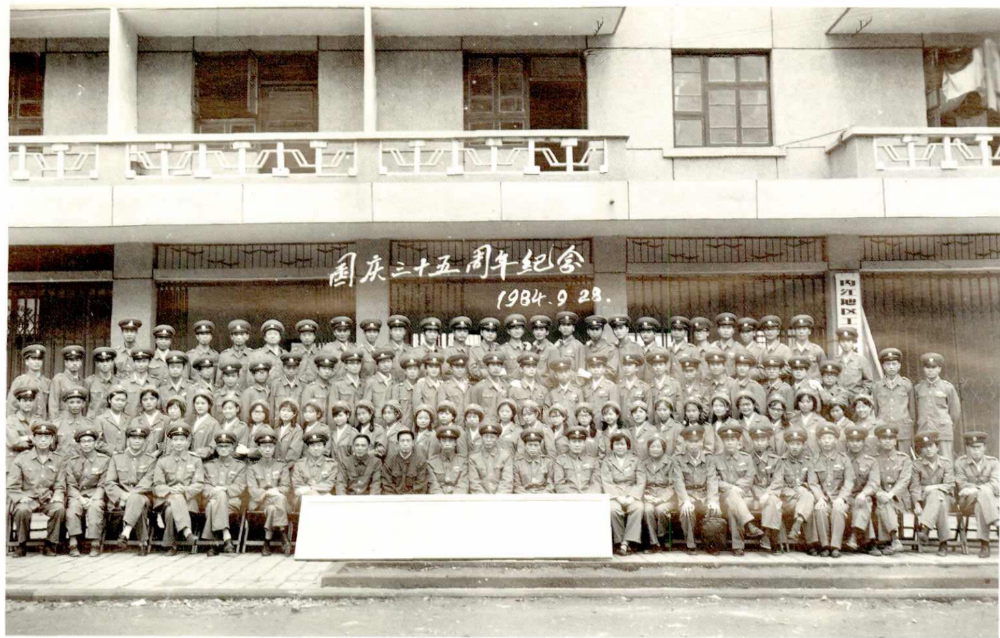
内江地区、市、县工商行政管理局国庆35周年纪念集体合影