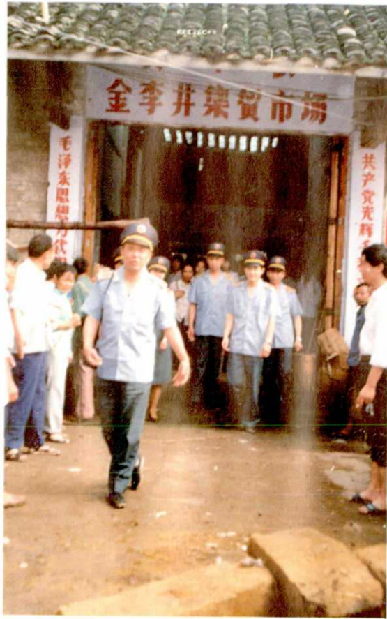
资中县渔溪区金李井集贸市场