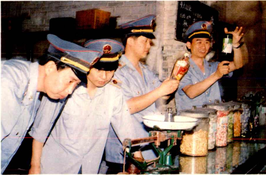
内江市工商行政管理干部对工商企业进行监督管理