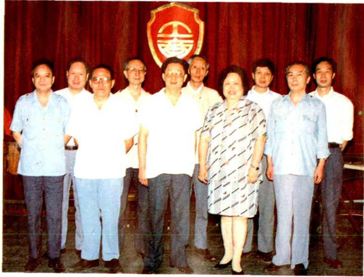
《内江地区工商行政管理志》编纂委员会人员合影