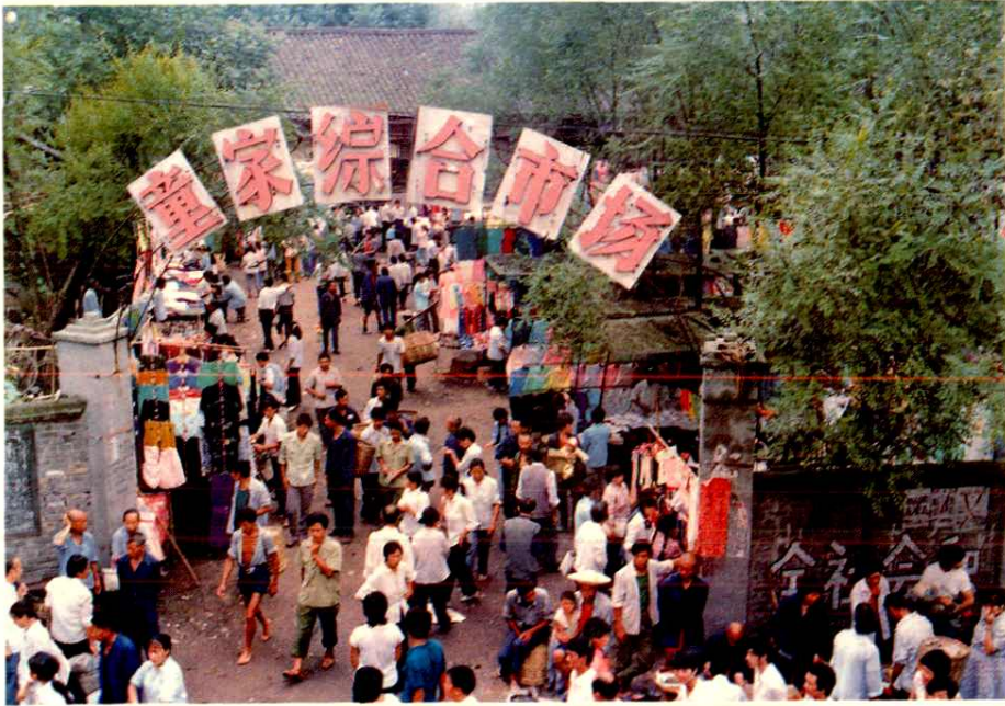
乐至县童家综合市场