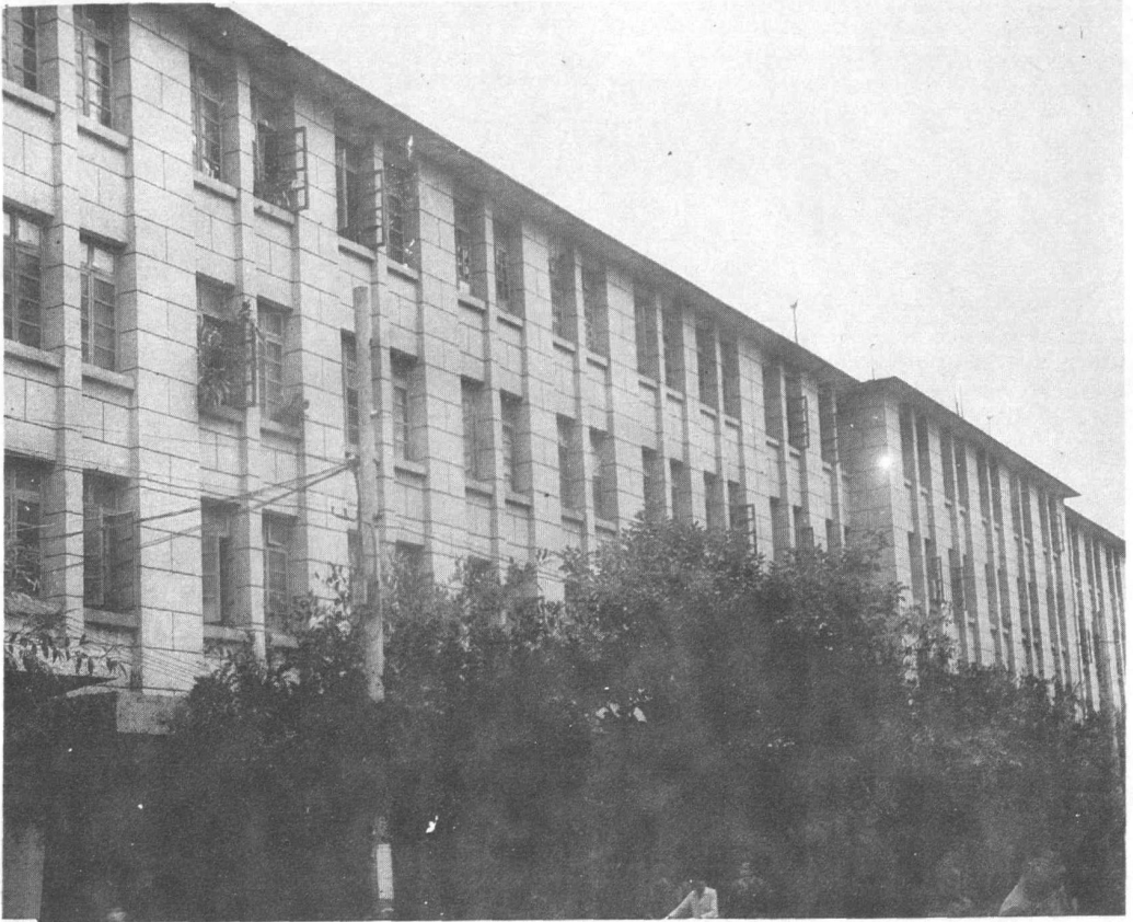
县供销社办公大楼