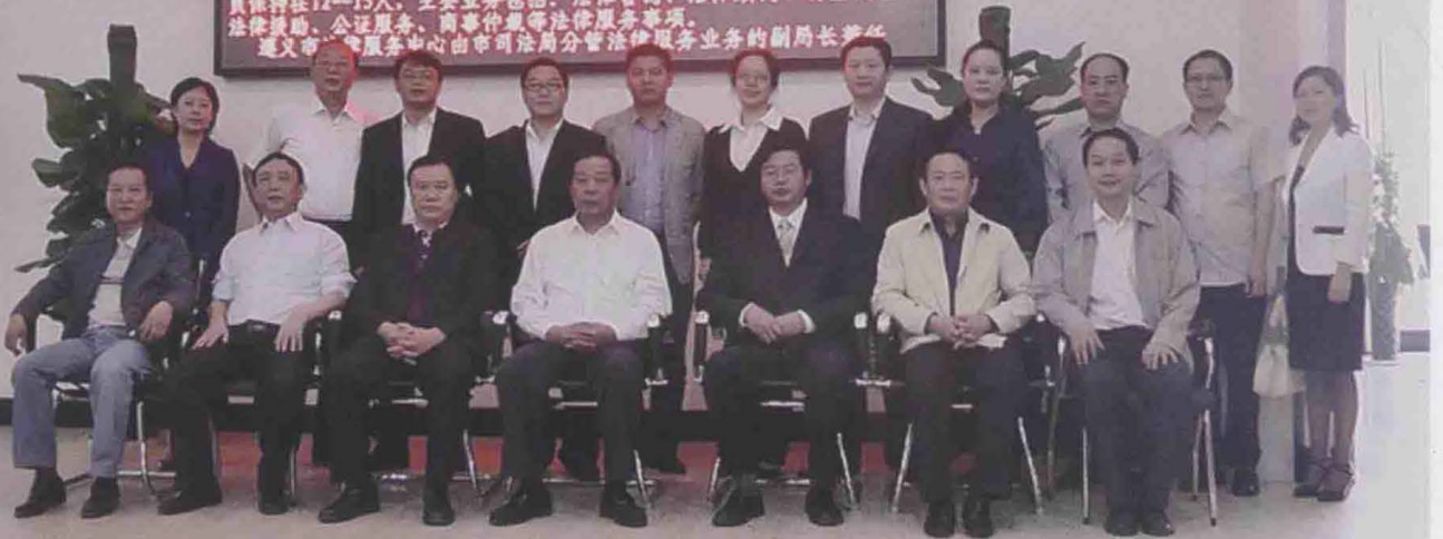
2011年9月27日，遵义法律服务中心成立，遵义市委常委、政法委书记刘小星（前排中）、政协遵义市委常务副主席陈晓红（前排左三），遵义市政府副秘书长石茂彪（前排右三），遵义市人民政府法制办主任杨誉敏（前排左二），遵义市委统战部副部长、遵义市工商联党组书记袁益民（前排右二），遵义市司法局局长肖军（前排左一）会后合影留念。

员和遵义仲裁委员会、市律师协会常驻的方式“窗口式”服务，常驻人员保持在12—15人，主要业务包括：法律咨询、法律顾问、诉讼代理、法律援助、公证服务、商事仲裁等法律服务事项。 遵义市法律服务中心由市委司法局分管法律服务业务的副局长兼任。