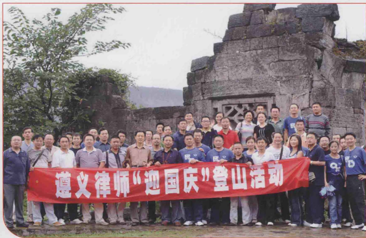
2009年9月，市律师协会组织遵义律师“迎国庆”登山活动，图为登山律师在海龙囤古军事城堡下合影。