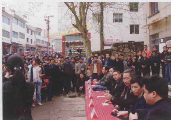
2008年3月，市司法局、市律师协会组织律师赴湄潭县高台镇举办“百日行动”灾后重建法律咨询活动。