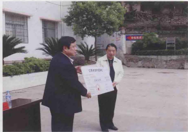
2010年4月，温州市律师协会向仁怀市二合镇捐款10万元。