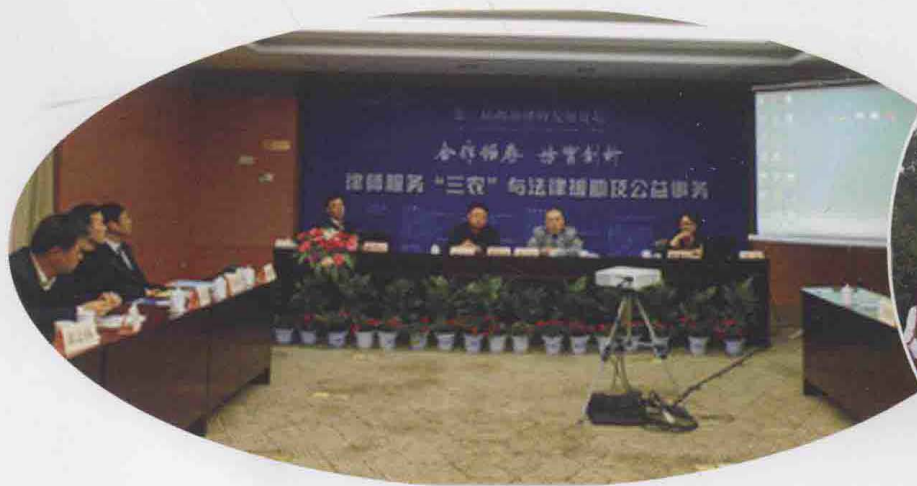
2009年11月，“第二届西部律师论坛”律师服务“三农”与法律援助及公益事务分论坛现场。