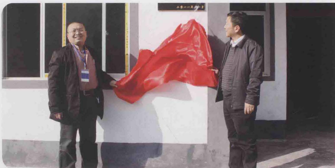
2011年11月，贵州子尹律师事务所捐资3万元与遵义市司法局为汇川区泗渡镇一户困难群众共同捐建房屋。