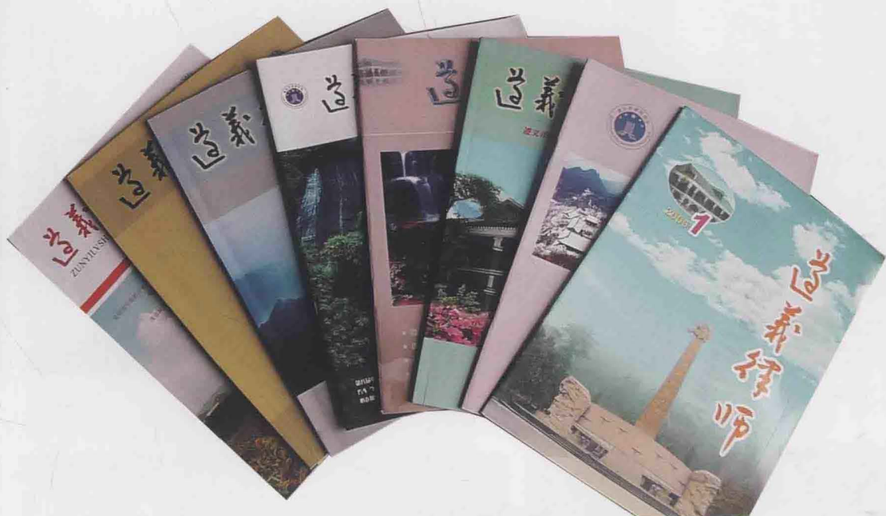
2003年，《遵义律师》创刊，到2013年已出刊43期。