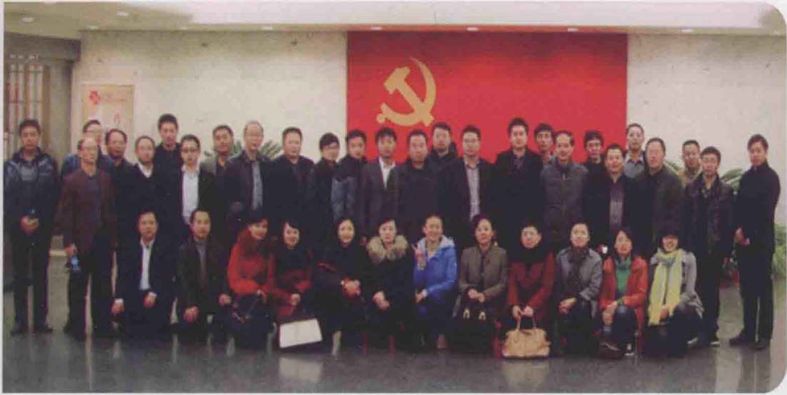
2013年12月，遵义市律师参加上海市普陀区第一期法律服务人才培养班学员参观中共一大会址。