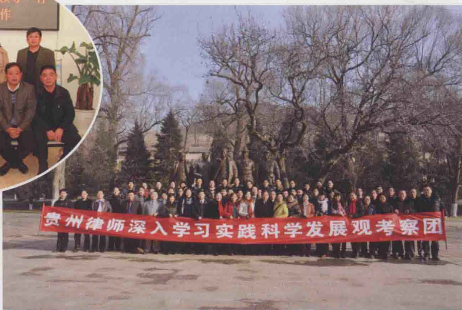
2009年11月，参加贵州律师深入学习实践科学发展观考察团在西柏坡合影。