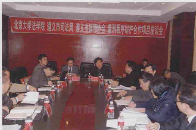
2011年3月，北京大学法学院、遵义市司法局、市律师协会量刑程序辩护合作项目座谈会在遵义大世界酒店举行。