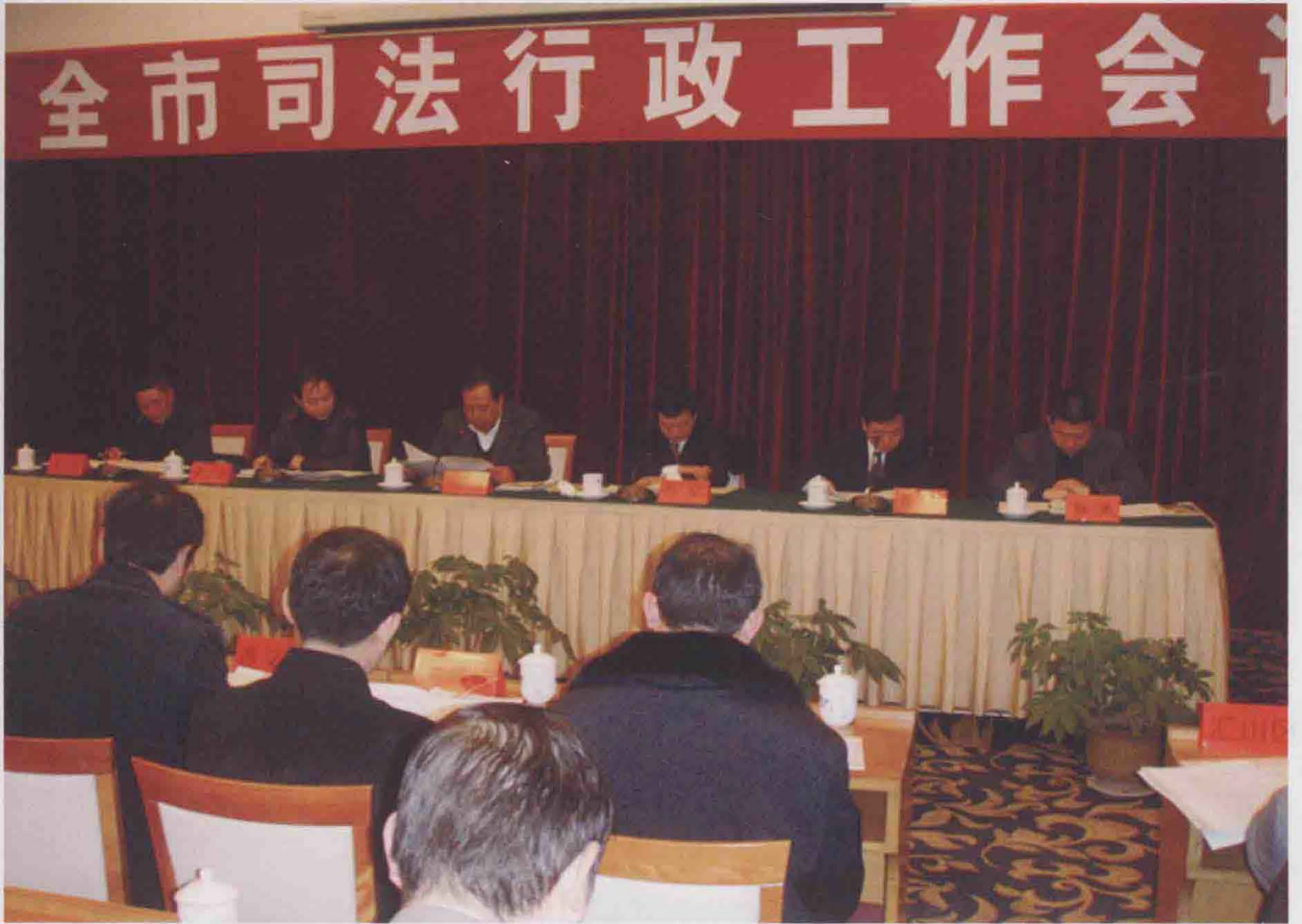
2010年1月，遵义市司法行政工作会议召开，遵义市委常委、政法委书记刘小星等领导参加。