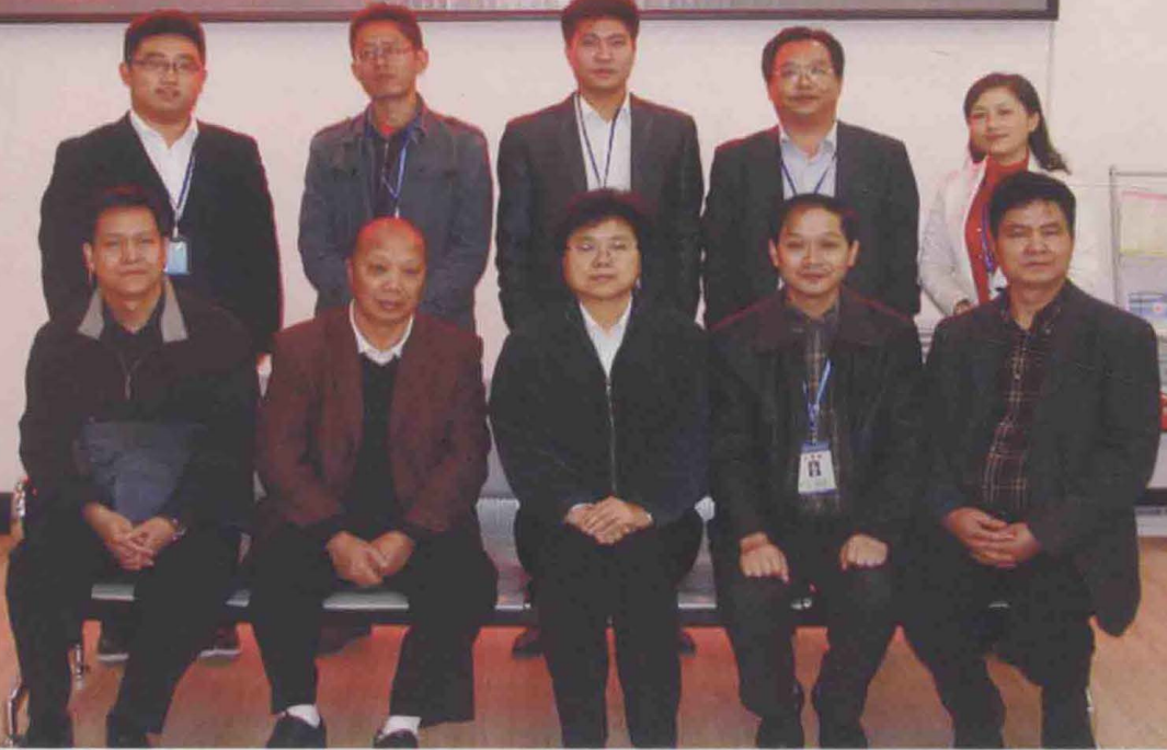
2010年10月，司法部政治部副主任徐辉(前排中)在贵州省司法厅政治部主任黄光友(前排左二)等陪同下视察遵义法律服务工作后与市法律服务中心工作人员合影。

律师事务所、市中心公证处、市法律援助中心轮值派驻执业律师、公证人员和遵义仲裁委员会、市律师协会常驻的方式“窗口式”服务，常驻人员保持在12—15人，主要业务包括：法律咨询、法律顾问、诉讼代理、法律援助、公证服务、商事仲裁等法律服务事项。