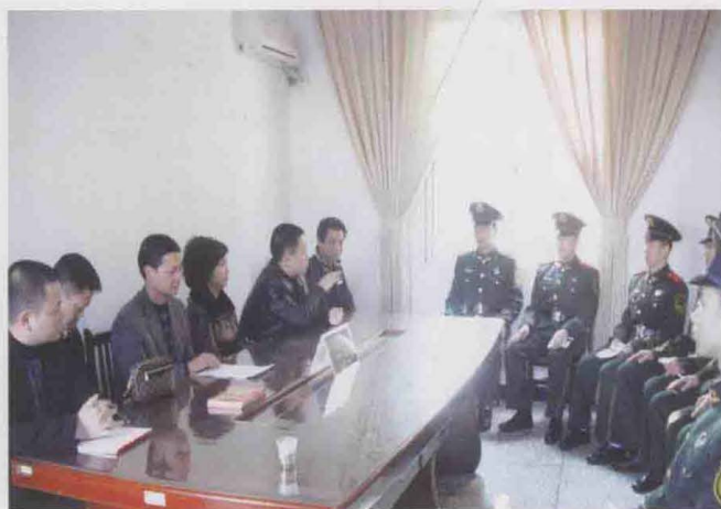
2012年12月，舸林所律师送法进军营。