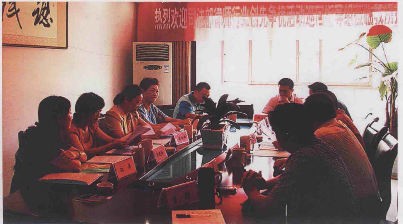
2010年5月19日，司法部律师行业“创先争优”活动巡视组到子尹律师事务所视察。