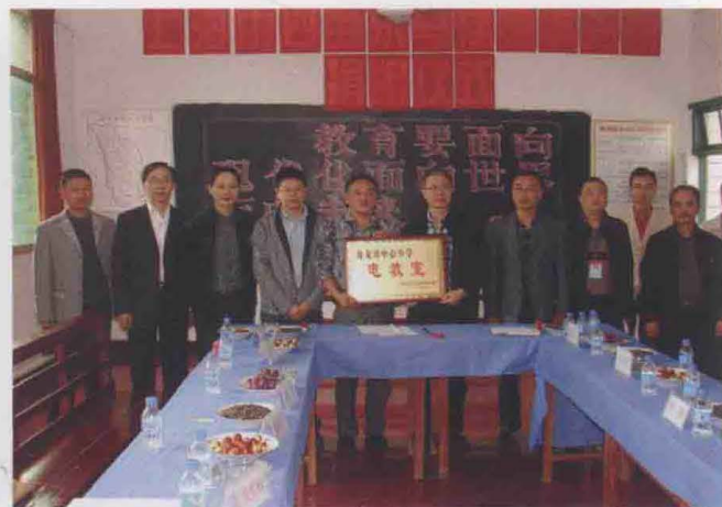
2011年10月，上海四维乐马律师事务所向海龙中心小学捐赠。