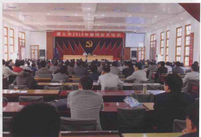
2010年4月，市律师协会在中共遵义市委党校举办年度律师业务培训。