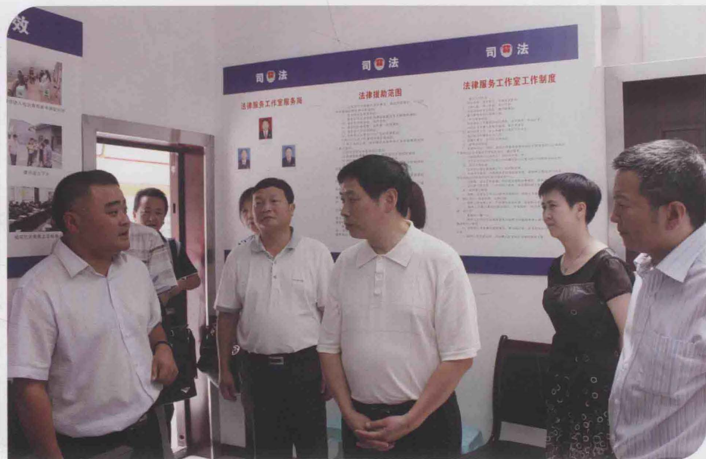
2013年7月，贵州省司法厅厅长吴跃（中）在遵义视察公共法律服务体系建设工作。