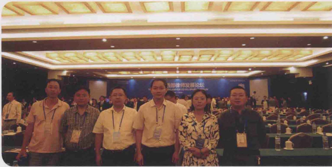
2010年9月，遵义律师参加在广西南宁举行的第三届西部律师论坛。