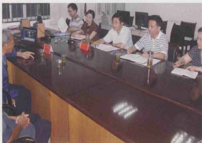
律师参加信访接待，中为时任中共遵义市委书记慕德贵。