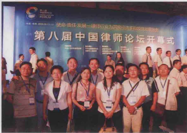
2009年8月，第八届中国律师论坛在成都举行，参加会议的遵义律师留影。