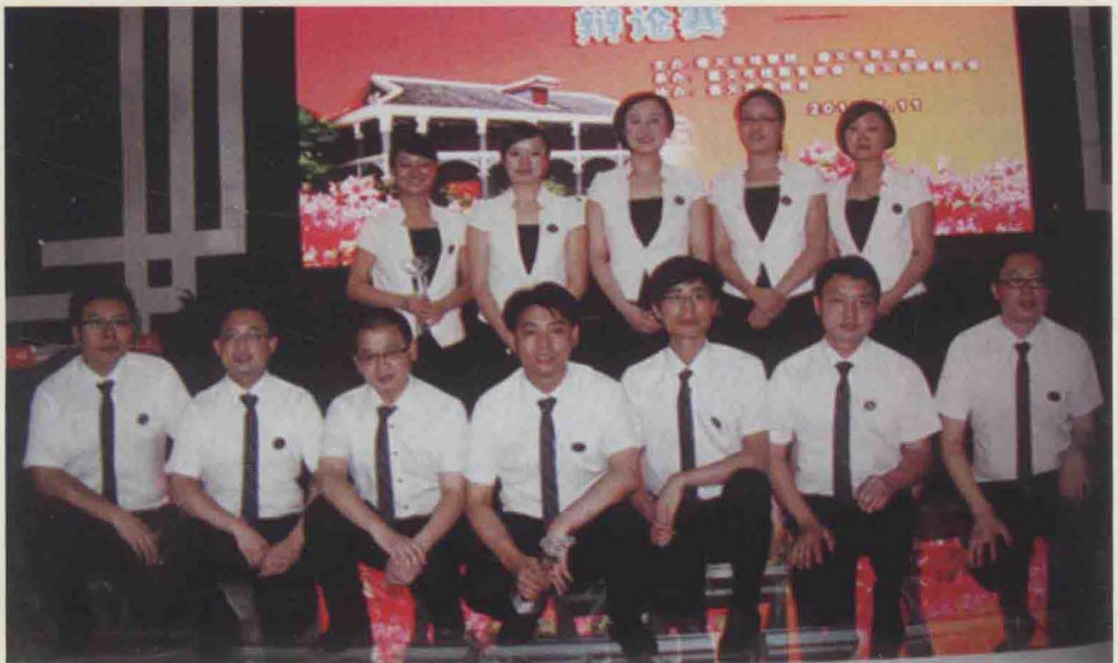
2013年7月，遵义市首届检察官·律师辩论赛举行，参赛律师代表队选手赛后合影。