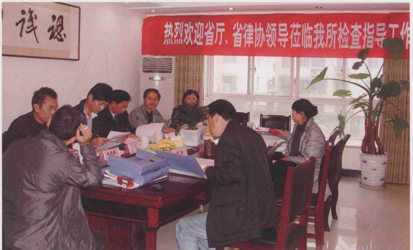
2011年2月，省司法厅、省律协检查组到子尹律师事务所检查工作。