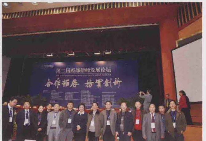
2009年11月，第二届西部律师发展论坛在陕西省西安市举行，参会遵义律师留影。