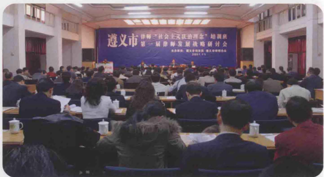
2007年11月，遵义市第一届律师发展战略研讨会。