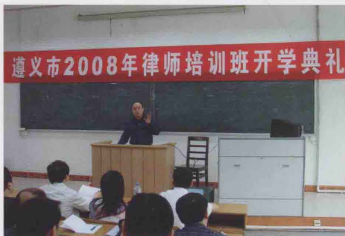
2008年5月，市律师协会在西南政法大学举办年度律师业务培训。