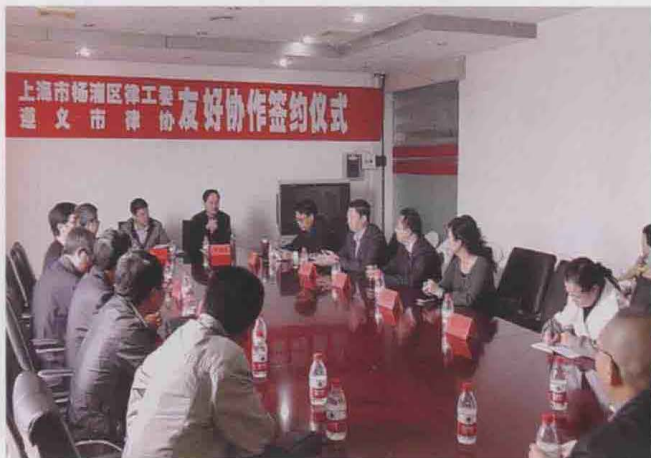
2011年10月，市律师协会与上海杨浦区律工委友好合作签字仪式。