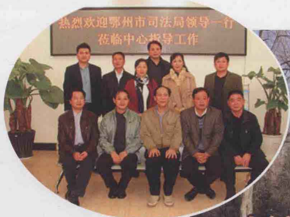
2011年11月，鄂州市司法局领导到市法律服务中心参观考察。