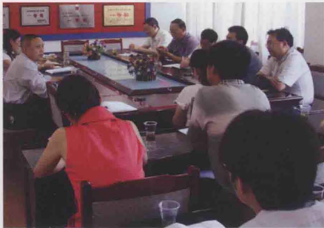
2011年6月，市律师协会党总支纪念中国共产党建党90周年座谈会。