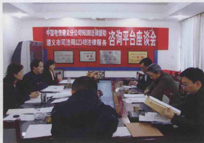
2010年，中国电信遵义分公司96199法律援助遵义市司法局“12348法律服务咨询平台”座谈会。