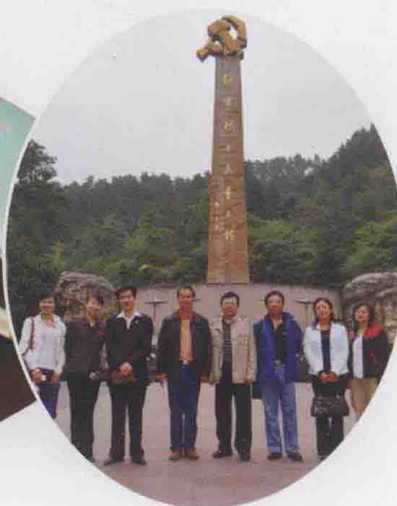
2009年10月，全国律师协会秘书长一行到遵，在红军山留影。