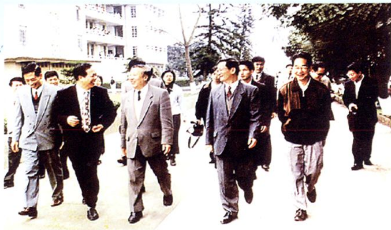
1998年2月，国家教育部副部长周远清（左三）到湛江师范学院视察