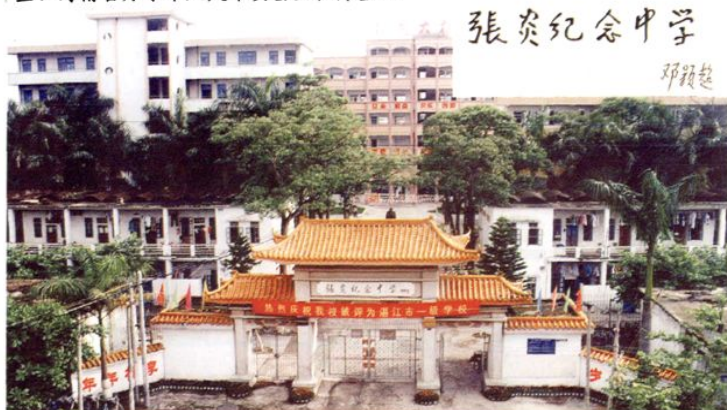
原全国政协主席邓颖超同志1985年为张炎纪念中学题写的校名