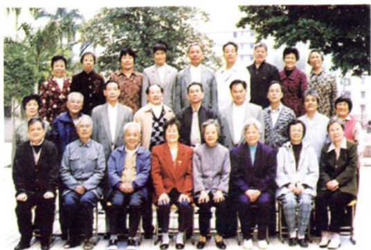
2001年，湛江市师范学院附中邀请该校部分离退休校长、教师合影纪念学校建校四十周年