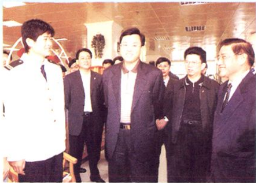
2003年12月，中共中央政治局委员、广东省委书记张德江（左二）视察广东海洋大学