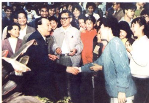
2002年，全国政协副主席杨成武将军（左二）莅临湛江一中，并与师生亲切交谈