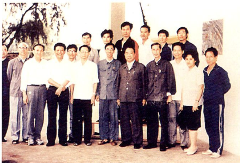
国家体委原主任李梦华（前排右五）莅临湛江一中检查督导体育教学工作