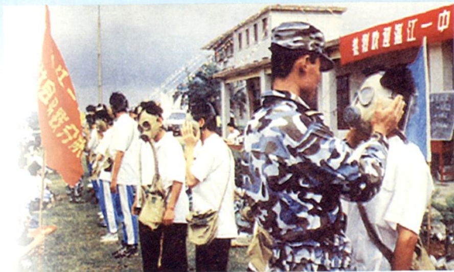
湛江一中学生到工厂开展社会实践活动