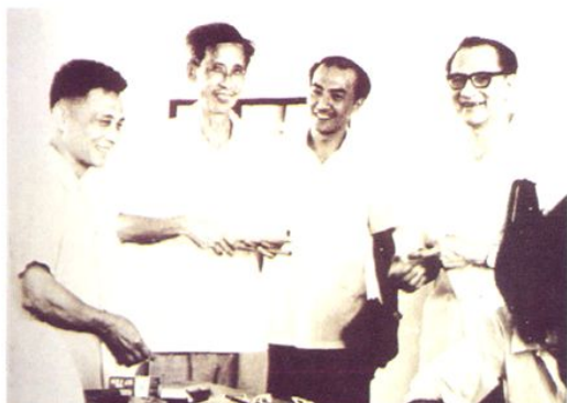
1997年，广东省教育厅厅长杨子江（右二）深入湛江一中调研。