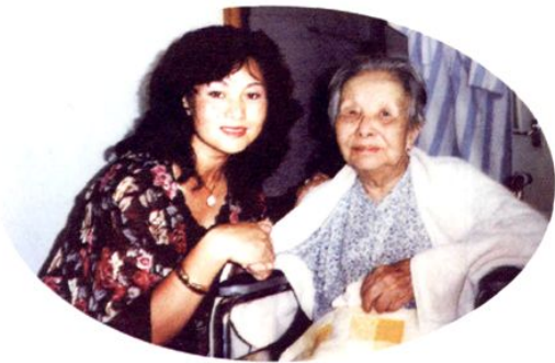
1995年,儿童文学家冰心(右二)为湛江新世纪幼儿园题写园名,并与该园董事长敖平合影