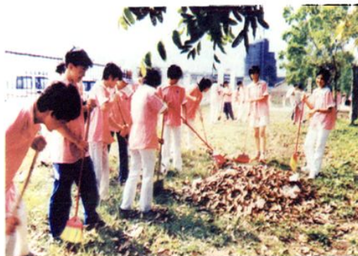
1998年，湛江师范学院附中学生爱护环境卫生，有计划地到赤坎区各街道清扫垃圾，美化市容