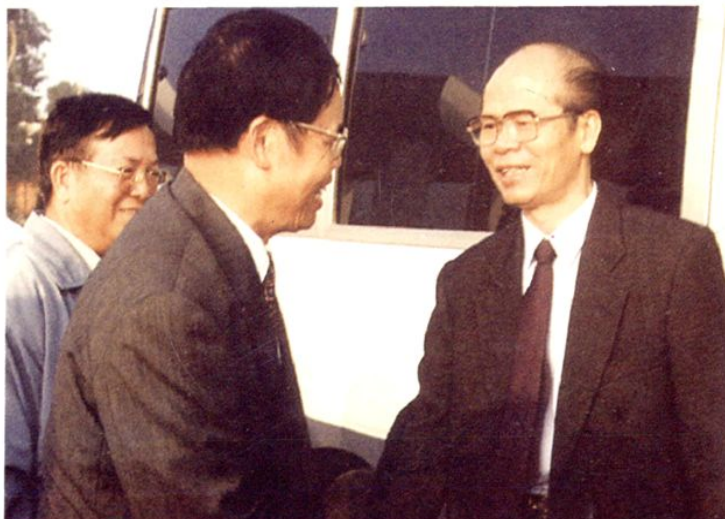
1997年12月，中共中央政治局委员、全国人大副委员长谢非（右一）视察广东海洋大学，与该校领导陈年强、张建中谈话