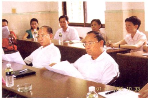
湛江市原市长陈耀光(右二)到市教育局参加高考总结座谈会