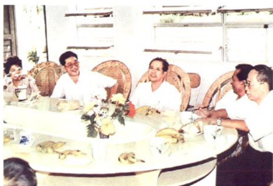
1998年，中共湛江市委书记王治（右三）、市委副书记、市长郑志辉（右二）、市人大主任林彦举（右二）到湛江艺术学校慰问教师