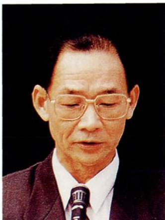
陈钧，原湛江市副市长，1986年9月至1989年1月兼任湛江市教委主任