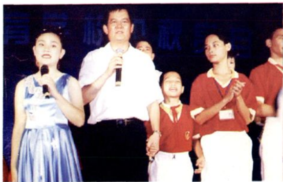
湛江市委书记徐少华参加湛江市特殊教育学校师生中秋晚会，与该校学生合唱《同一首歌》