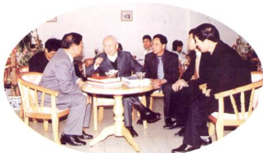
2004年1月，全国政协副主席、科学家钱伟长（左二）到广东海洋大学指导教学研究工作