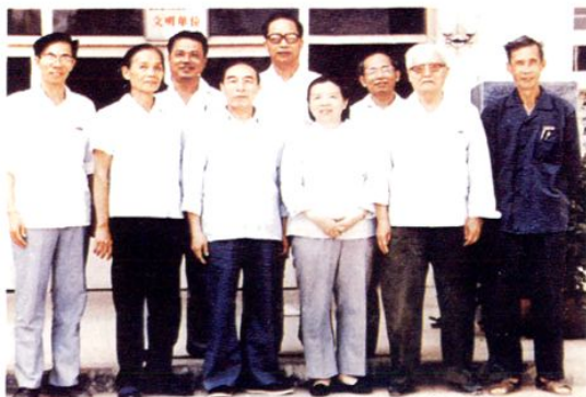
1997年，国家农业部副部长、中共湛江地委书记孟宪德（左三）在湛江地区行署专员黄明德（右二）陪同下视察湛江一中，并与该校校长许克（右一）、副校长杨桀（左一）合影