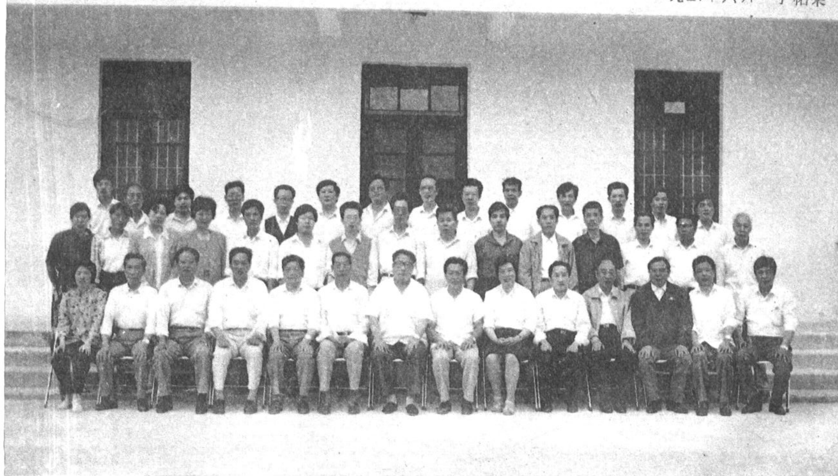
宁德地区第十三次政协工作联席会议留影 (九二年六月于柘荣)