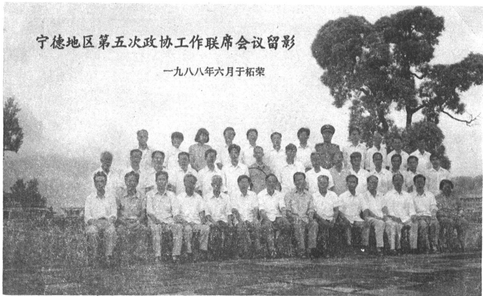
宁德地区第五次政协工作联席会议留影 (八八年六月于柘荣)