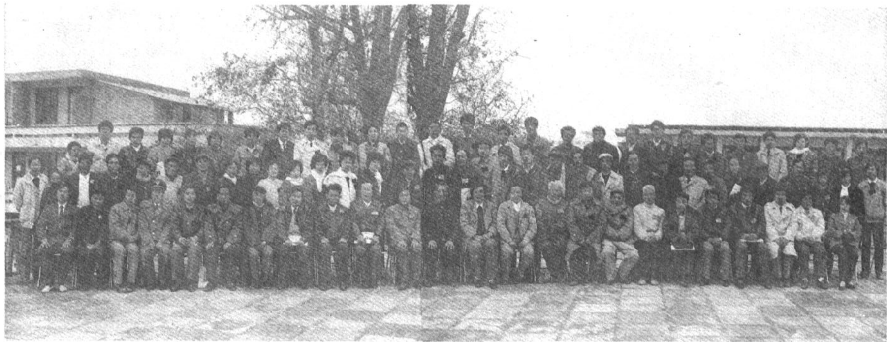
政协柘荣县第三届委员会第一次会议合影