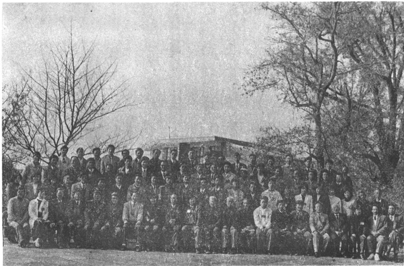
政协柘荣县第四届委员会第一次会议合影