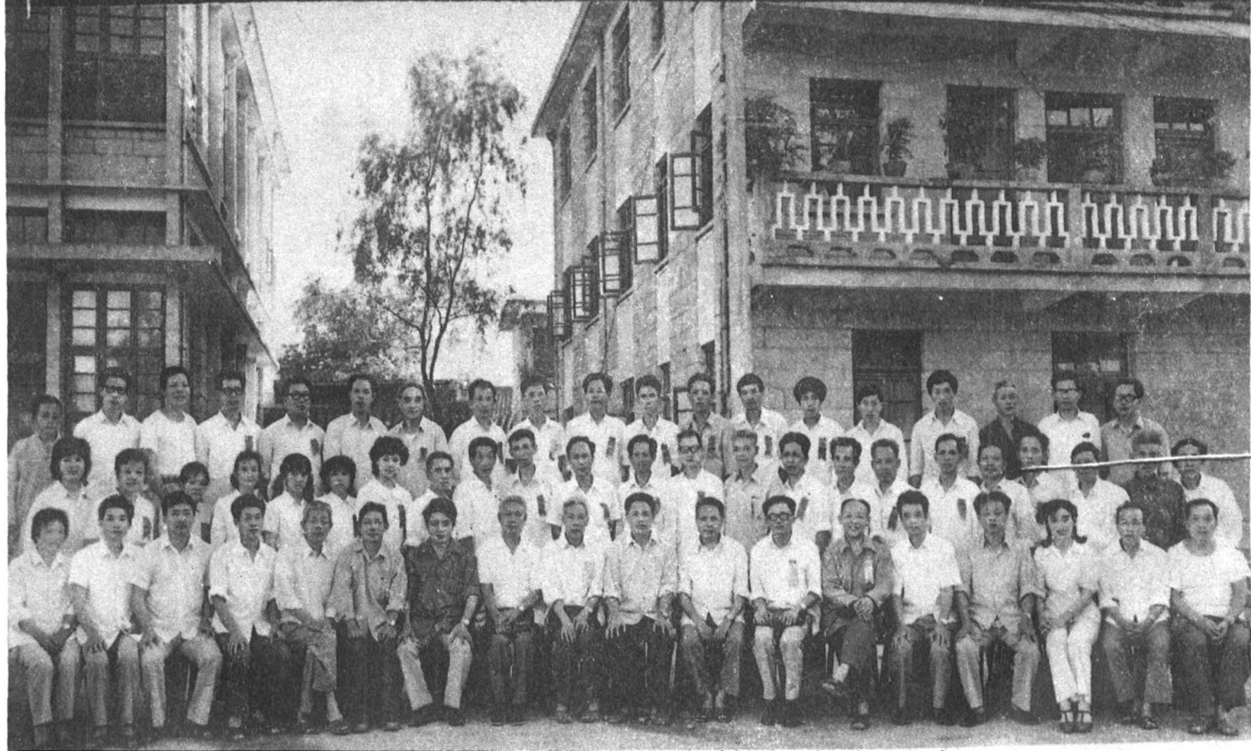
政協柘榮縣第一屆委員會第一次會議合影