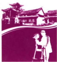
Image and Video Culture of Chinese Bai Villages