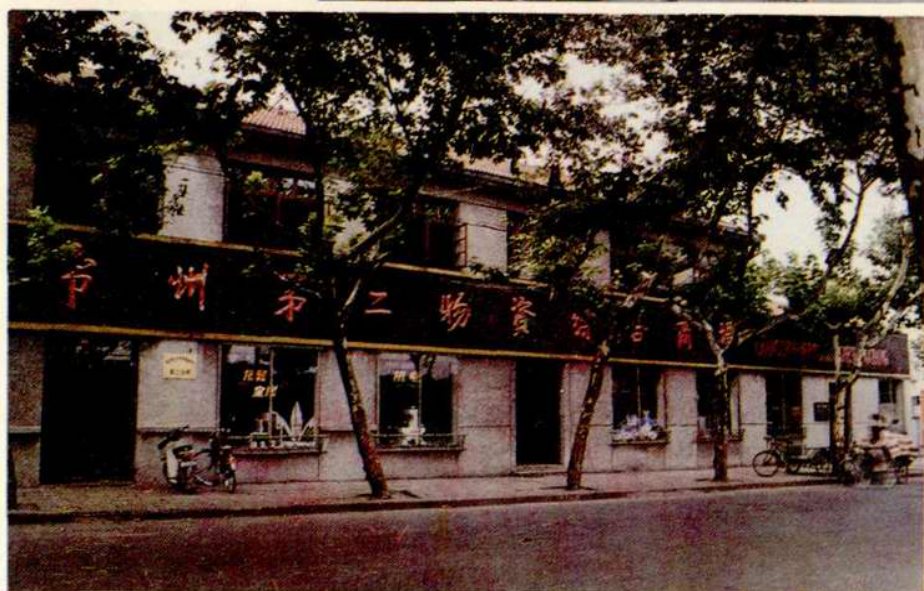
常州第一物資綜合商場