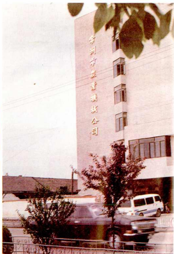
常州市農業機械公司