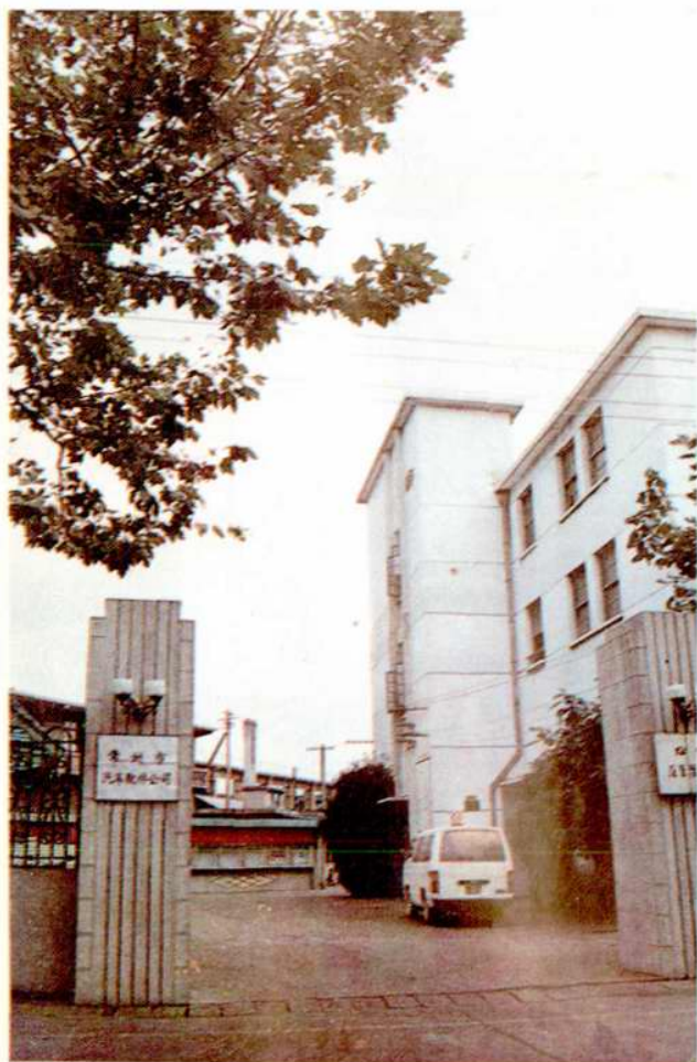
常州市汽车配件公司