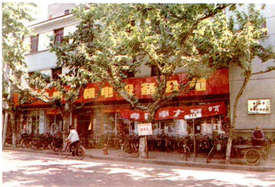
常州市機電設備公司