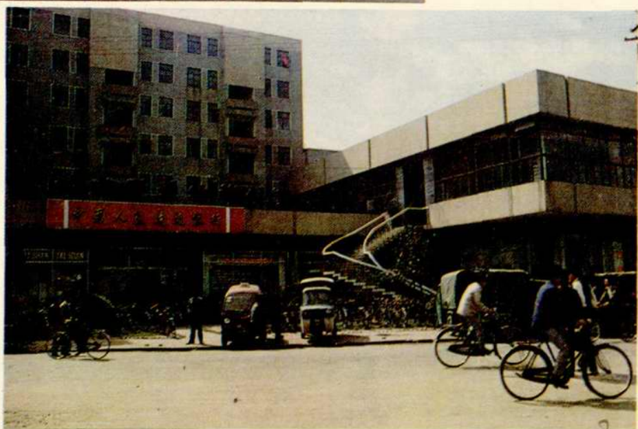
常州戚墅堰物資供應站