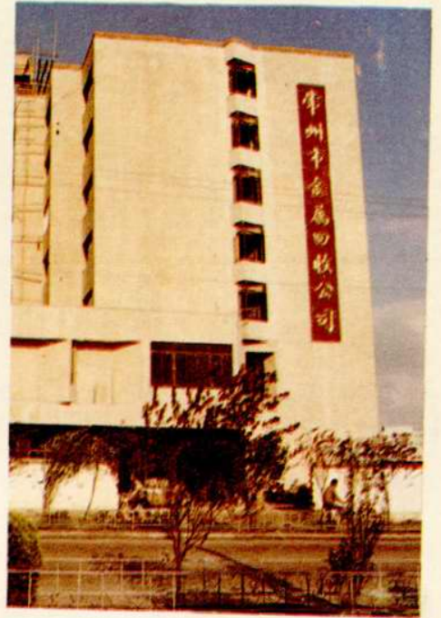
常州市金屬回收公司