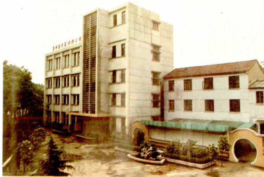
常州市建築材料公司