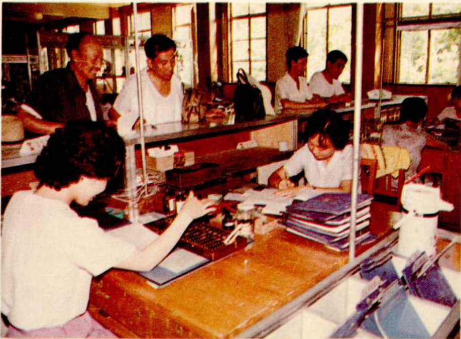
常州市金屬材料公司營業廳