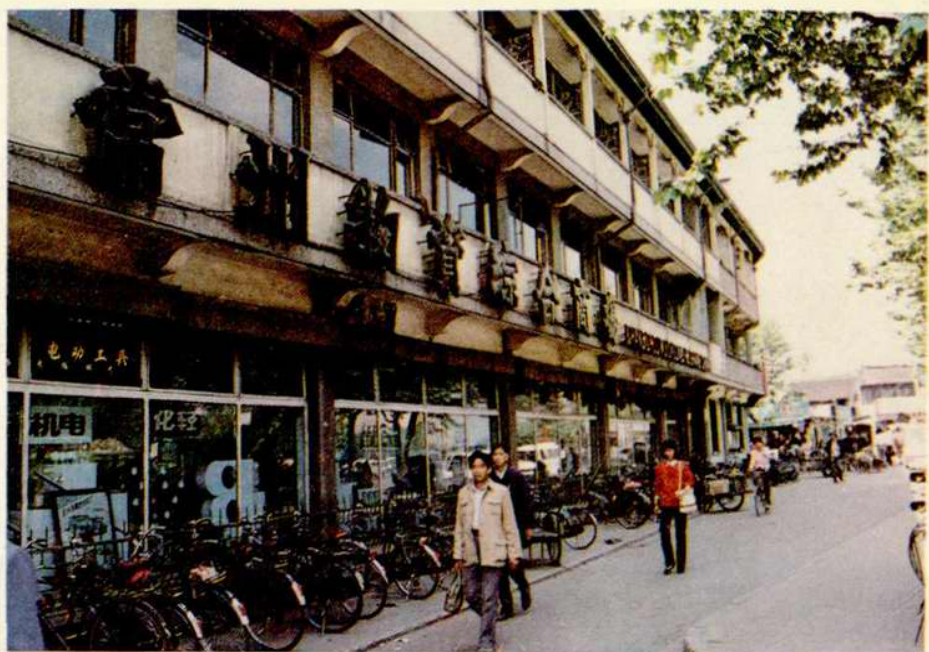
常州物資綜合商場