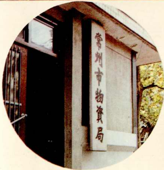
常州市物資大樓 內有常州市物資局機關 常州市金屬公司 常州市生產資料貿易中心 常州市生產資料服務公司