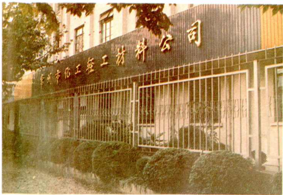
常州市化工輕工材料公司