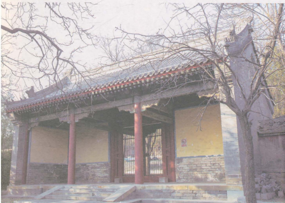
图下：清朝复建的祔恩门。