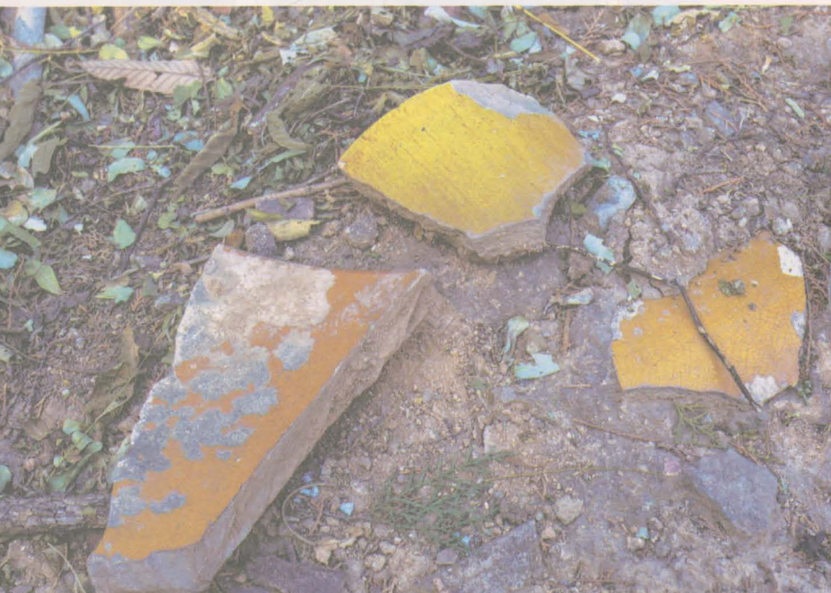
图下：稜恩殿址所遺黃琉璃瓦。