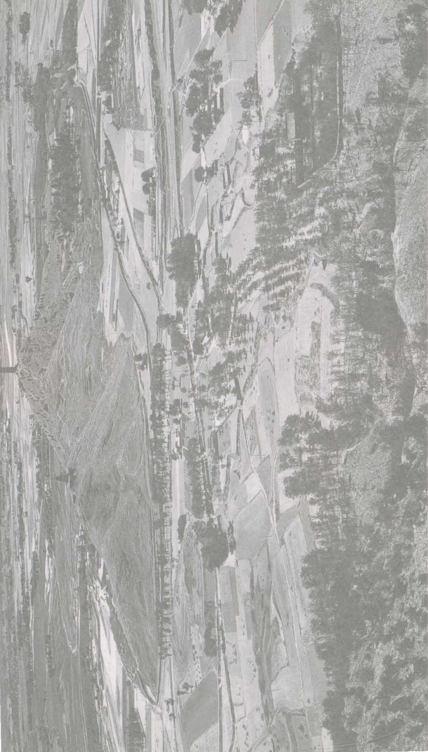
海达·莫循循所摄影秦陵及金山。