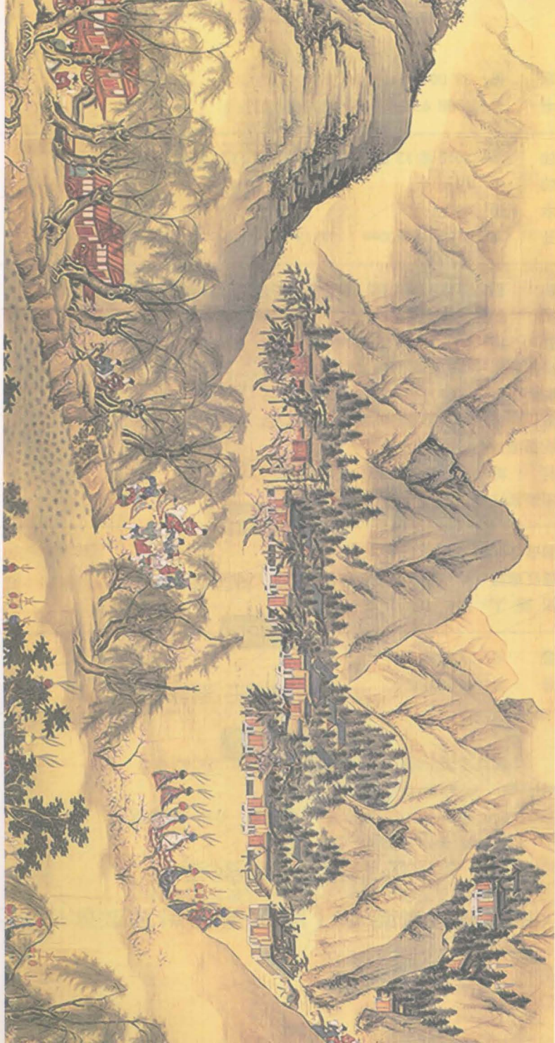
明人绘《入辟图》局部，描绘了明万历年间金山陵园的风貌。