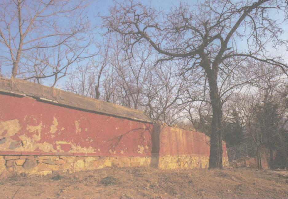
图上：明代所建陵寝西墙。