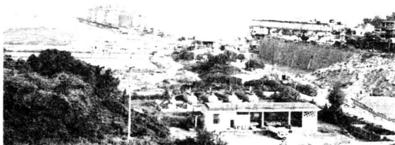
——热火朝天建设中的后渚大桥

泉州港即古刺桐港,是我国东南沿海的著名古港,是畅通于世界各地的“海上丝绸之路”。