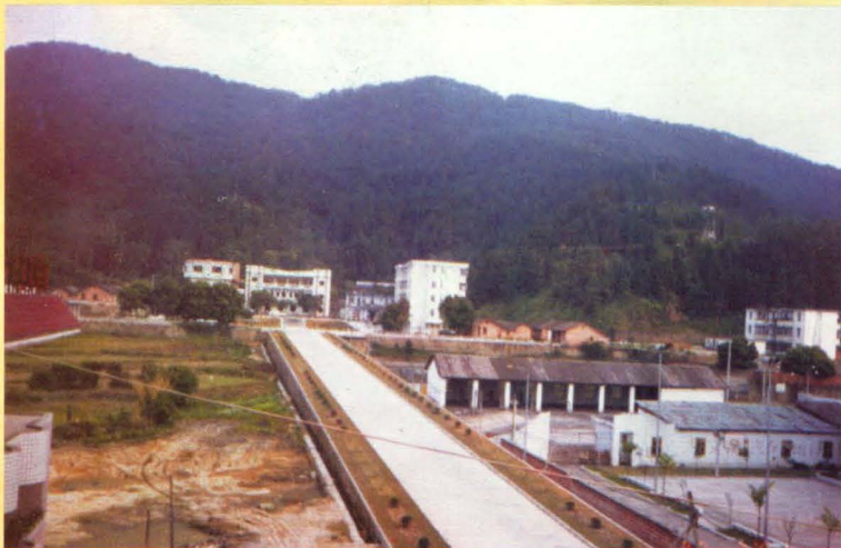
仁化镇政府所在地（水南老虎冲）