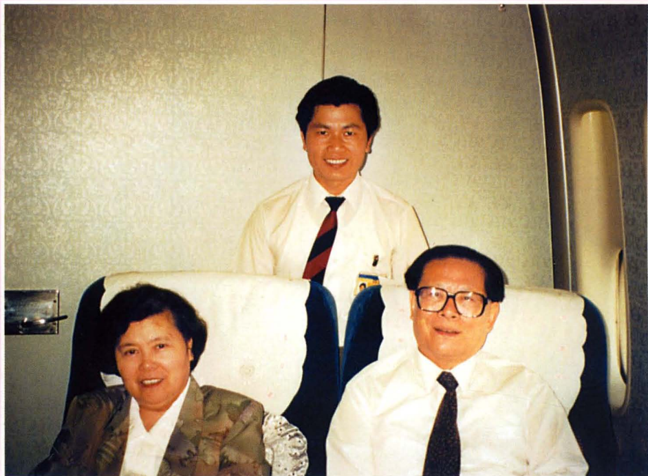
江泽民在照片背面签名：