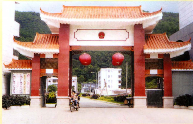
仁化镇政府新门楼