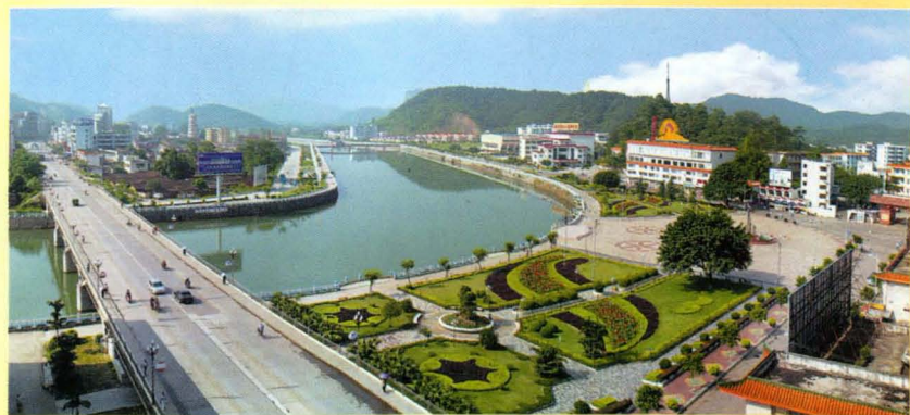
仁化县城大桥、河堤、公园