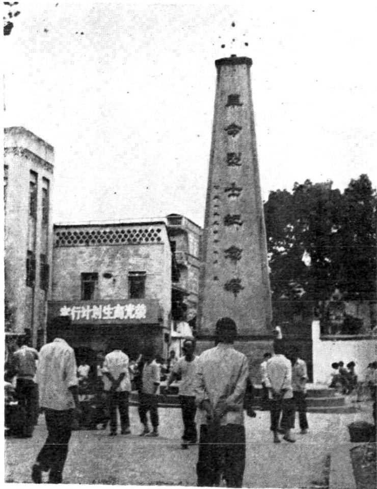
图为革命烈士纪念碑。