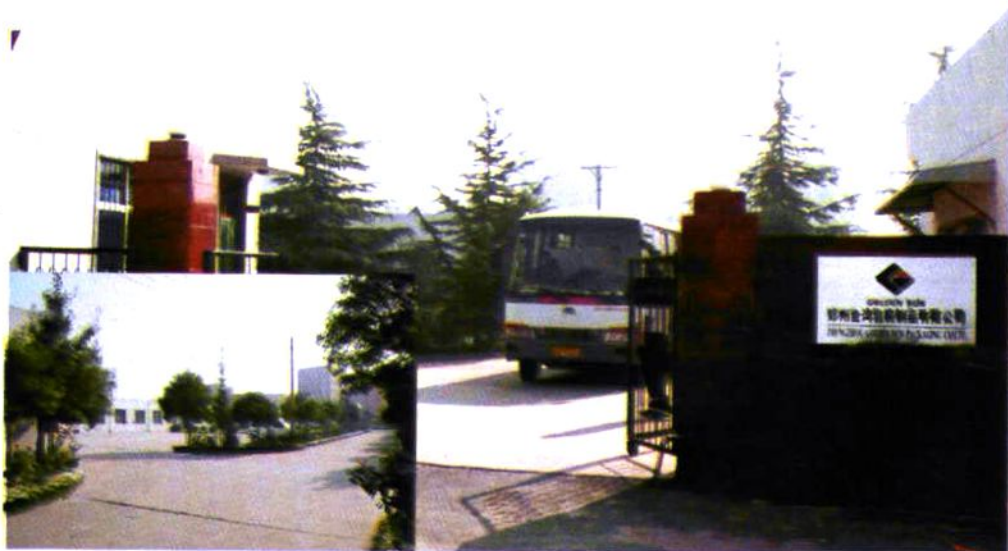
郑州金鸿包装制品有限公司