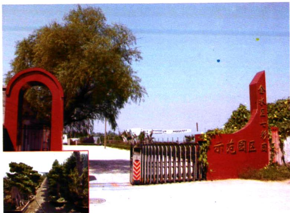
七 彩 园