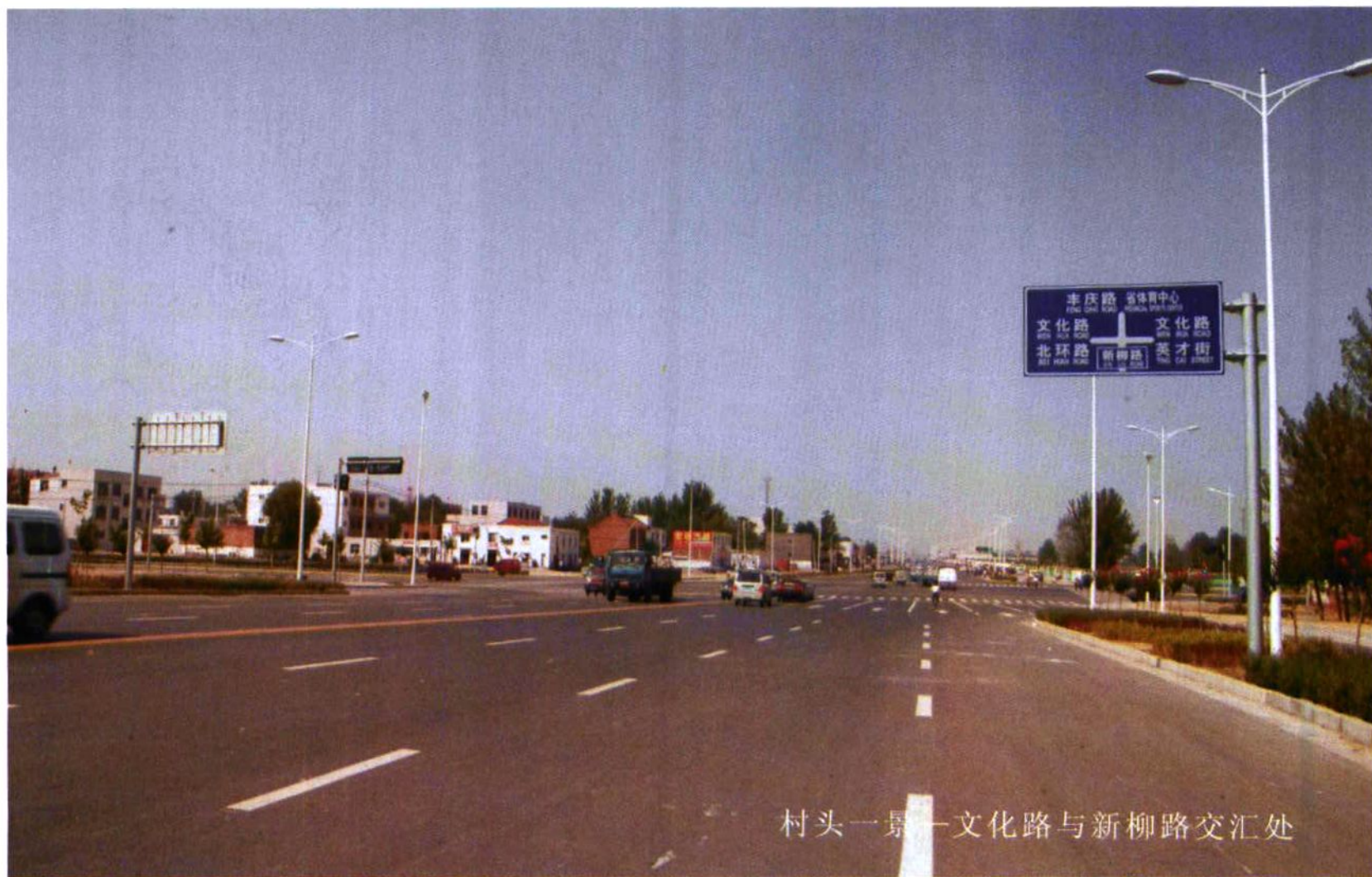
村头一景——文化路与新柳路交汇处