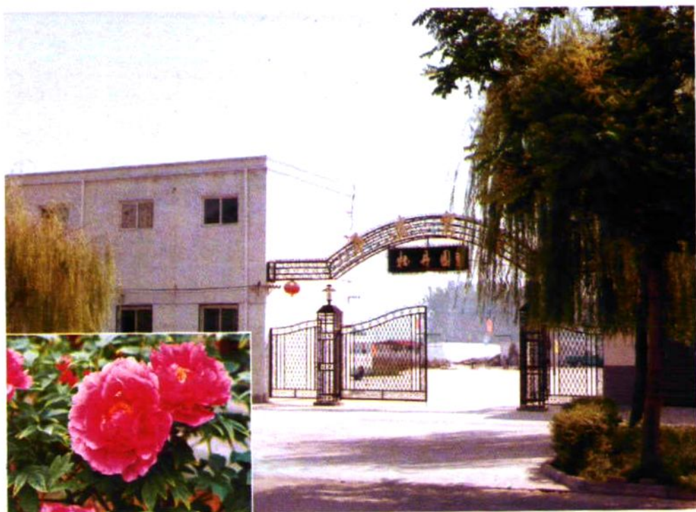
牡 丹 园