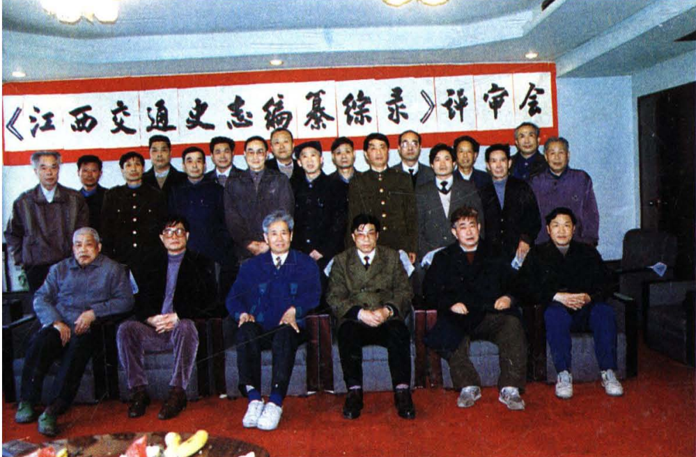
《江西交通史志编纂综录》评审会全体代表合影