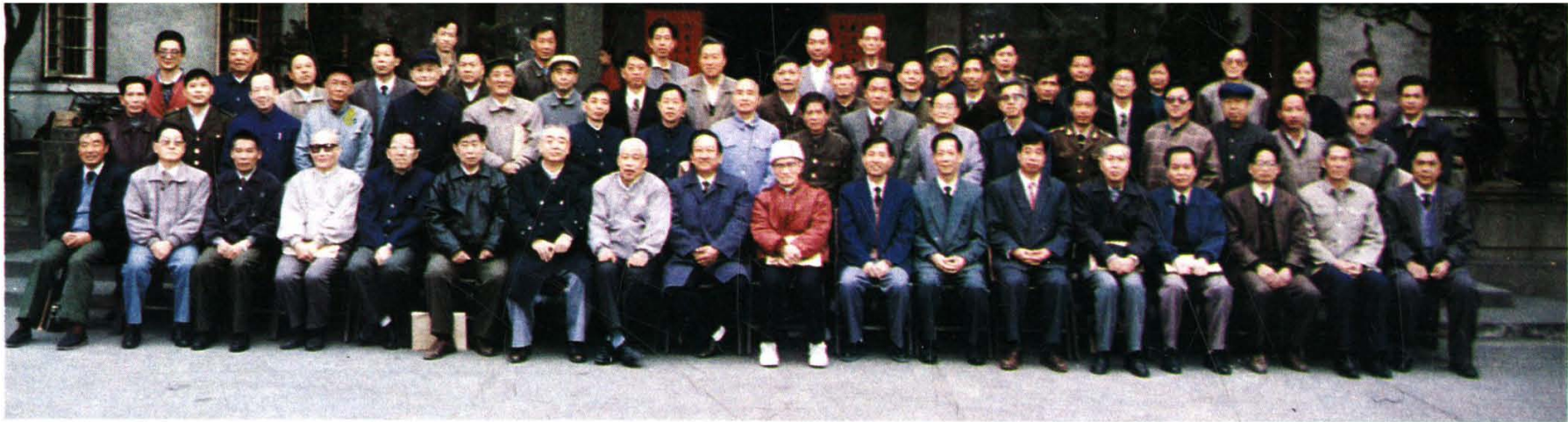
江西省第五次交通史志工作会议代表合影