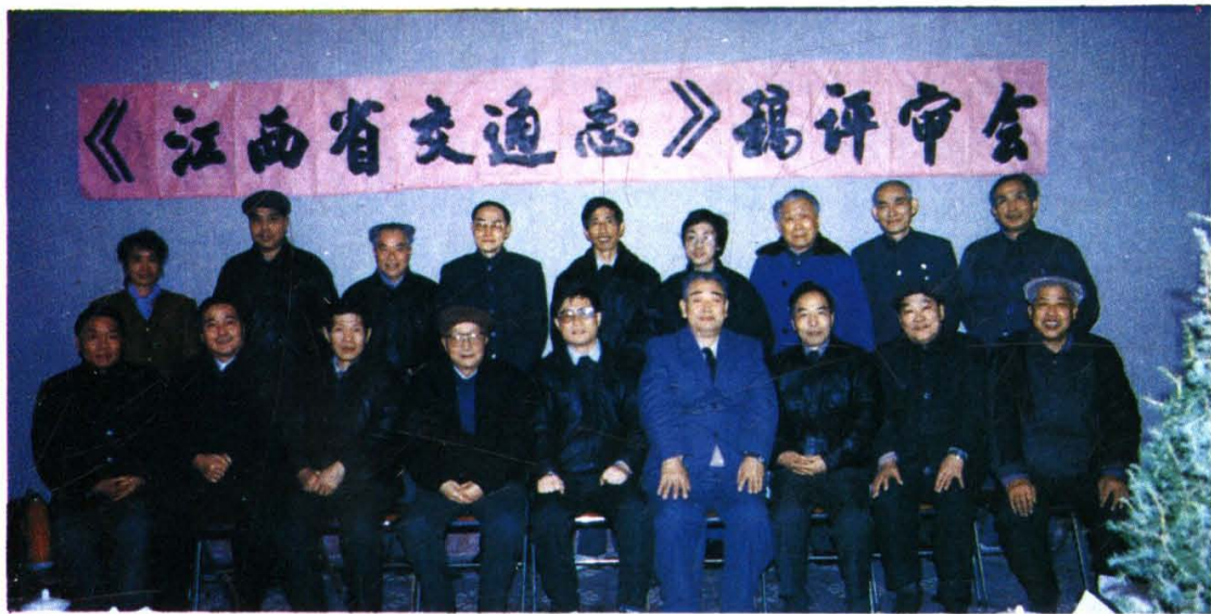
《江西省交通志》稿评审会参会人员合影