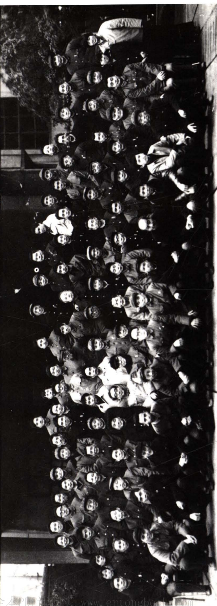
江西省第一次交通史志工作会议合影