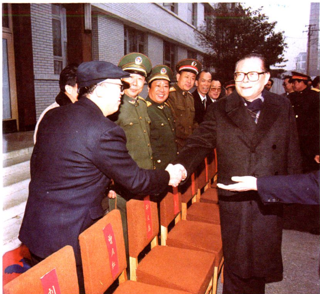
中共中央总书记江泽民在运城地区视察工作时与地委委员、地区纪委书记张吉兆同志亲切握手