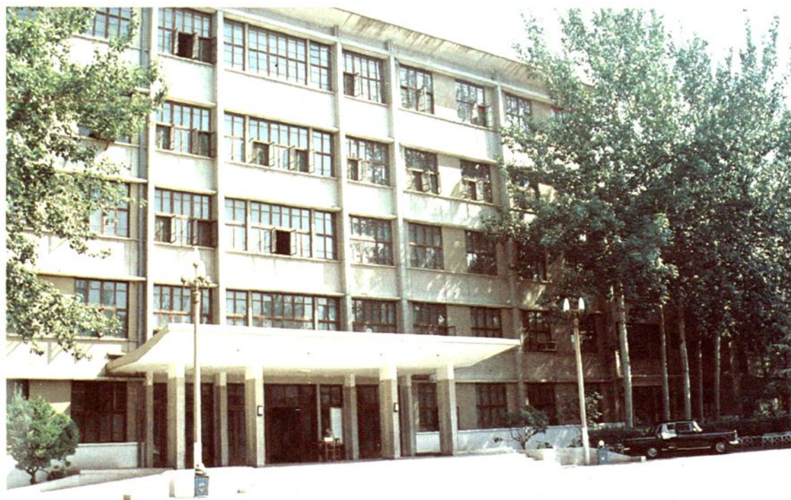
运城地委办公大楼(右侧一、四、五层楼为地区纪委办公之处)