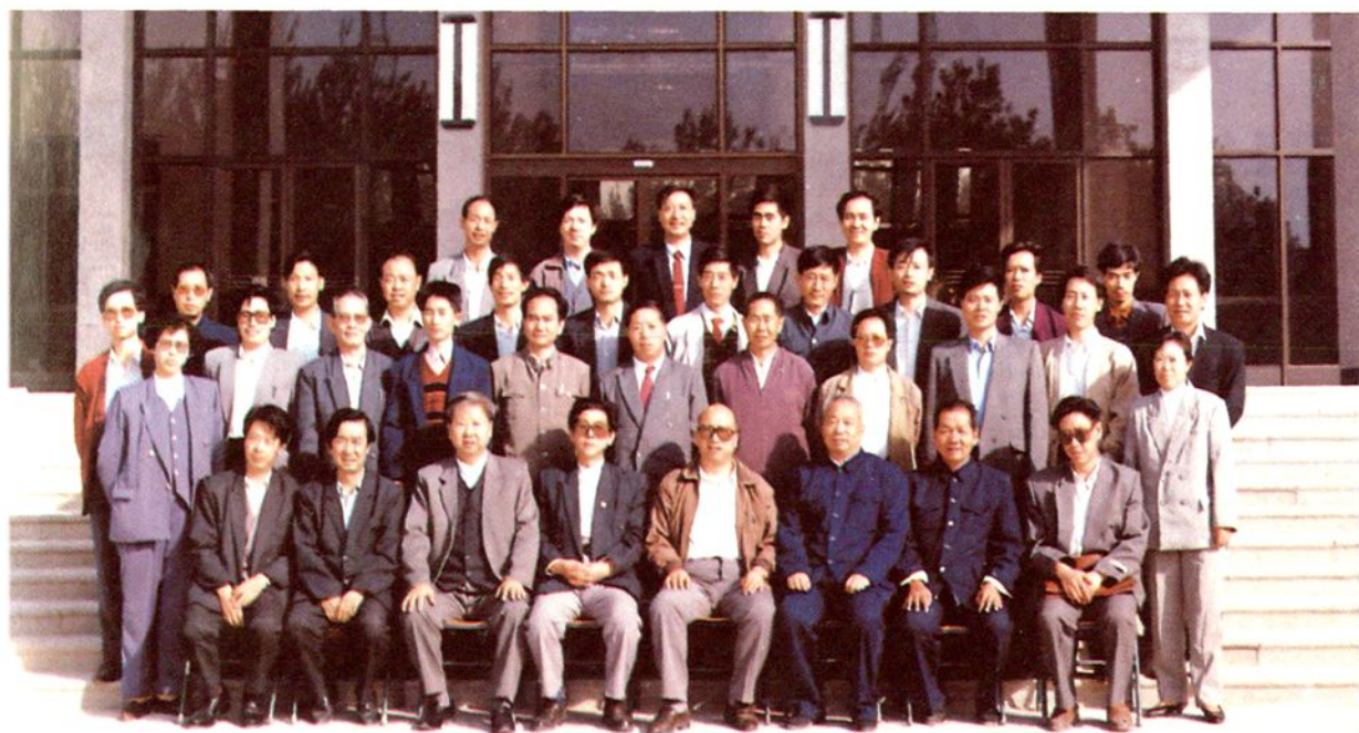
一九九三年三月运城地区纪委全体人员