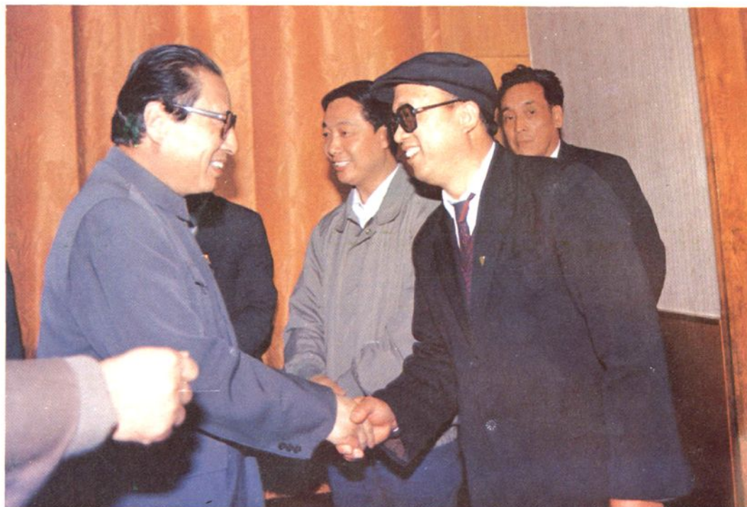
中共中央政治局常委、中纪委书记乔石在运城地区视察工作时接见地委委员、地区纪委书记张吉兆同志