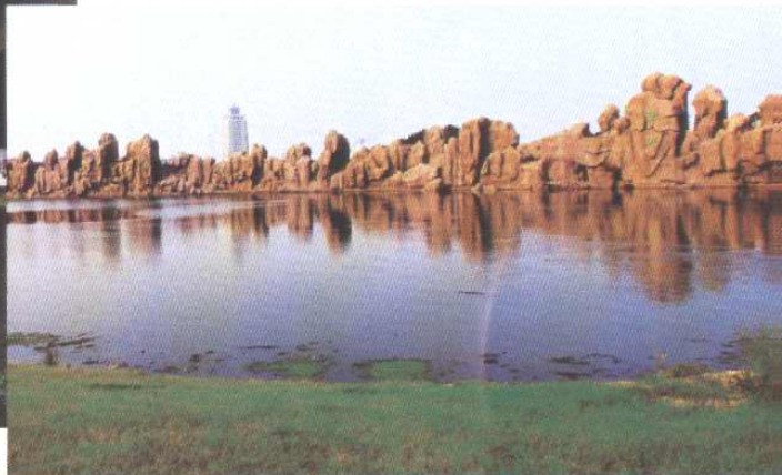
改造后的“三角坑”已成为塘沽区一景