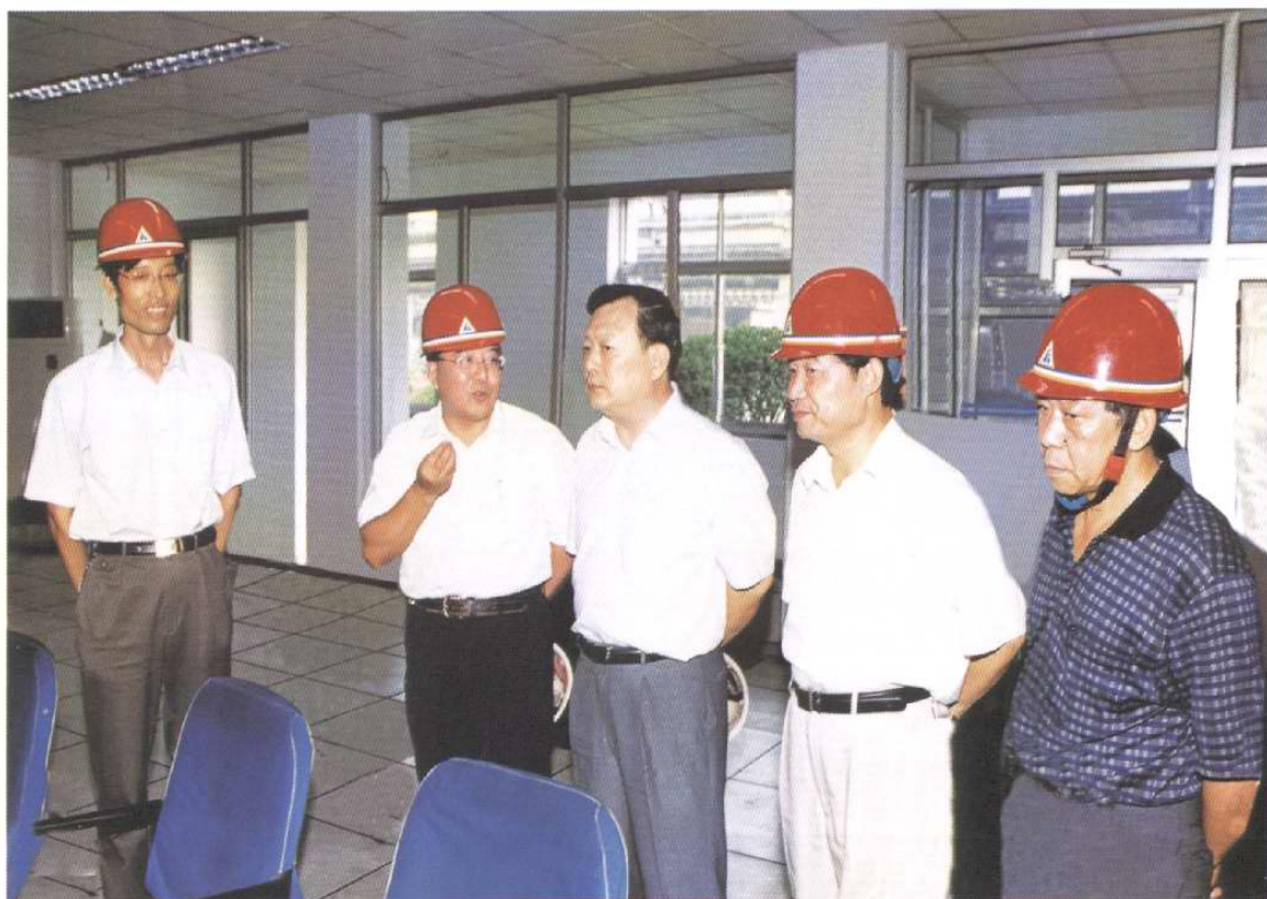
厂领导陪同天津市委常委、常务副市长夏宝龙（左3）集团公司党委书记、董事长王宝弟（右2）集团公司总经理龚锁柱（右1）参观