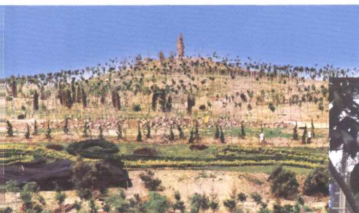
昔日的碱渣山现已改造成紫云公园