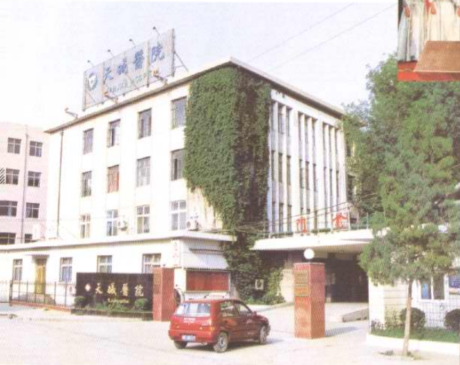
天津碱厂职工医院