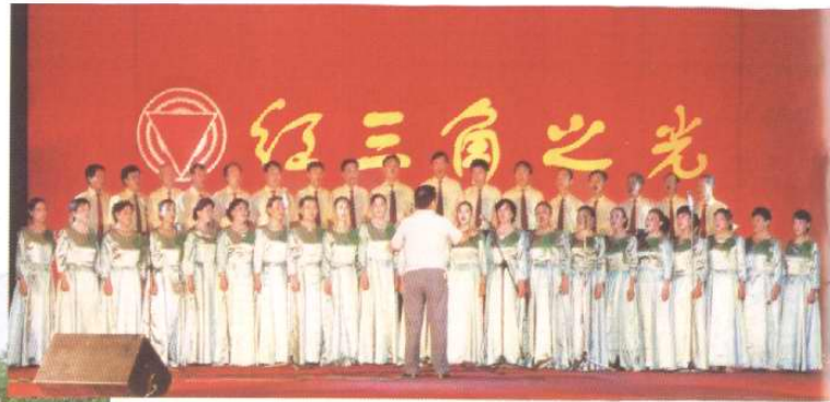
“红三角之光”文艺晚会