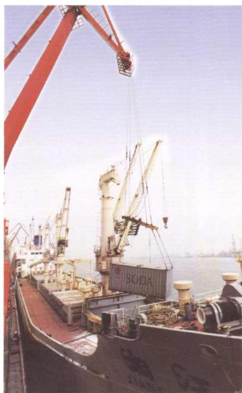
集装箱散装重质纯碱装船出口