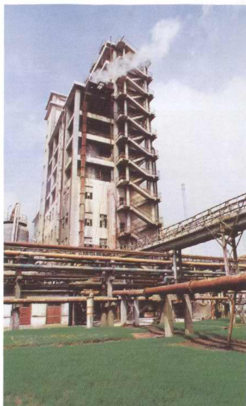
纯碱分厂新蒸吸厂房