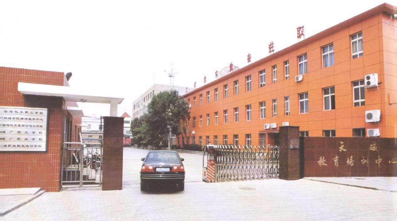
天津碱厂教育培训中心