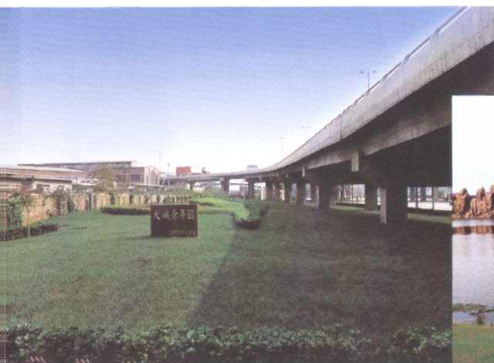
位于厂门前的“天碱青年园”