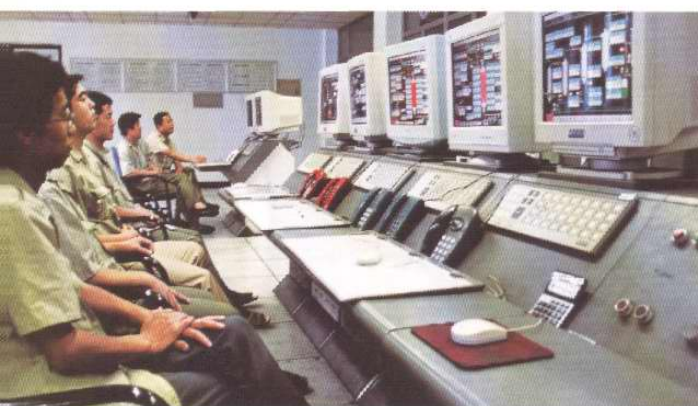
化肥分厂造气主控室