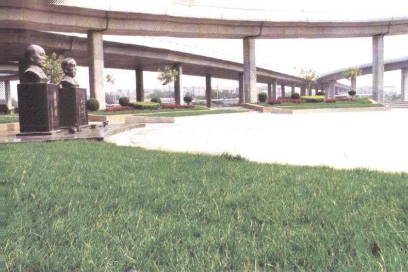
滨海新区最大的“红三角”绿化广场