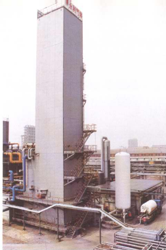
永利气体公司主体设备