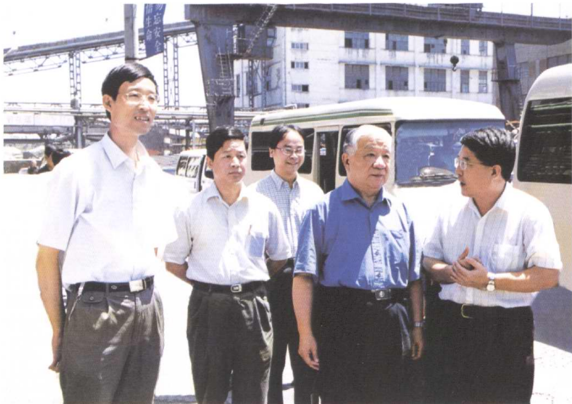
厂领导陪同全国政协副主席王文元（右2）区委书记刘长喜（左2）视察厂区