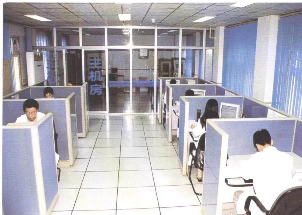
天津碱厂信息中心网站