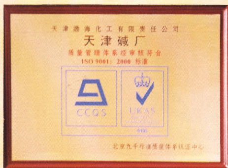
天津碱厂通过 ISO9001:2000 质量管理体系认证