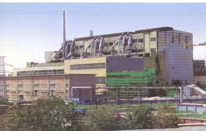
动力分厂主体厂房