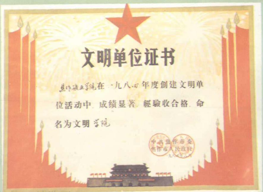
1984年焦作矿业学院被命名为焦作市“文明学院”。图为中共焦作市委、焦作市人民政府授予的“文明单位证书”