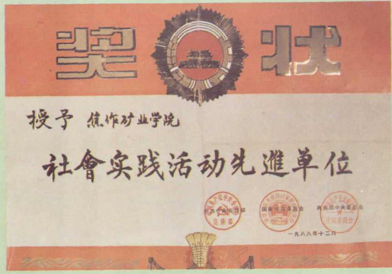
1988年焦作矿业学院被评为全国“社会实践活动先进单位”。图为中共中央宣传部、国家教育委员会、共青团中央委员会授予的奖状