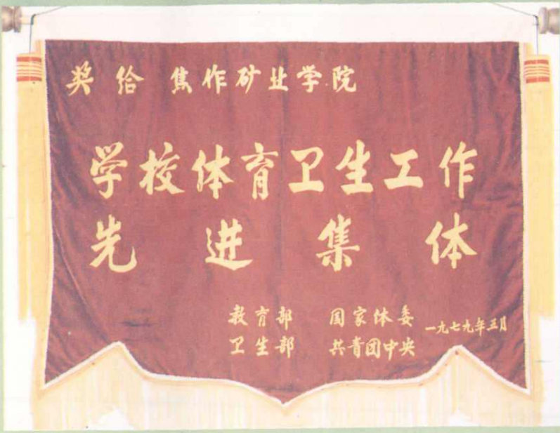
1979年焦作矿业学院被评为全国“学校体育卫生工作先进集体”。图为教育部、国家体委、卫生部、共青团中央授予的奖旗