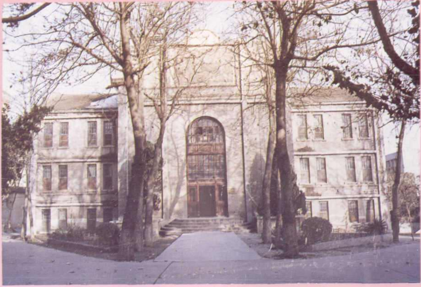
办公楼，原焦作工学院工程馆