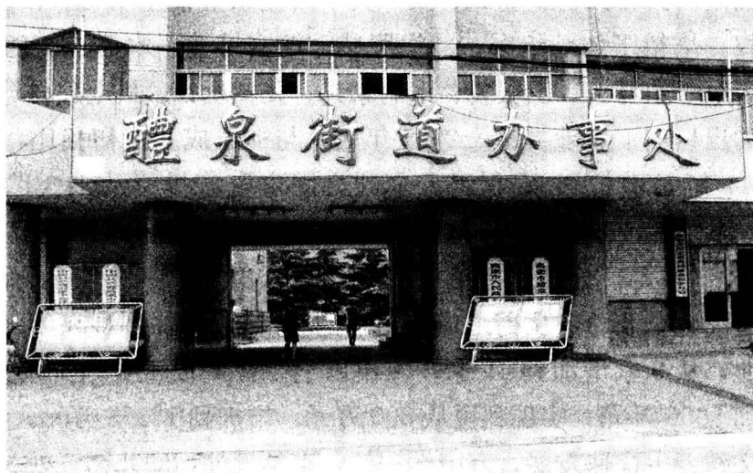
街办办公大楼外景

醴泉街道地处高密市“一个中心，三个板块”的核心地带，东起市中心的夷安大道，西与康庄镇接壤，南依人民大街与密水街道分界，北临仁和镇，为市委、市政府所在地，总体占据高密市中心及西北城郊。境内胶济铁路横贯东西，小康河纵穿南北。版图面积 22.5 平方公里，辖 14 个社区居，7.5 万人，皆为汉族。