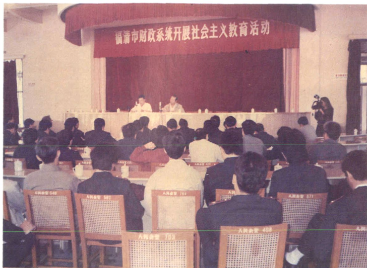
1991年10月，福清市开展财政系统社会主义教育活动。图为动员大会会场