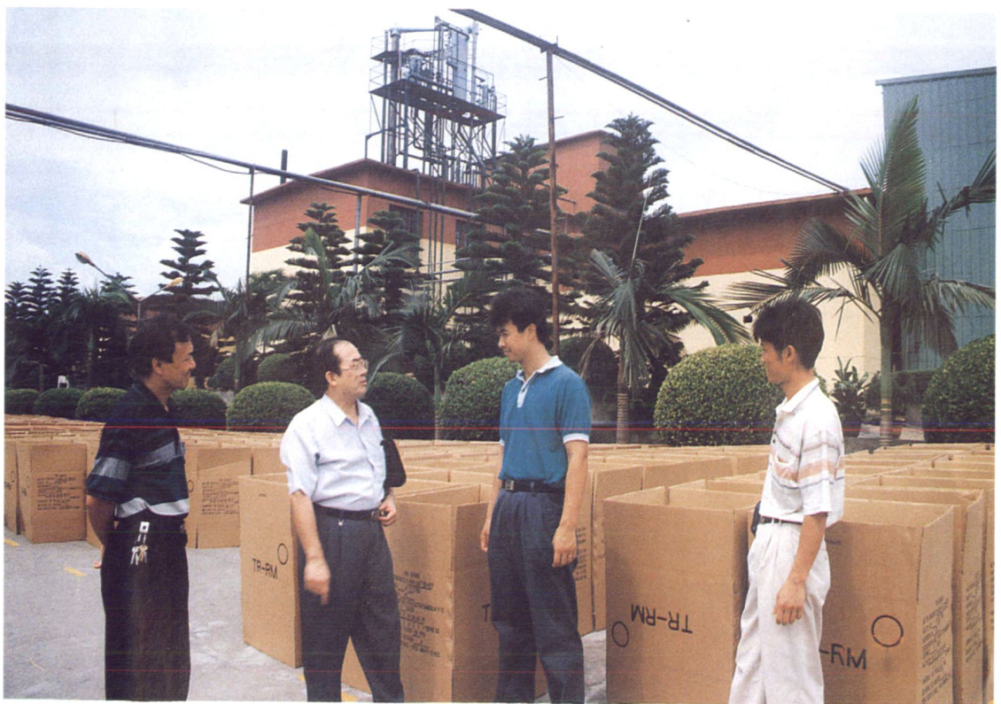
局长李开明到福建天香股份有限公司调研企业生产情况