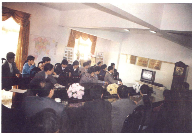
局机关全体干部职工在观看廉政教育专题片