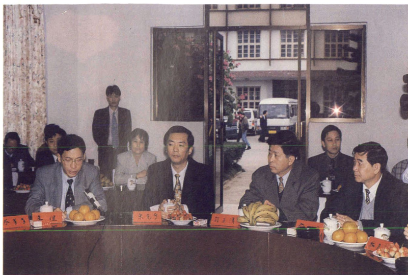
福清市领导研究财税工作