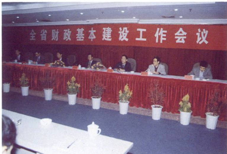
1998年12月,全省财政基本建设工作会议在融召开