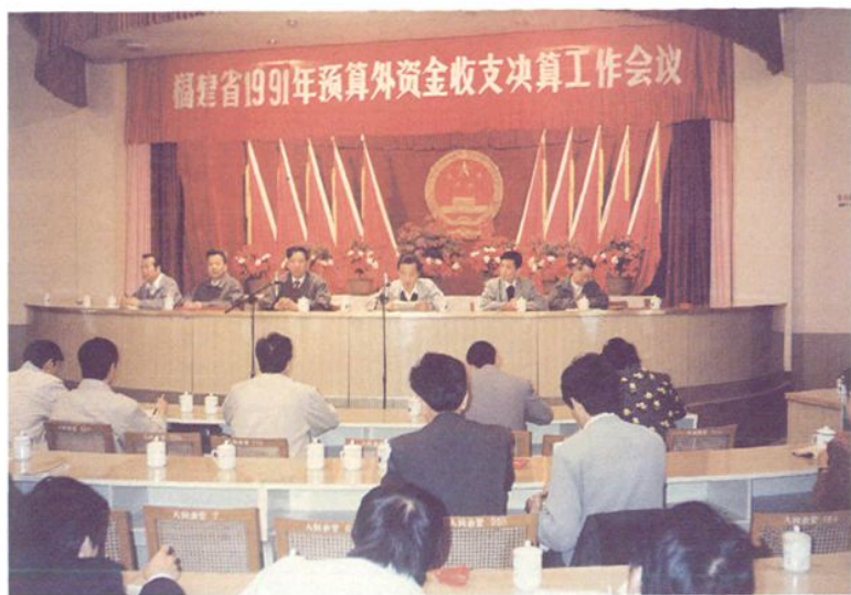
1991年11月,福建省预算外资金收支决算工作会议在融召开