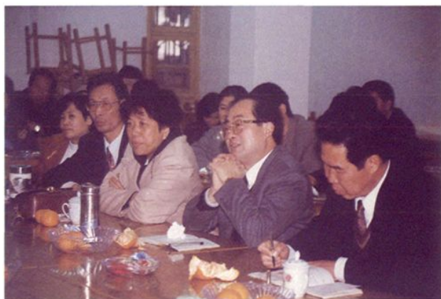
福清市人民政府和财政局领导倾听离退休老干部的意见和建议