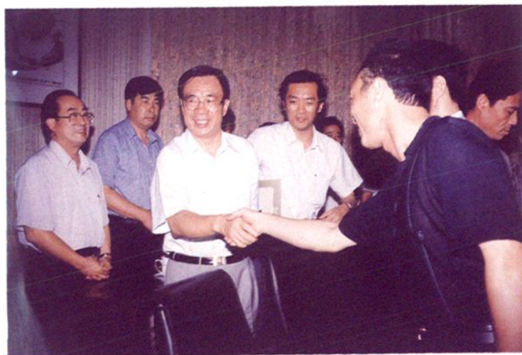
1998年,福建省省长贺国强(左三)来融调研