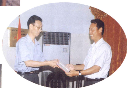
福清市财政局聘请 财政廉政监督员