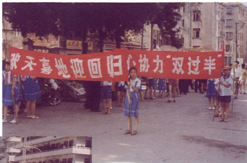
1997年6月，福清市财政局与国税局、地税局联合举行“实现收入过半、喜迎香港回归”大型税法宣传踩街活动