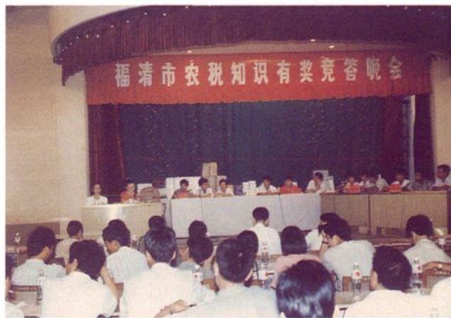
福清市农税知识有奖竞答晚会会场