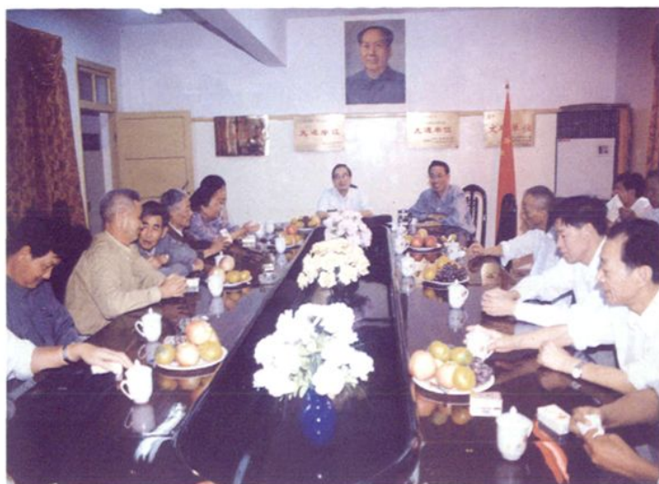
1998年9月，福清市财政局召开离退休老干部座谈会，欢度“九九重阳节”