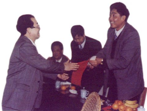
局领导深入基层慰问镇乡财政干部