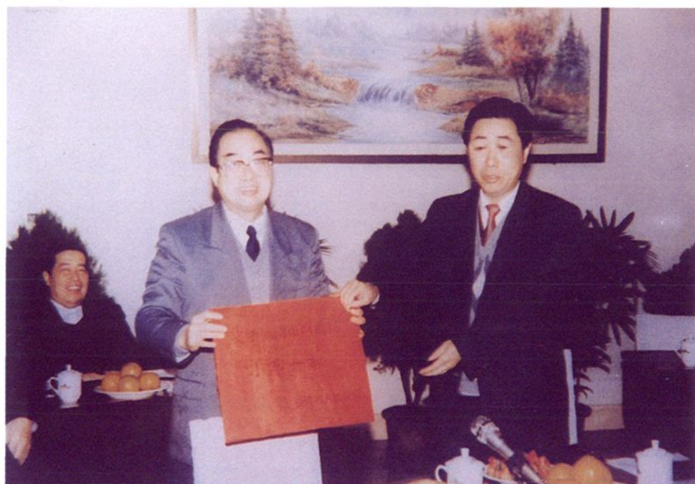
潘心城副省长(右二)代表省政府为福清市财政局授奖