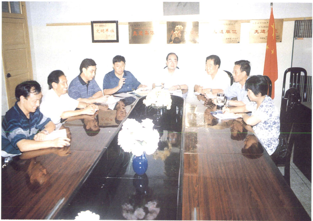
局领导在研究工作