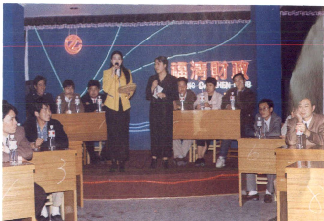
“五一”、“五四”联欢晚会会场