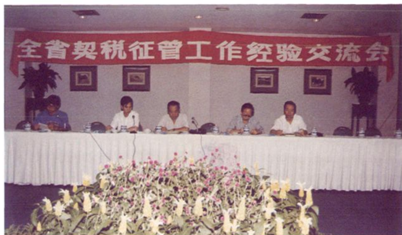
1994年9月,全省契税征管工作经验交流会在融召开