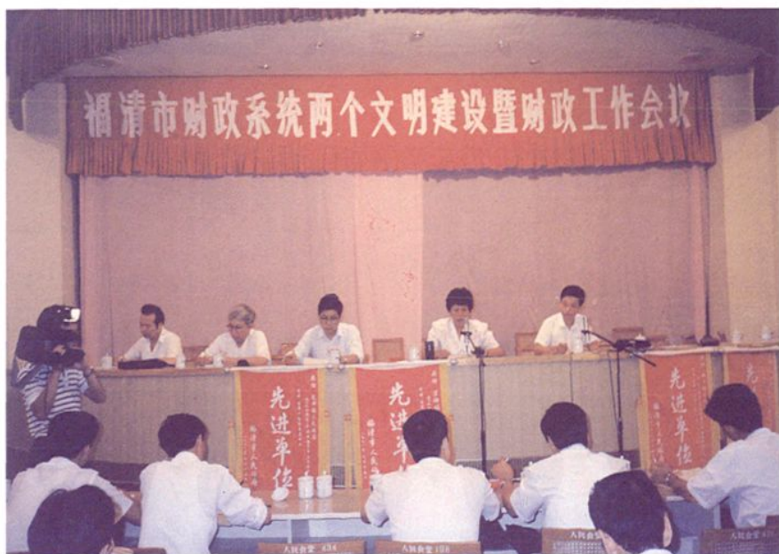
1991年福清市财政系统两个文明建设暨财政工作会议会场