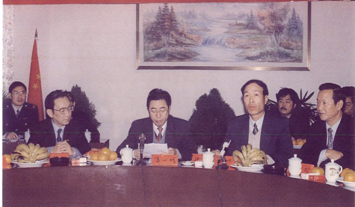
1998年1月2日，省政府在融召开庆祝福清市财政收入超5亿元大会