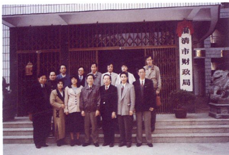
1996年3月21日,国家财政部副部长谢旭人(前排中)莅融视察