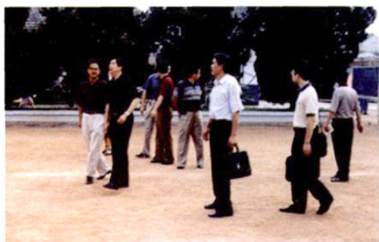
2002年教师节时任区长刘庆龙同志（左二）来校慰问教师。