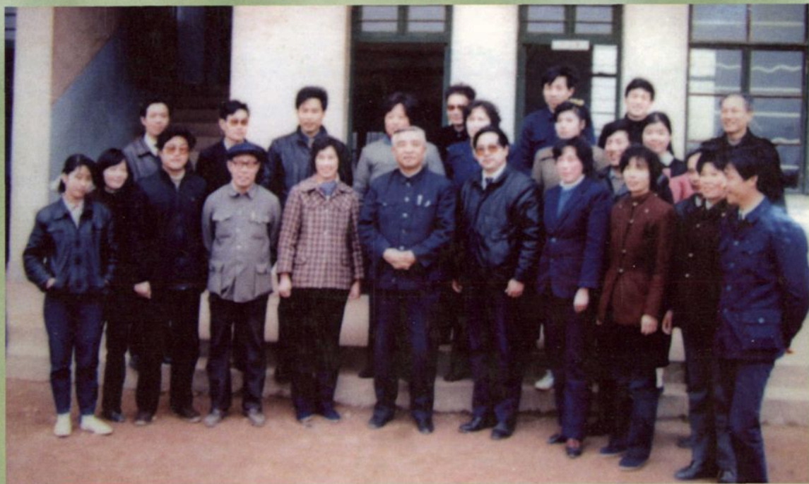
1990年2月20日国家教委党组书记、副主任何东昌（前排左六）同志在副县长劳伟民（前排右五）乡党委书记陆瑞芬（前排左五）教育局局长张湘衡（前排左三）陪同下视察学校，和中心小学老师合影。

YUANGUOJI AJIAOWE I FUZHURENHEDONGCHANGSHI CHA