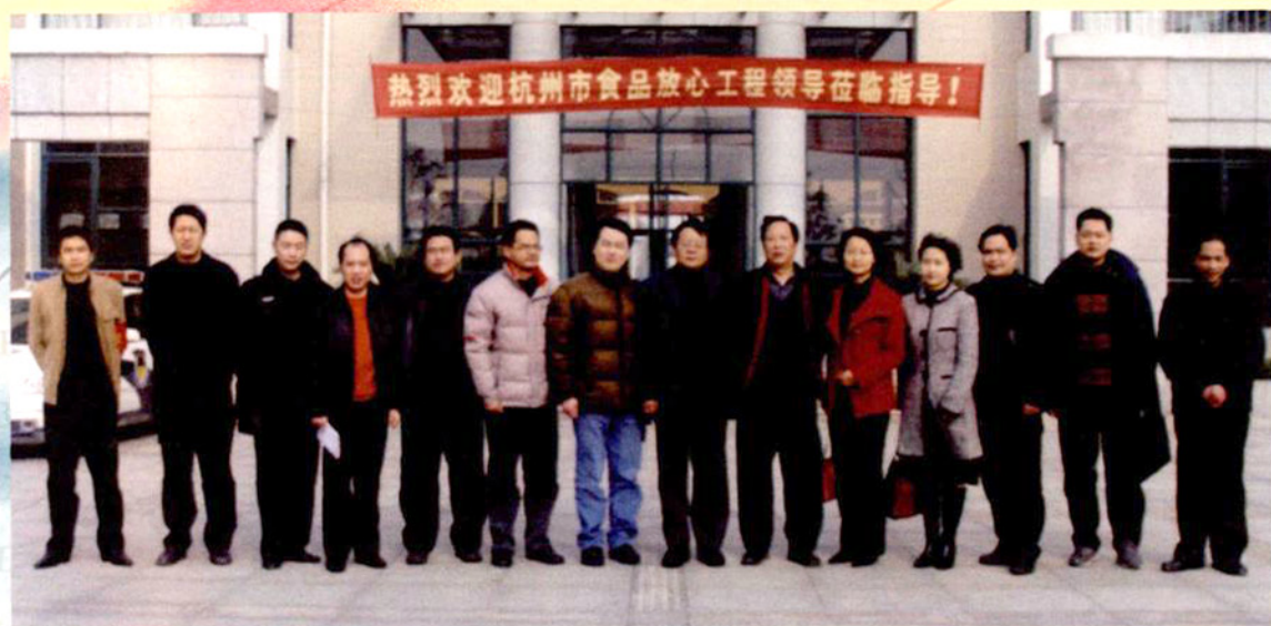
公安部及吉林省公安厅领导考察学校安全教育