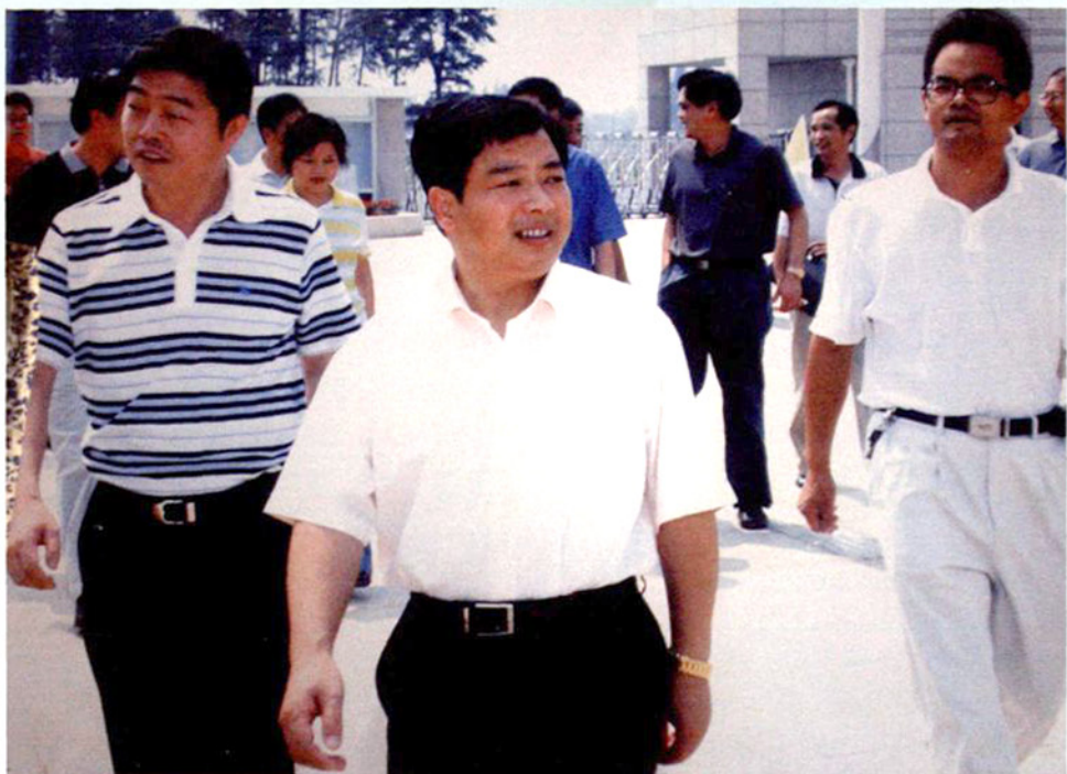
原区委书记何关新（右二）2005年教师节慰问学校教师