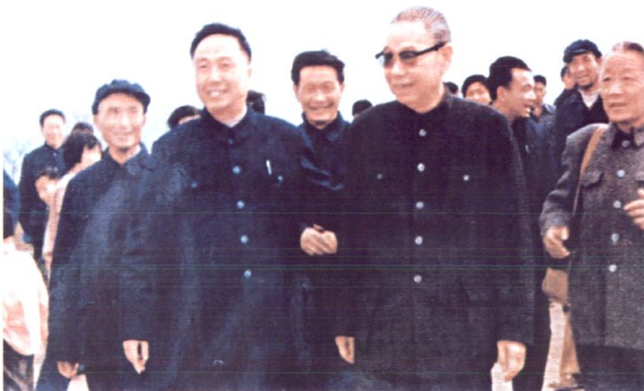
1985年，全国人大常委会副委员长姬鹏飞视察如东县直镇镇。