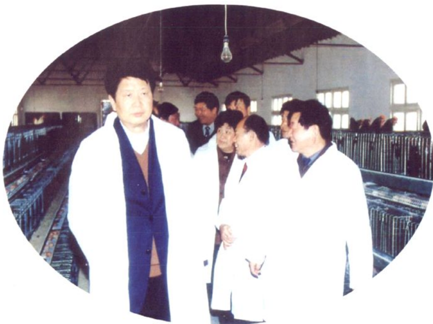
2004年3月26日，全国人大农业和农村委员会主任舒惠国视察如东县农业和农村工作。