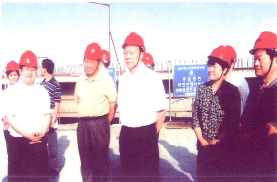
2007年5月22日，江苏省人大常委会副主任王湛一行视察如东县海洋环境保护工作。