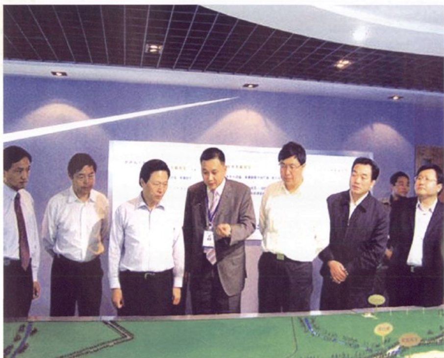
2008年5月1日，中共江苏省委书记、省人大常委会主任梁保华在如东县视察江苏龙源风力发电有限公司。