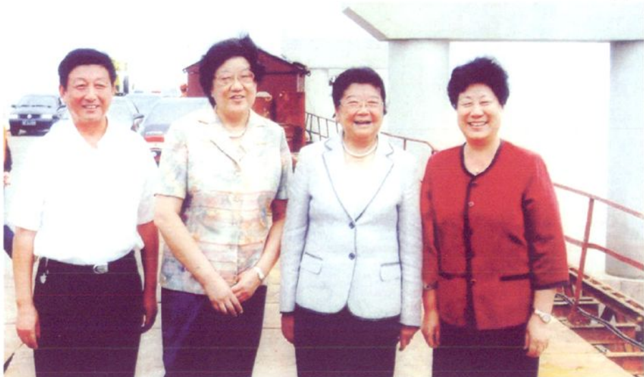
2007年10月2日，全国人大常委会副委员长顾秀莲视察如东县洋口港，与江苏省人大常委会副主任柏苏宁、南通市人大常委会副主任周通生、如东县人大常委会主任张桂英合影留念。