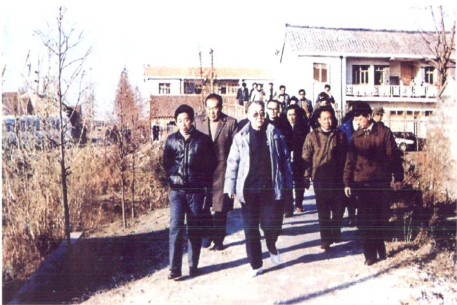
1990年12月3日，全国人大财政经济委员会副主任杨波视察如东县岔南乡。