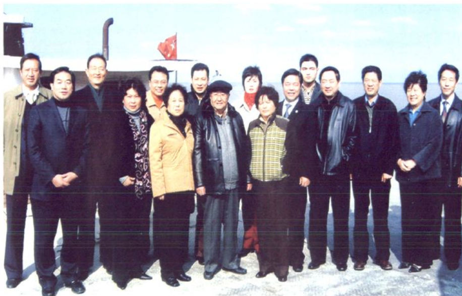
2007年12月5日，江苏省第七届人大常委会主任韩培信视察如东县洋口港。