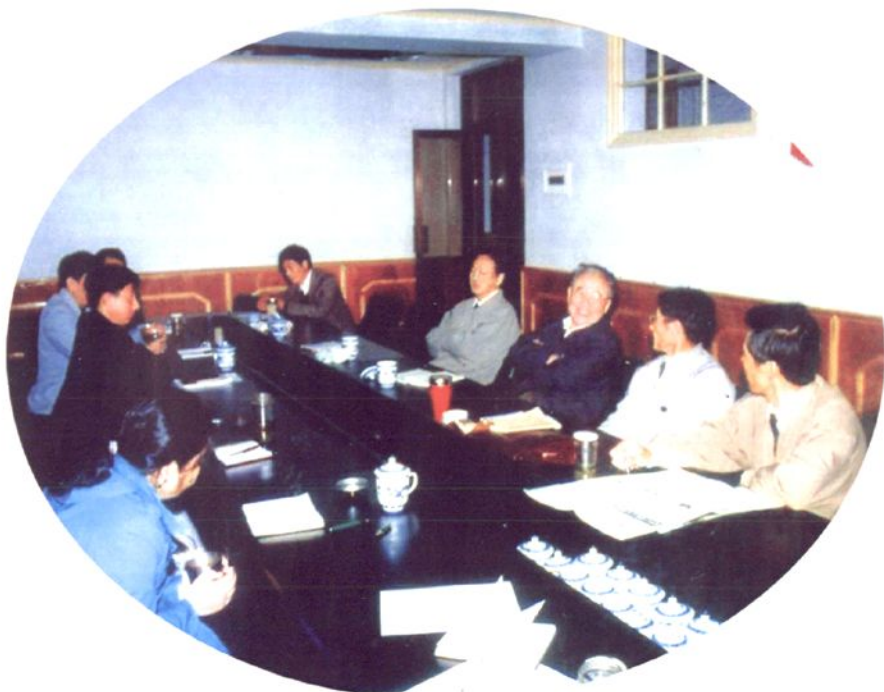
1993年11月，江苏省人大常委会副主任秦杰检查如东县法制建设情况。