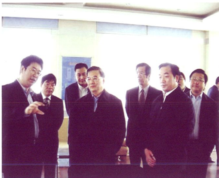
2008年4月，全国政协副主席李金华到如东县视察江苏龙源风力发电有限公司。