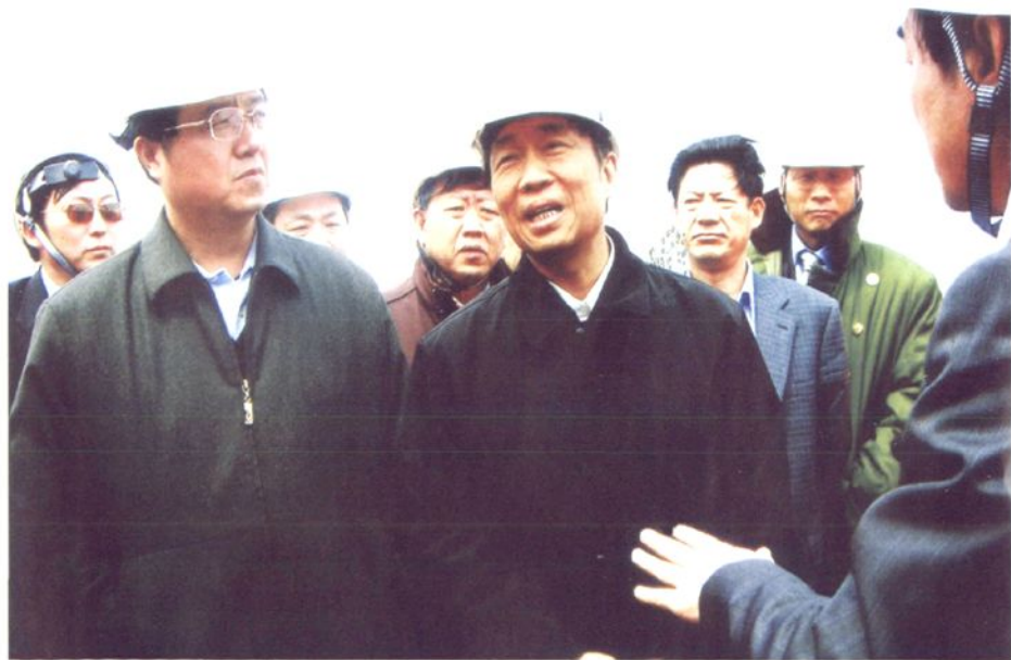
2007年4月16日，江苏省委书记、省人大常委会主任李源潮视察如东县洋口港。