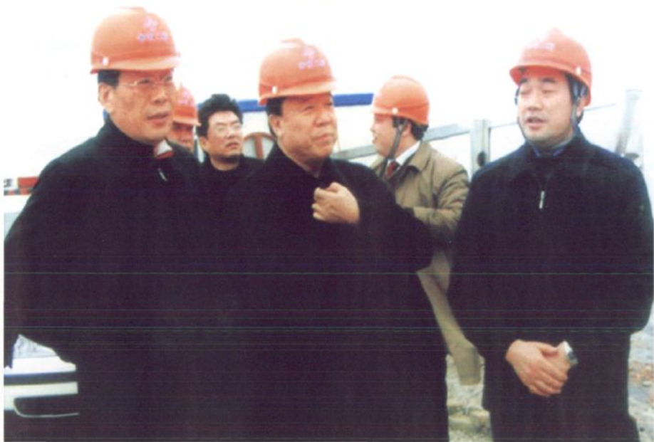
2007年2月24日，中共甘肃省委书记、省人大常委会主任陆浩、省长徐守盛视察如东县洋口港。