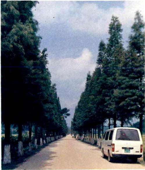
林蔭大道——都城至平台一段公路樹