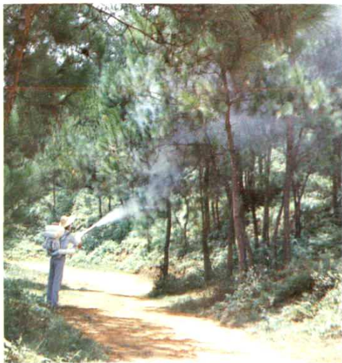
噴施白僵菌 防治松毛蟲