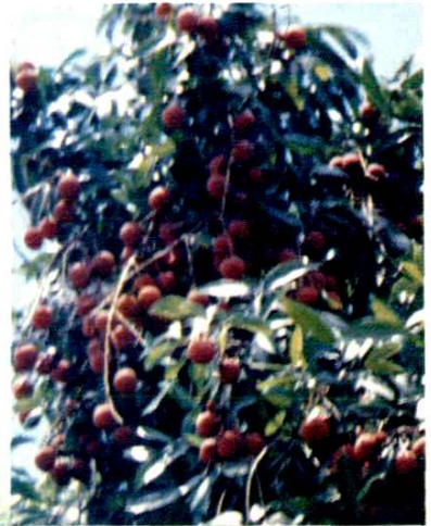
本縣名優水果——龐寨荔枝