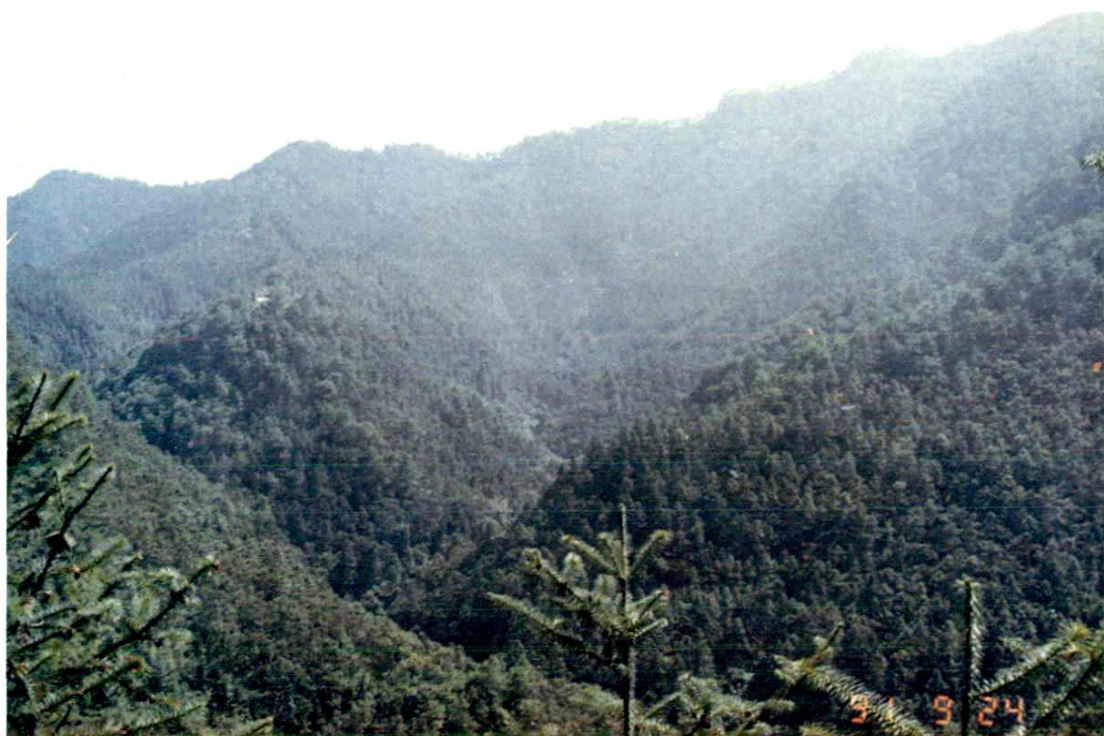
縣內南部片林地一角（東壩鎮火車林場）