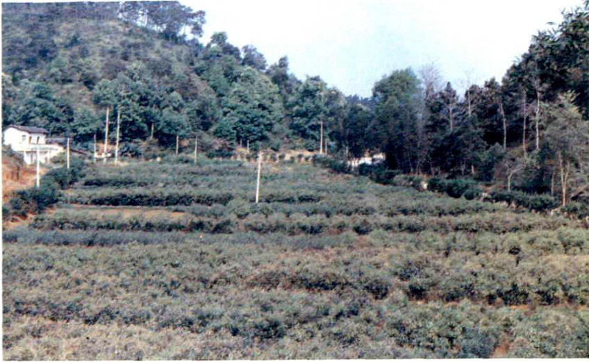
縣苗圃場大量 培育苗木，配合造 林綠化。