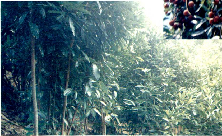
本縣主要 經濟林種—— 肉桂林一角。