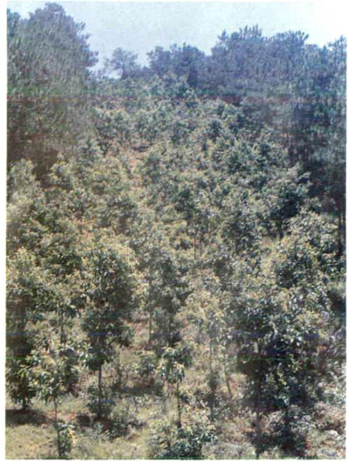
營造以紅荷爲主的綠色防火林帶