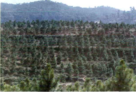
栽植濕地松 營造工程林