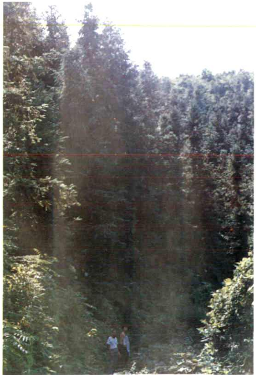
縣林科所杉樹種子園一角