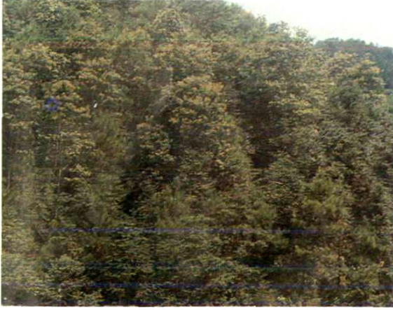
針闊葉混交林遠眺