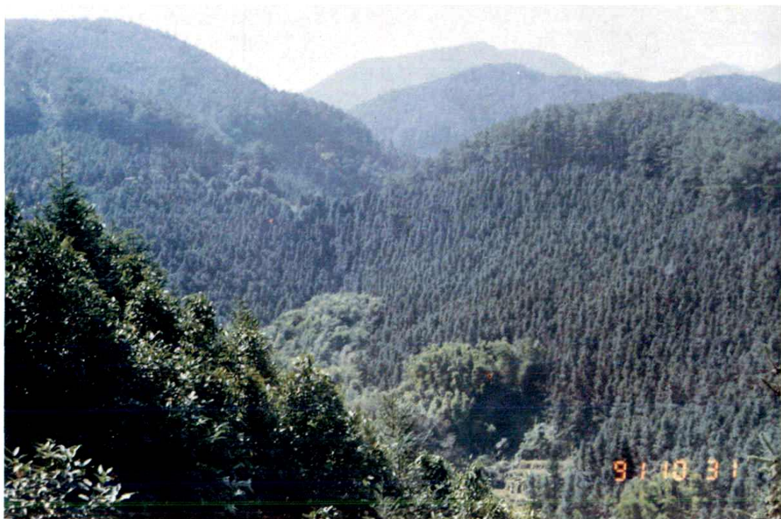
縣內北部片林地一角