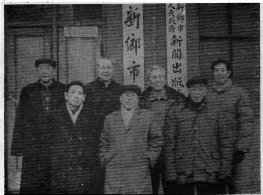
编辑部全体成员合影