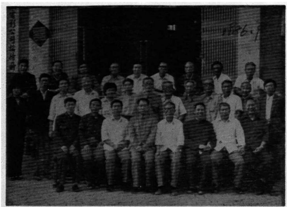
1986年9月23日新乡市召开市属8县戏曲志编辑 人员会议合影