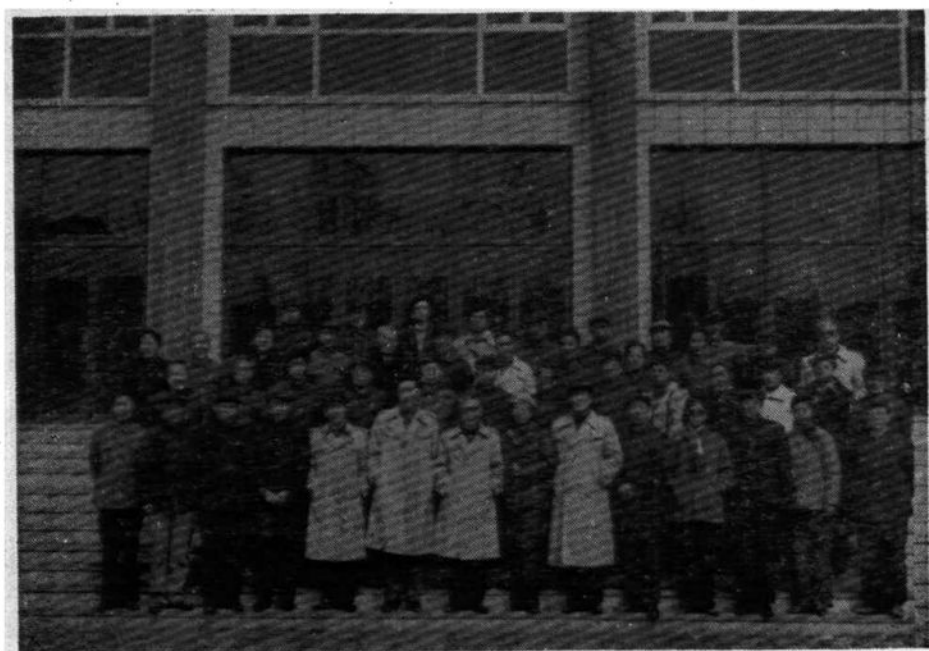
1987年9月25日新乡市召开全市戏曲志编辑人员 第二次会议合影