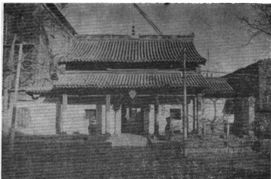
元代至正年间修建的新乡关帝庙戏楼