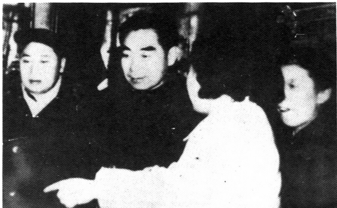
1959年，国务院总理周恩来视察哈尔滨三八饭店，与工作人员亲切交谈。