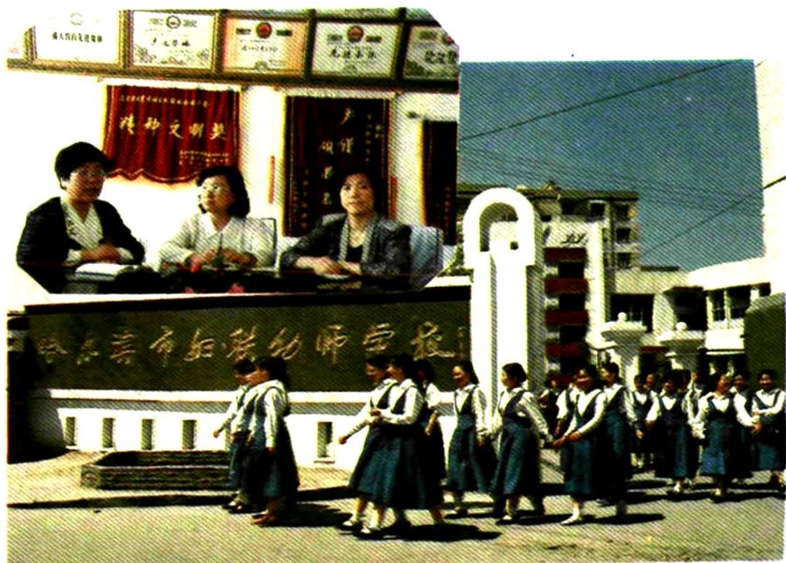
哈尔滨市妇联职工幼儿师范学校