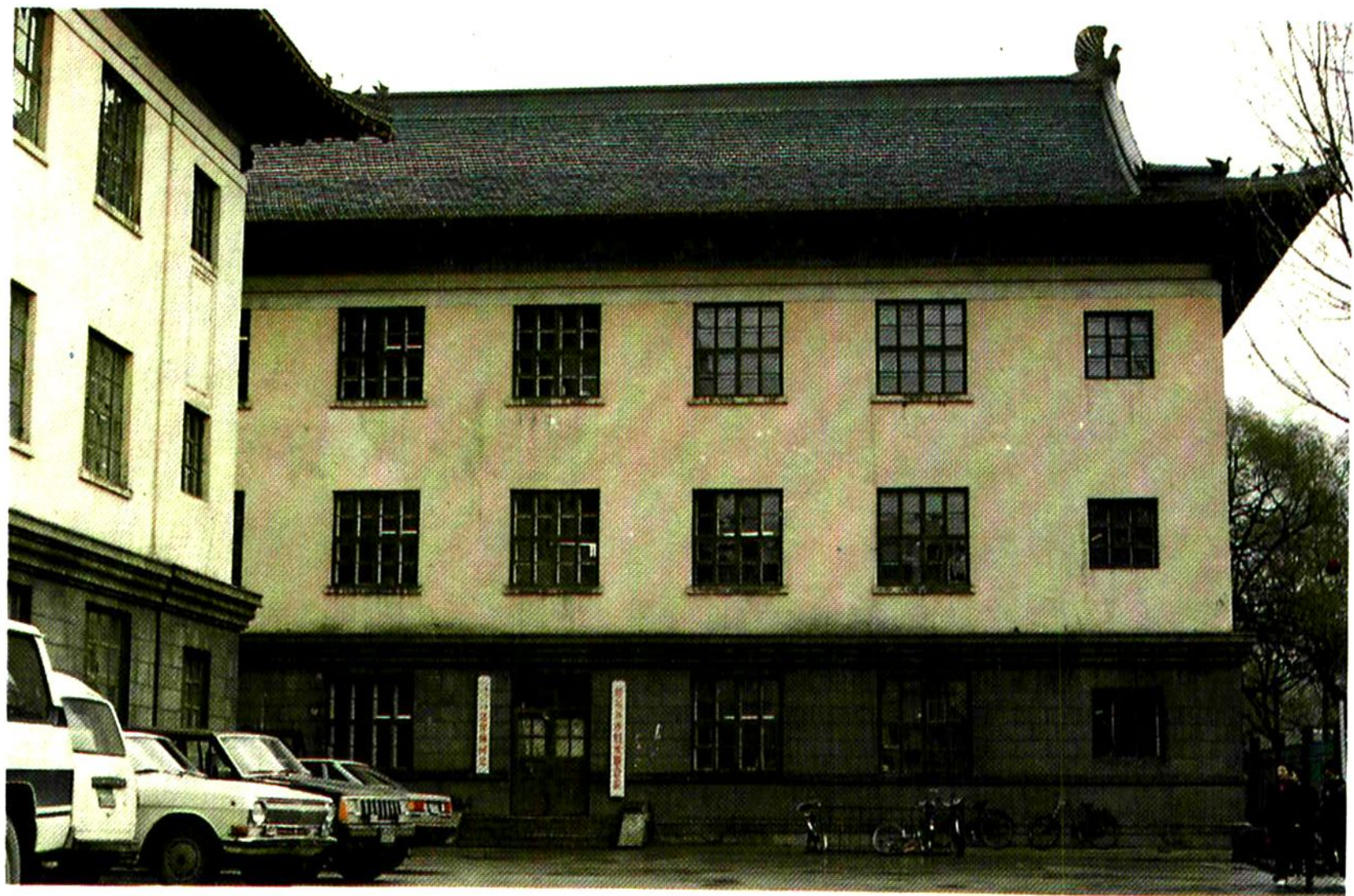
哈尔滨市妇女联合会会址