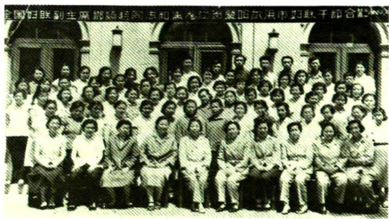
1962年，全国 妇联副主席邓颖超 (前排左五)来哈 尔滨视察，与省市 妇联干部合影。