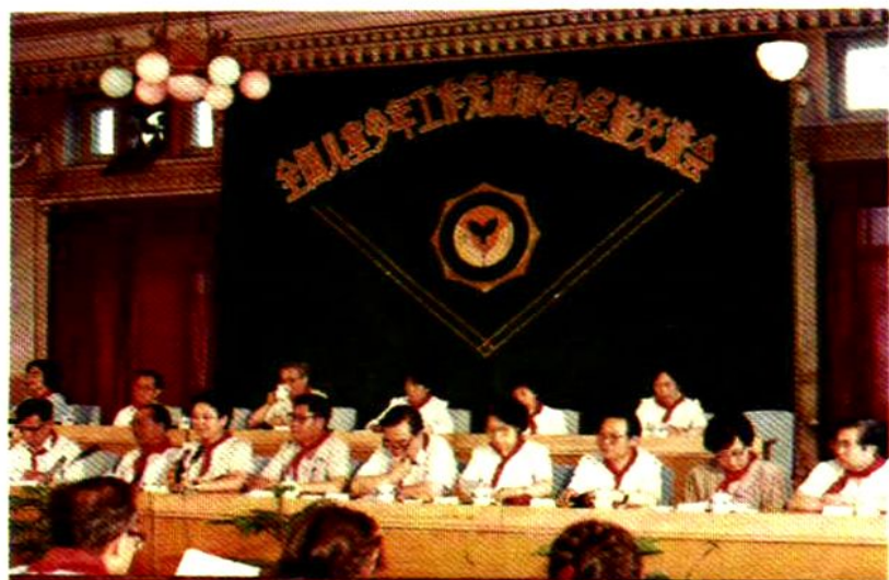
1989年7月， 全国儿童少年工作 先进市(县)经验交 流会在哈尔滨召 开。