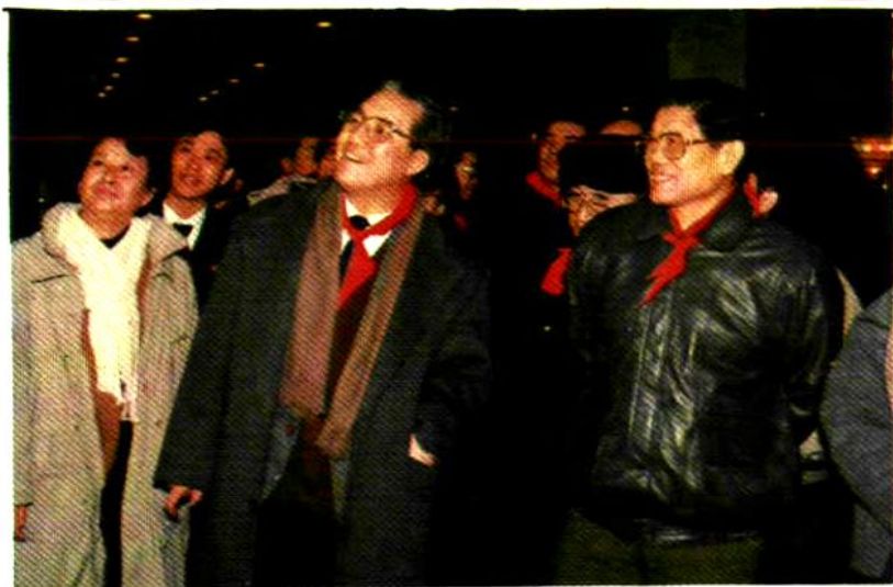
1990年冬，国 家教委主任李铁映 (右一)参观哈尔滨 市儿童少年活动 中心。