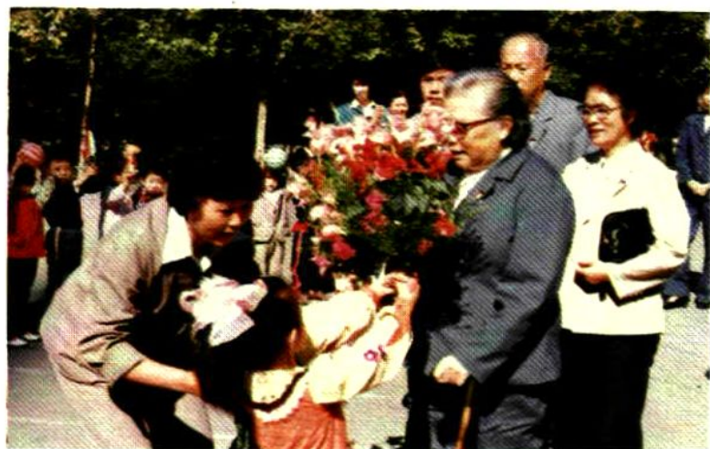
1986年，全国 妇联主席康克清视 察哈尔滨市政府第 一幼儿园。