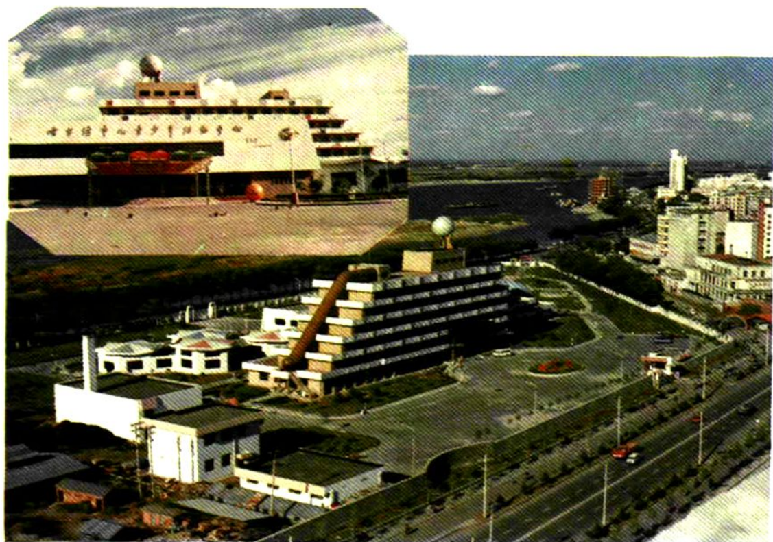
哈尔滨市儿童少年活动中心