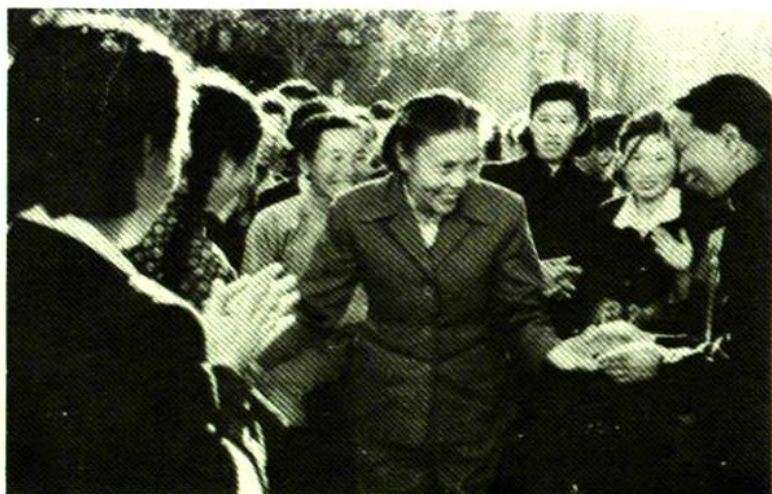
1958年，全国 妇联主席蔡畅来哈 尔滨视察妇女工 作，和妇女群众在 一起。