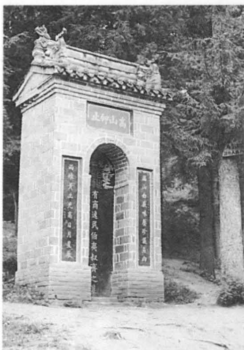
首阳山伯夷叔齐墓碑