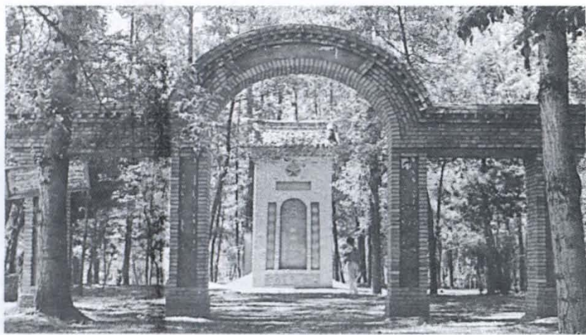
莲峰坡儿红军烈士纪念碑