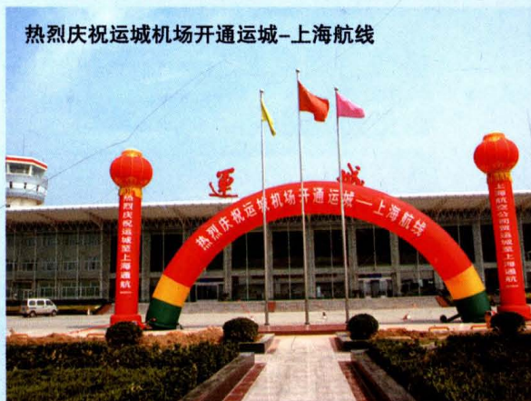
热烈庆祝运城机场开通运城-上海航线