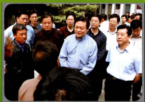
省长于幼军、副省长梁滨调研我市水务工作