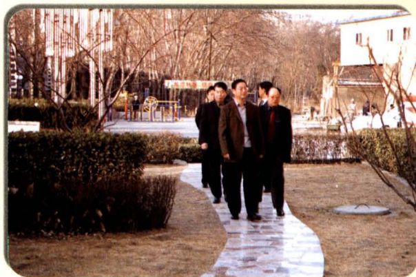
屈文玉主任陪同高卫东市长、张建合常务副市长视察黄河花园