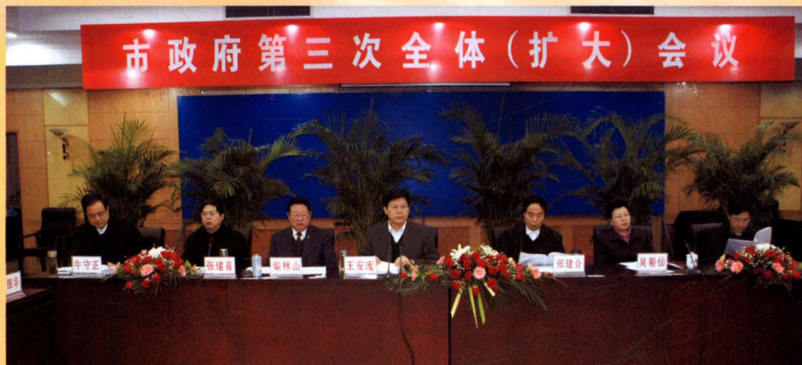
运城市人民政府第三次全体(扩大)会议