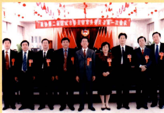
运城市政协二届委员会领导班子成员