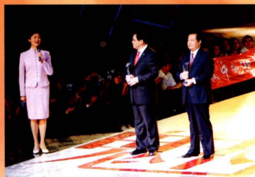
中央电视台主持人敬一丹宣读“魅力运城”