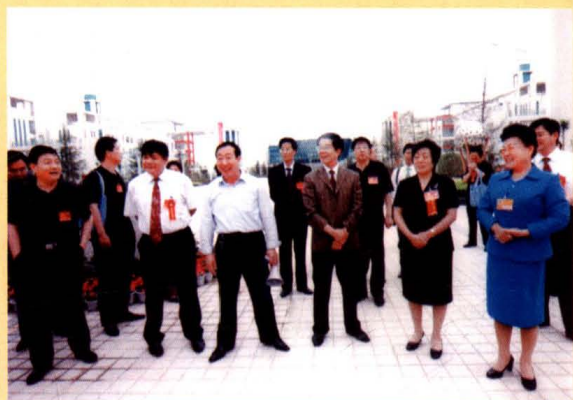
运城市政协常委视察康杰中学新校