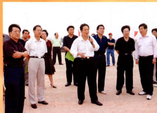
市人大常委会组成人员深入建设工地调研