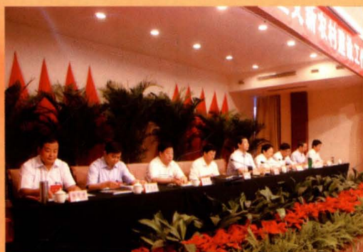
全省新农村建设工作运城现场会