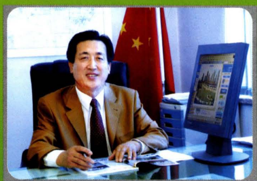
市水务局党组书记、局长冯进喜