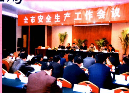
全市安全生产工作会议