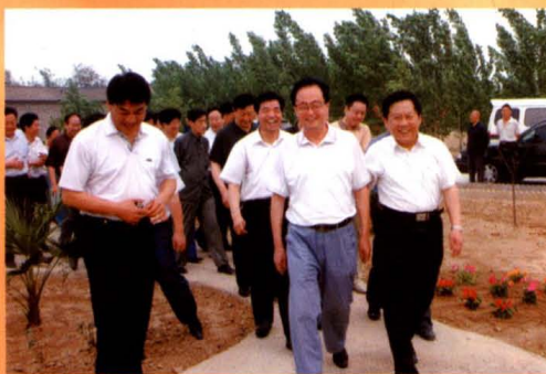
市委副书记尚平安到农村检查指导工作