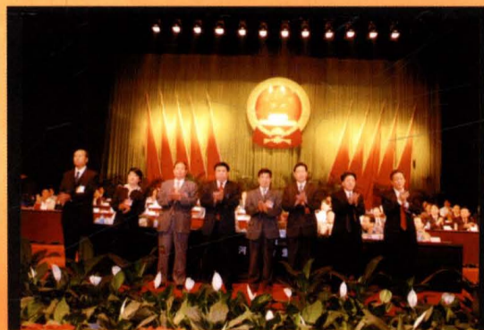
运城市第二届人民代表大会主任副主任秘书长