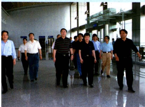
中国民航总局杨元元 局长到运城机场视察工作