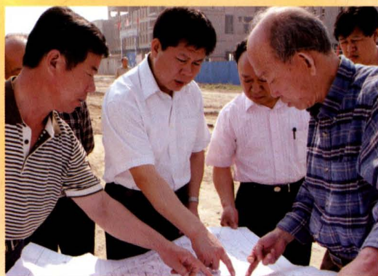
市长王安庞在运城职业技术学院调研