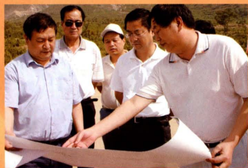
市委书记高卫东视察南环高速路