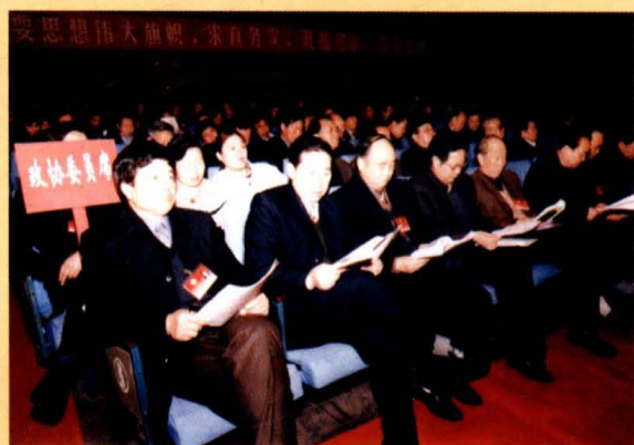
运城市政协委员们认真听取《政府工作报告》