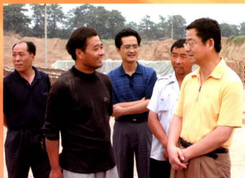
市委书记高卫东检查砖窑