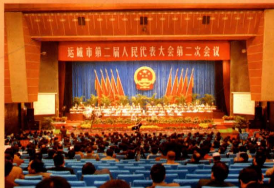
市二届人民代表大会第二次会议