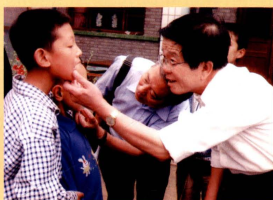
运城市政协主席安永全深入农村调研饮水工程