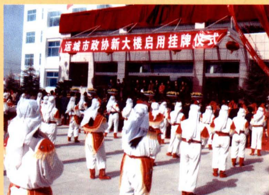
运城市政协大楼启用挂牌仪式