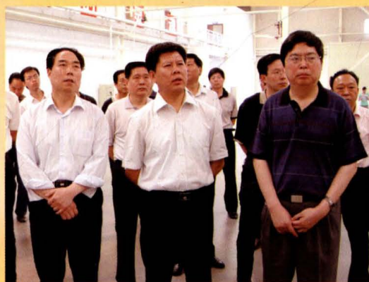
市长王安庞、常务副市长张建合、副市长张建喜视察空港开发区