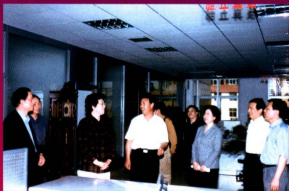
中纪委研究室主任朱旭东一行莅临 我局指导改革工作