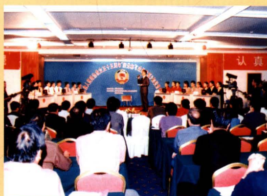
运城市政协举办《政协章程》知识竞赛