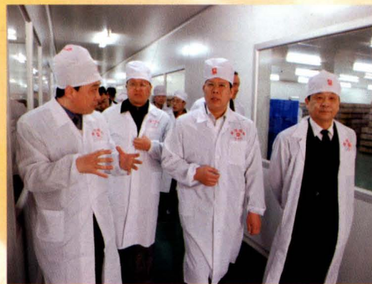
市长王安庞在芮城亚宝药业集团调研