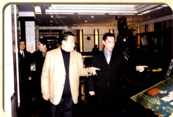
屈文玉主任陪同张茂才书记、张建合常务副市长在北京黄河京都大酒店视察