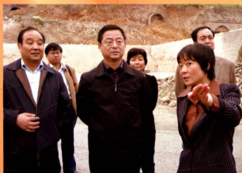
市委书记高卫东在平陆调研环保