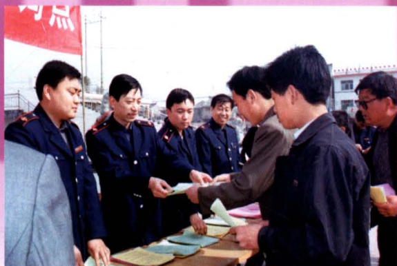
深入开展税法宣传