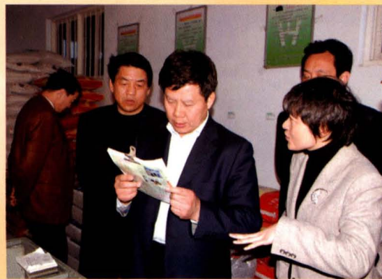
市长王安庞深入平陆企业调研