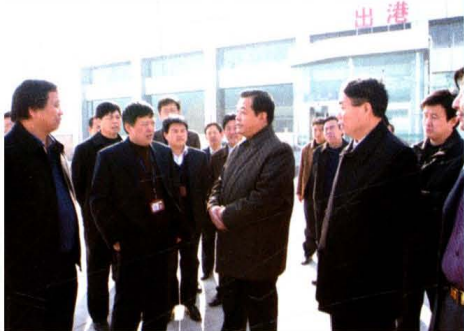
市委书记张茂才到机场视察