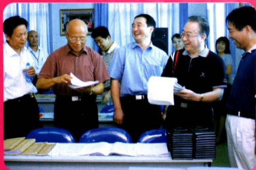
维庆深入市人口计生委调研 国家人口计生委主任张