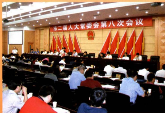
市二届人大常委会第八次常委会