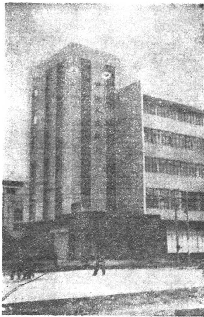
中国人民银行温岭县支行