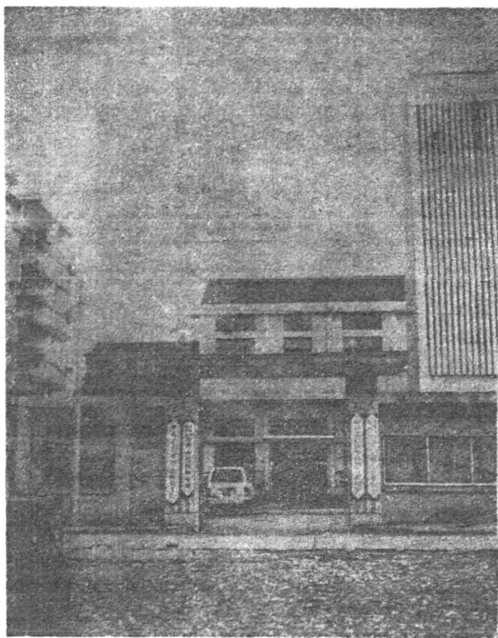
中国农业银行温岭县支行