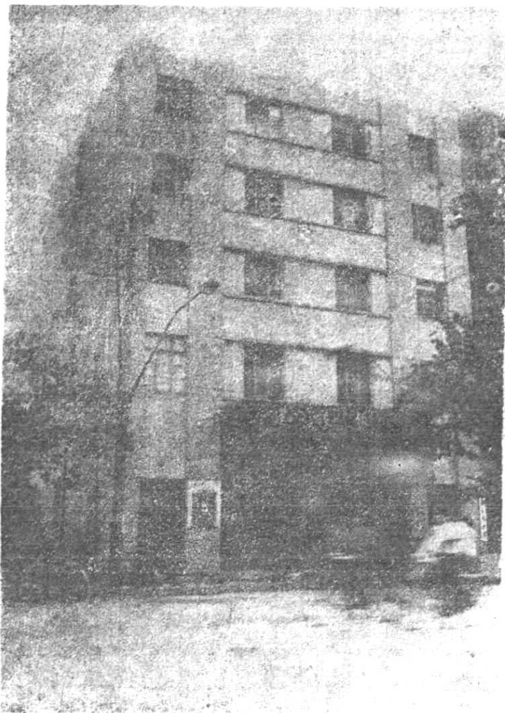
中国人民建设银行温岭县支行