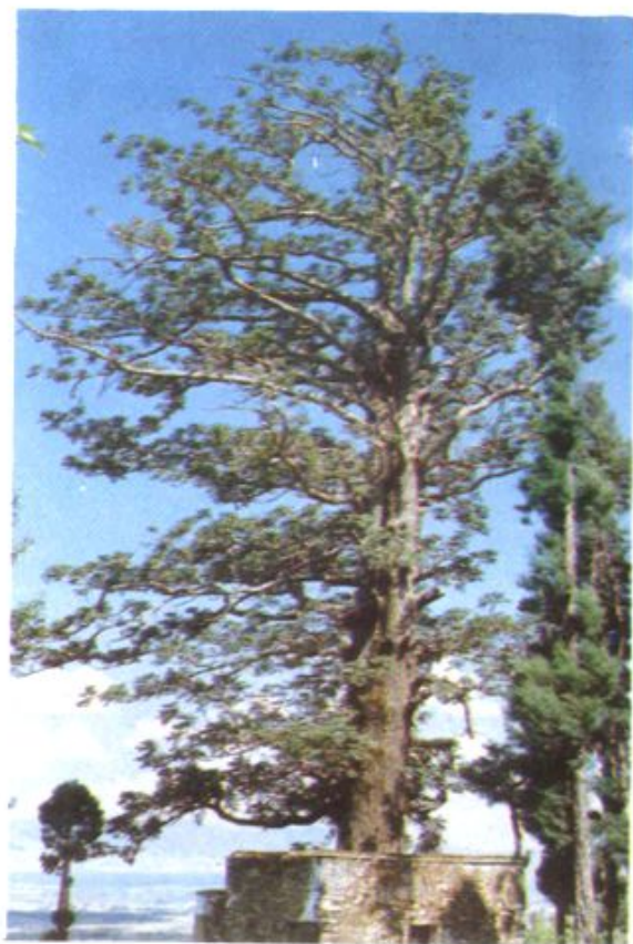
▲ 无为寺960年生的软叶杉