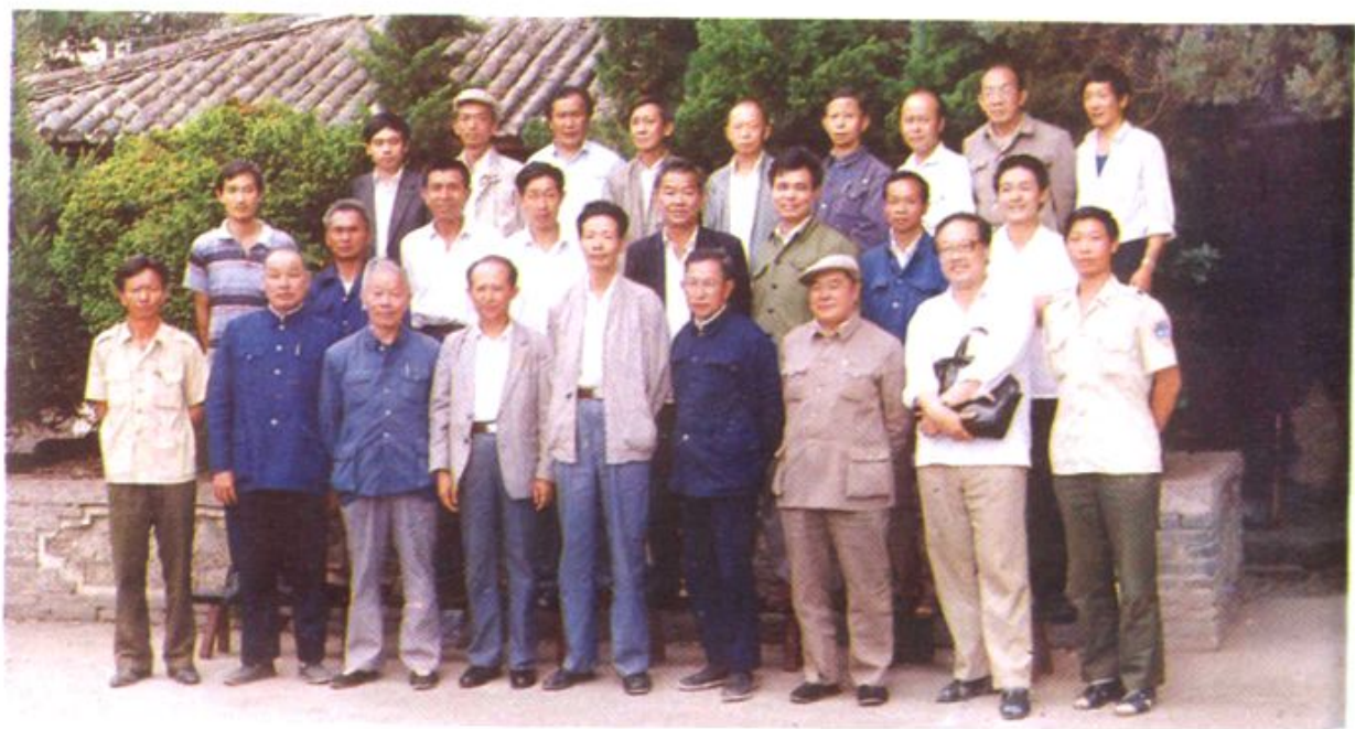
大理市林业志评审会合影