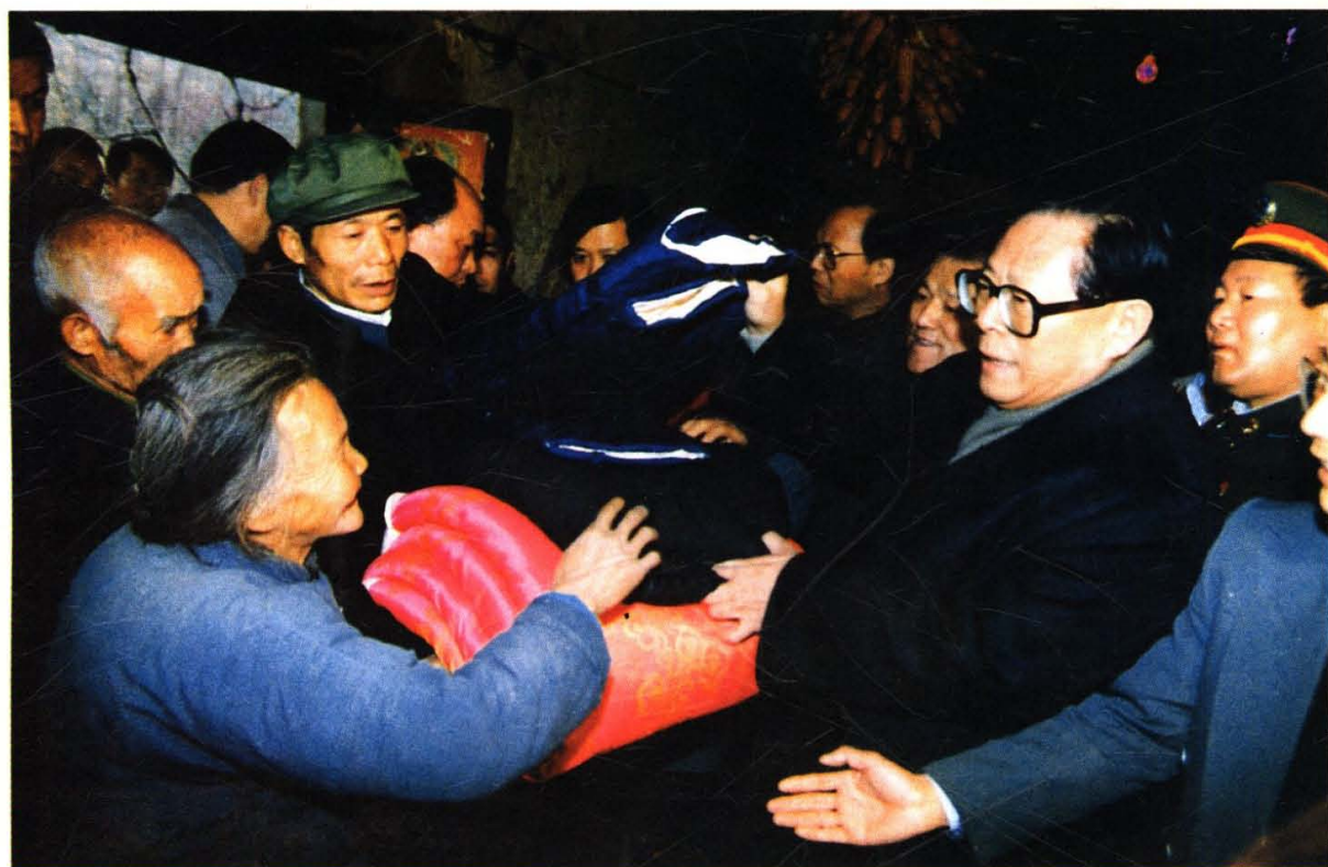
1995年12月22日,江泽民总书记在商洛慰问群众时,在丹凤县白衣寺村向贫困户赠送棉衣棉被。