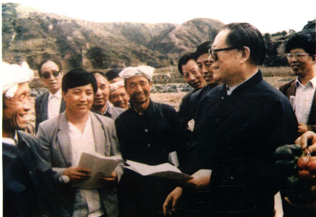
1989年9月9日,江泽民总书记在延安视察时,和延安市(今宝塔区)领导、万花乡农民亲切交谈。