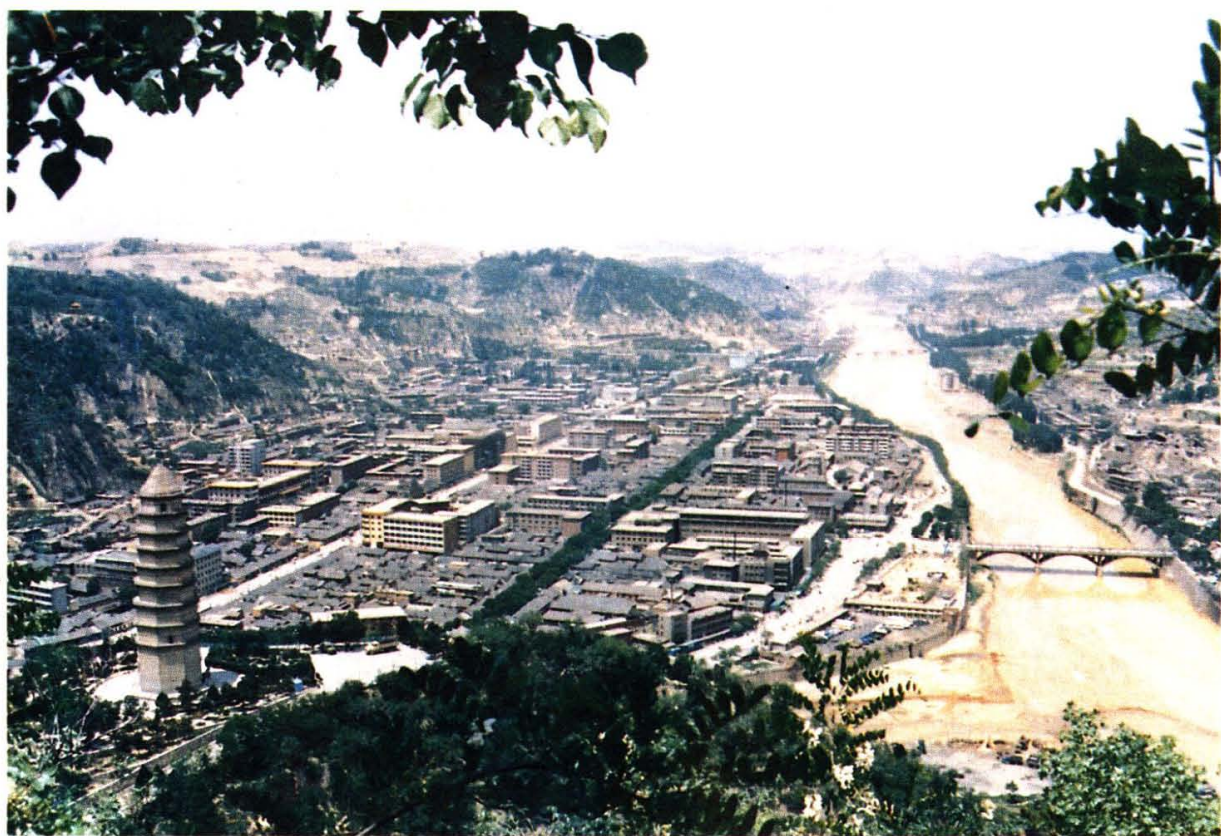
欣欣向荣的延安城市新貌