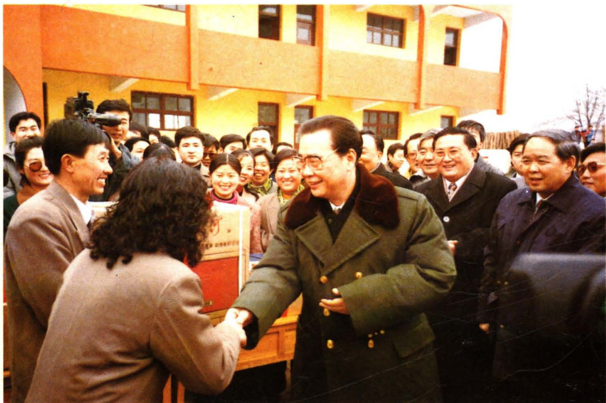
1996年春节,李鹏总理在延安期间,视察杨家岭希望小学,并赠送学校一台彩电。