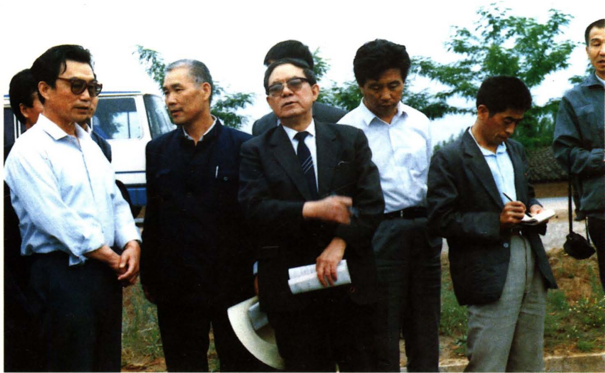
1991年,国务委员、国家科委主任宋健在陕北老区考察科技扶贫工作。左三为宋健同志。