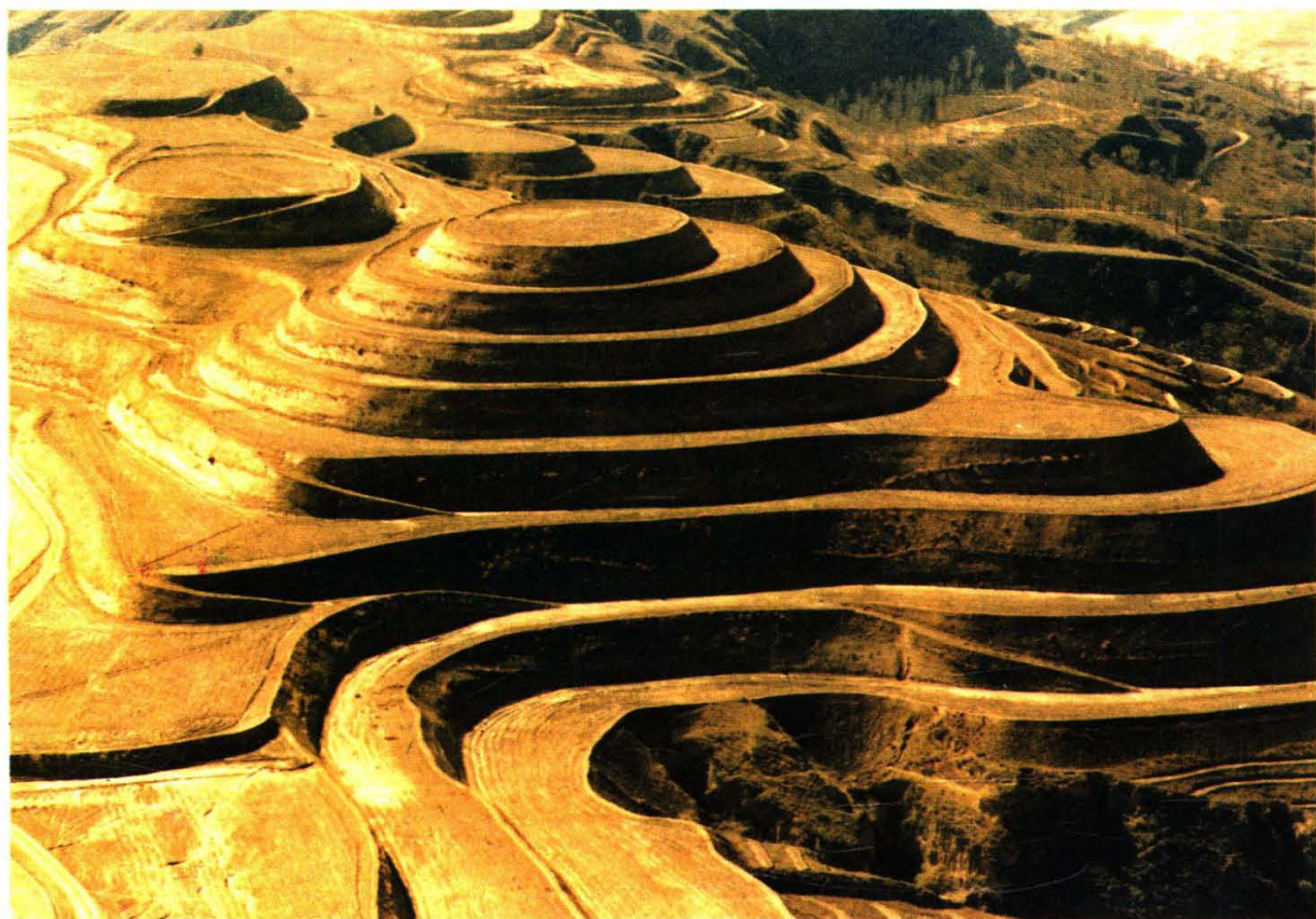
延安市宝塔区世行贷款项目延河流域治理芦草沟治理区的高标准梯田