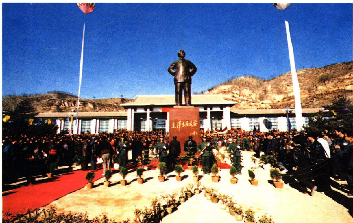
延安人民在延安革命纪念馆前举行毛泽东铜像揭幕仪式