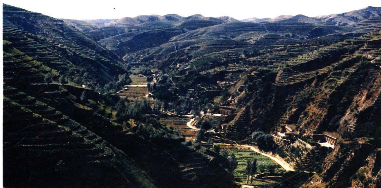
米脂县对岔小流域综合治理