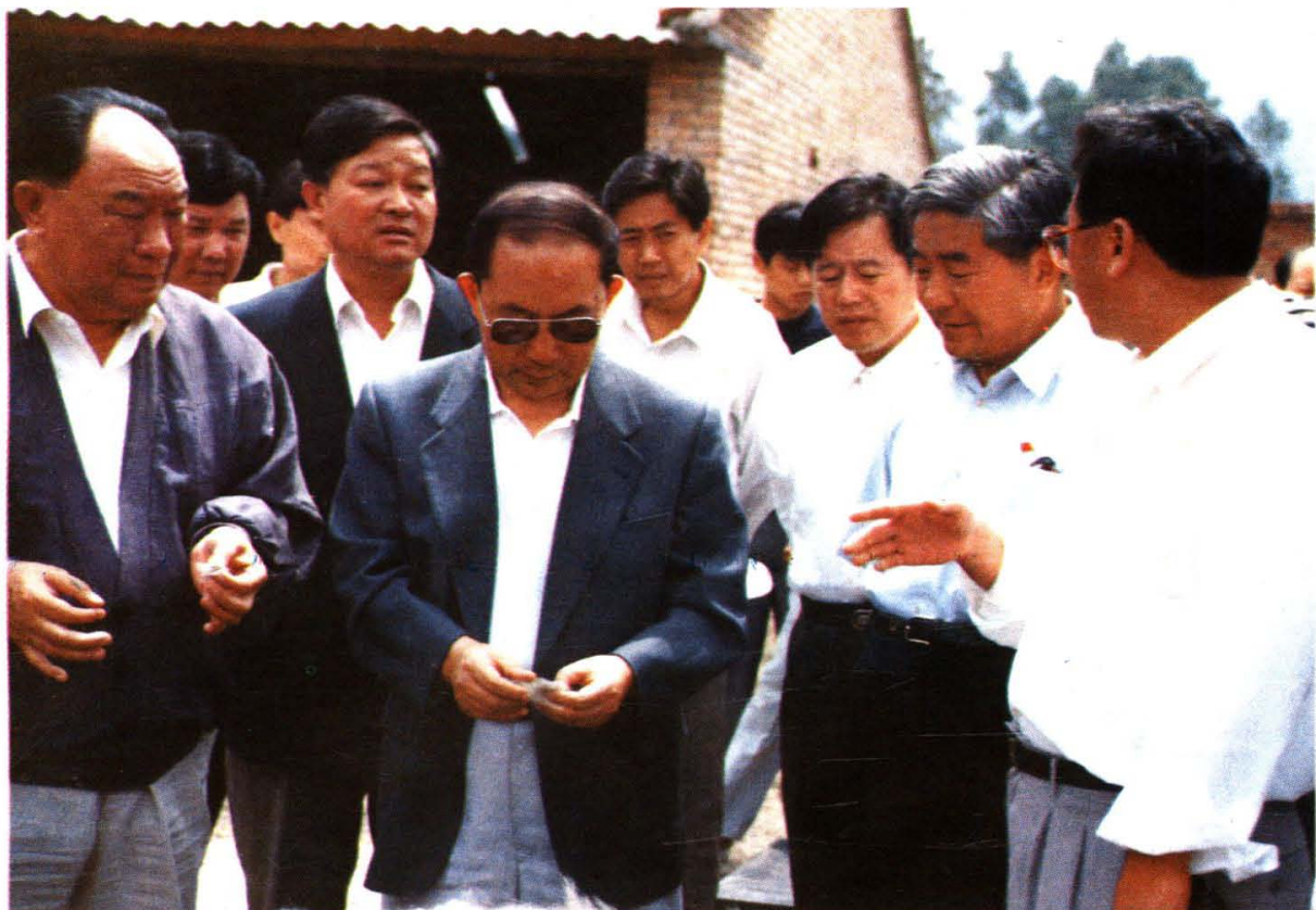
1997年6月24日,国务委员、国务院扶贫领导小组组长陈俊生在蓝田考察扶贫工作。前排左二为陈俊生同志。