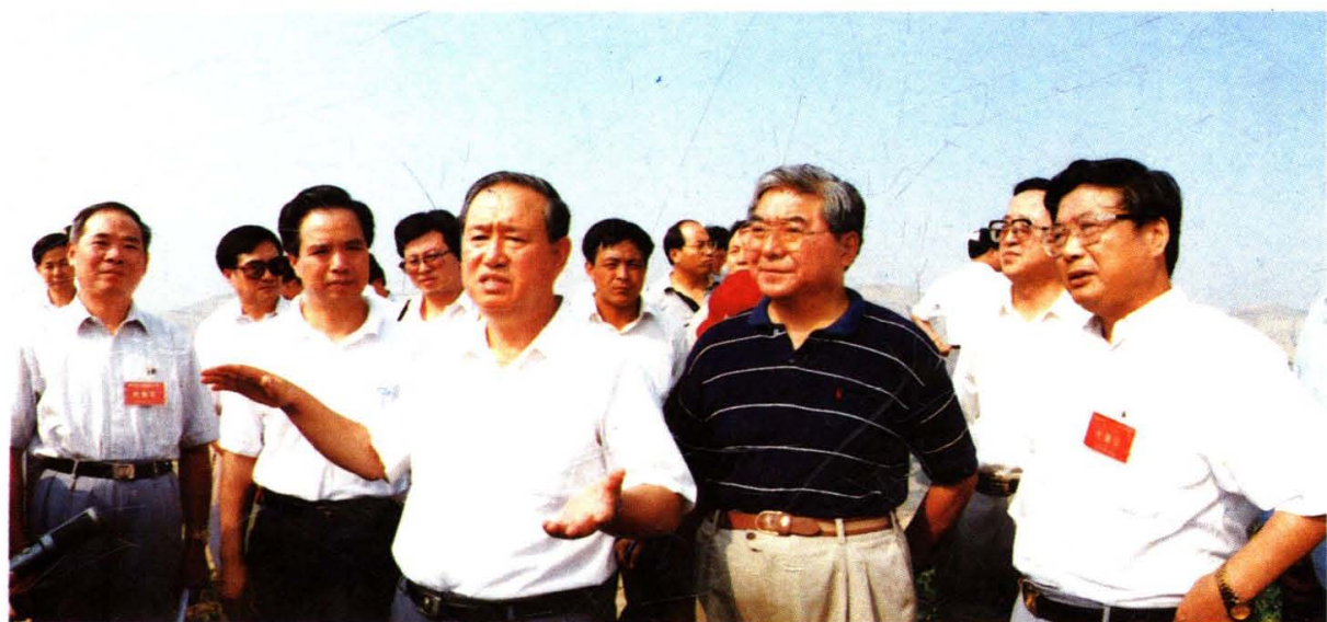
1997年8月,姜春云副总理在陕北参加全国治理水土流失、建设生态农业现场经验交流会期间,在米脂县视察。前排右三为姜春云同志。