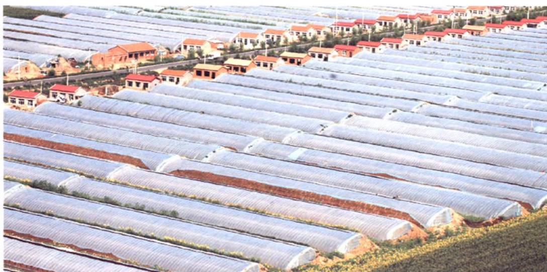
初头朗设施农业项目区