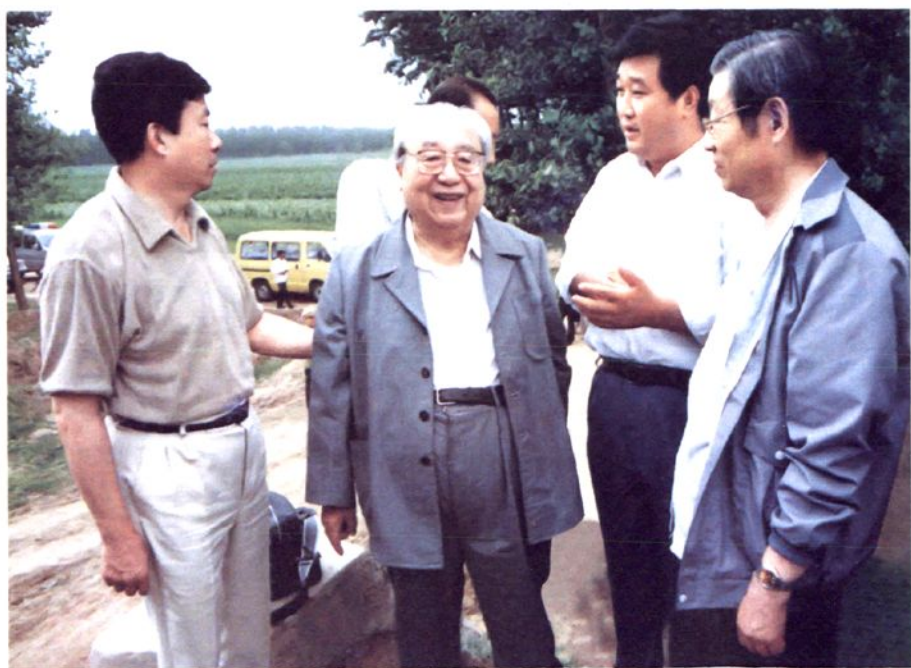
1995年7月18日，全国人大常委会副委员长费孝通在太平地乡调研