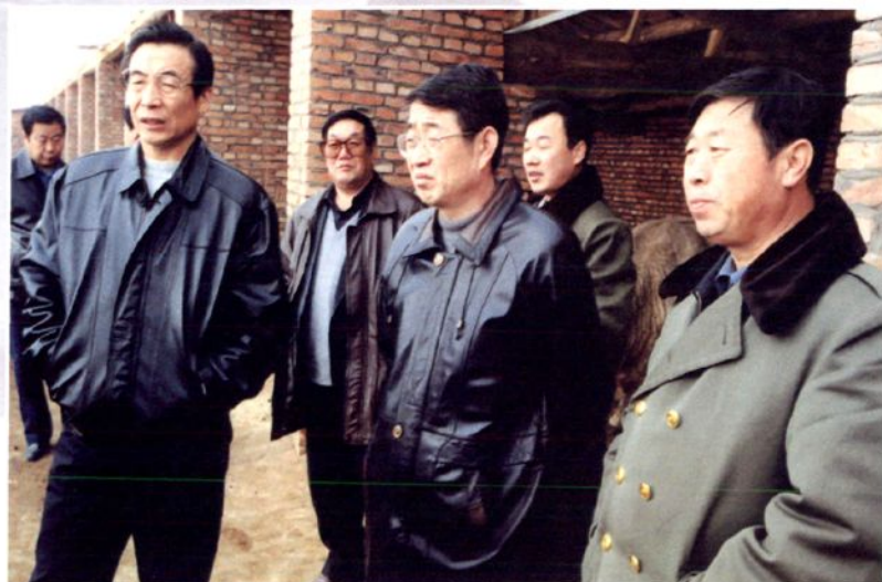
2000年11月29~30日，中共赤峰市委书记刘玉祥在松山区考察调研