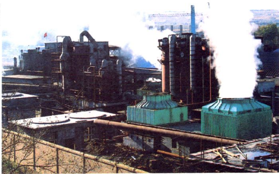
赤峰金剑铜业有限公司