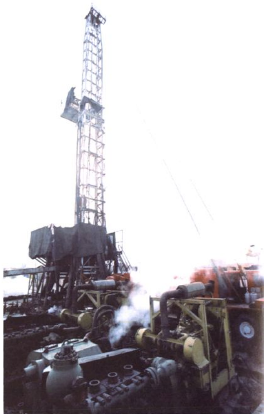
勘探中的赤峰太平地油气田