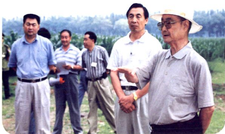
1999年7月6日，中共中央政治局原常委、书记处书记宋平在太平地乡调研考察