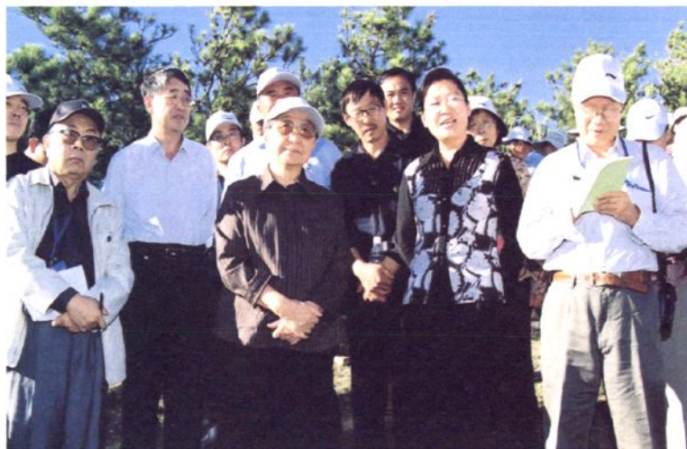
2004年8月31日， 全国政协原副主席、中 国工程院院士钱正英在 松山区调研