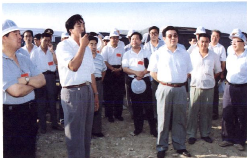
1997年8月13~14日，内蒙古自治区党委书记刘明祖视察松山区生态建设