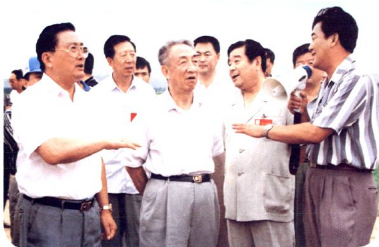
1997年7月25日，中共中央政治局委员、国务院副总理、中央代表团团长邹家华，国务委员兼国务院秘书长、中央代表团副团长罗干率中央代表团视察太平地乡农田防护林建设