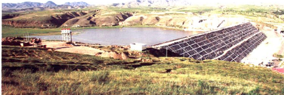
三座店水利枢纽工程