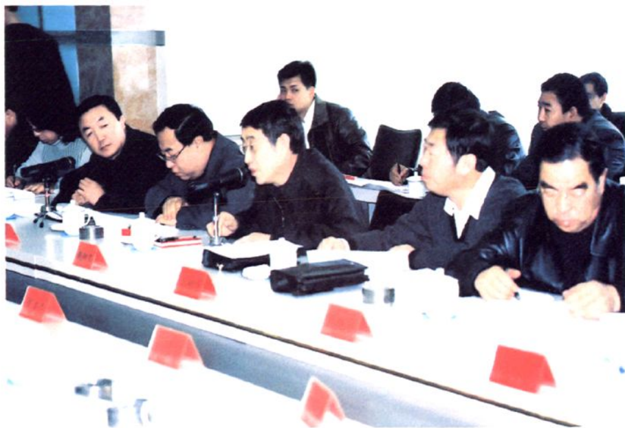
松山区党政领导共商发展大计