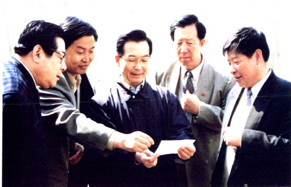
1997年4月23日，中共中央政治局候补委员、书记处书记温家宝在松山区视察