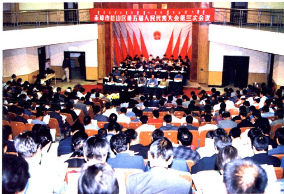
赤峰市松山区第五届人民代表大会第三次会议会场