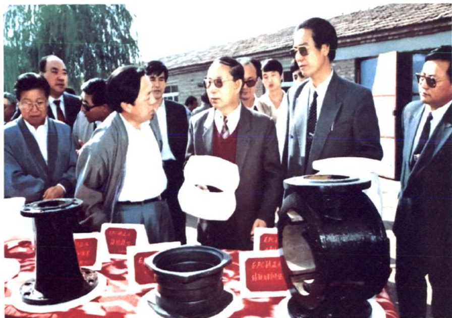
1993年9月25日，国务委员陈俊生在穆家营子镇考察