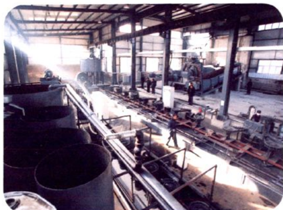
赤峰金昊矿业有限责任公司生产车间