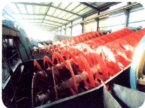
赤峰市碾子沟矿业有限责任公司生产车间