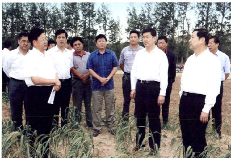
2009年8月27日，内蒙古自治区党委书记储波、自治区主席巴特尔到松山区上官地镇视察灾情