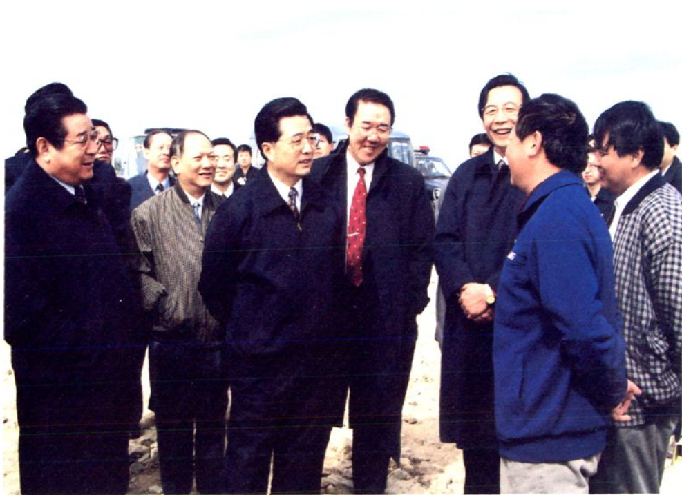
2000年4月14日，中共中央政治局常委、国家副主席胡锦涛视察松山区山区综合开发龙潭示范工程