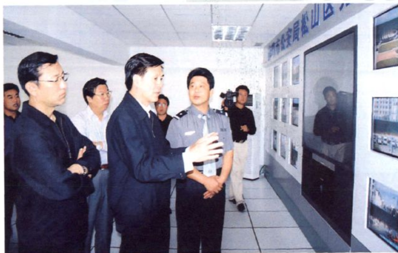
2004年9月5日，内蒙古自治区主席杨晶视察松山区公安分局“打防控”一体化建设