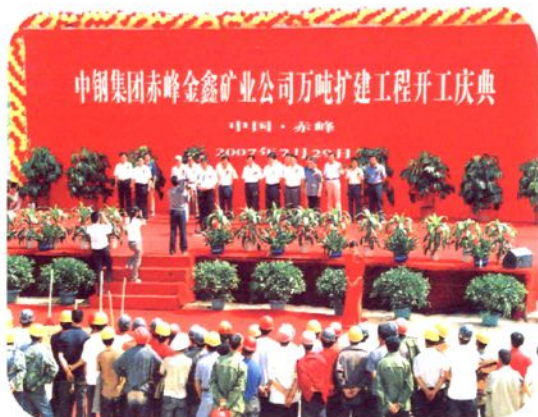
中钢集团赤峰金鑫矿业有限公司扩建庆典