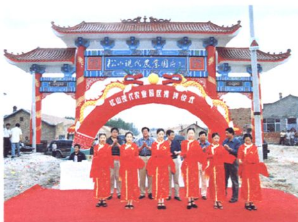
当铺地现代农业园区