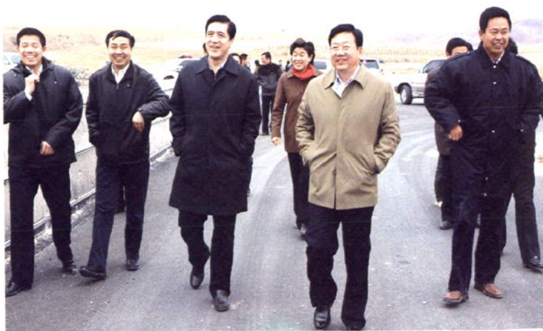
2009年10月30日，赤峰市人民政府市长王中和考察松山区三座店水利枢纽工程