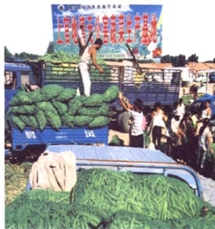
上官地无公害蔬菜基地