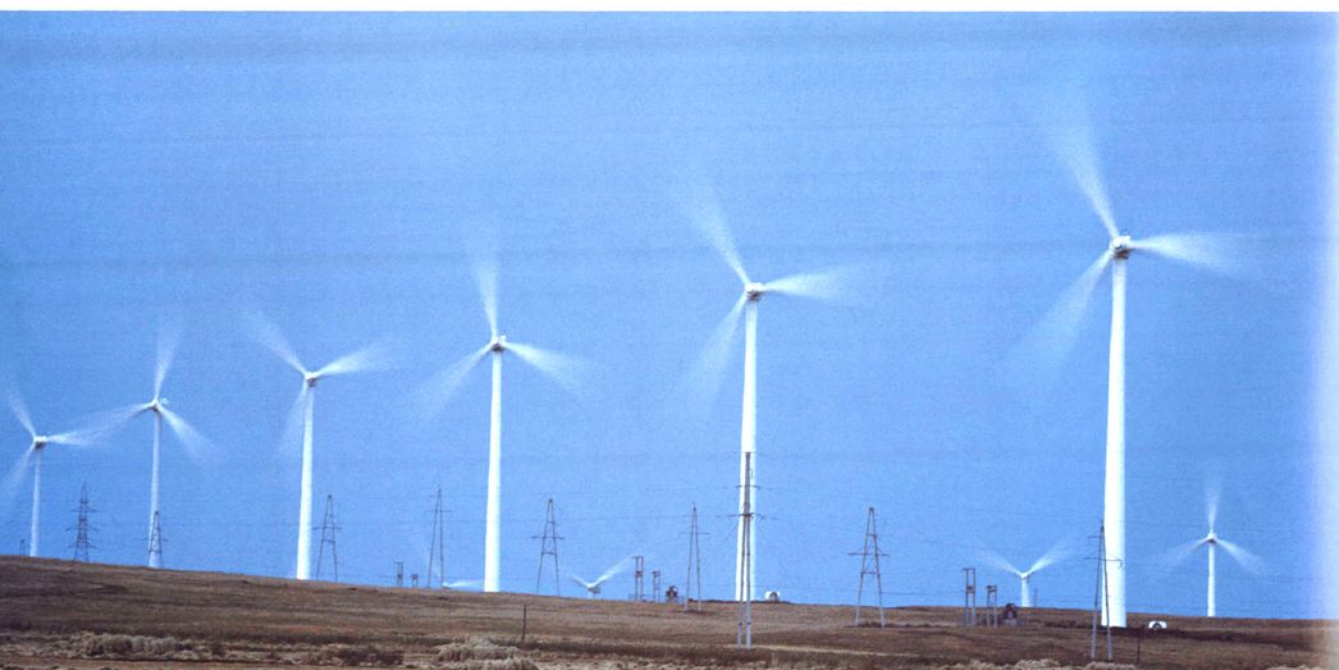
大唐(赤峰)新能源有限公司松山风电项目