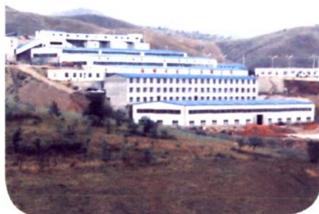
赤峰国维矿业有限公司