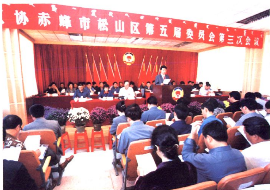
政协赤峰市松山区第五届委员会第三次会议会场