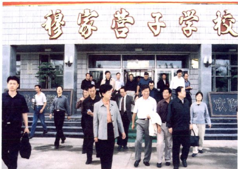
2004年9月3日， 国务委员、国家西部地区“两基”攻坚领导小组组长陈至立视察松山区基础教育工作