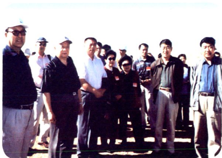
2001年9月1日，全国政协副主席王文元视察关家营满族乡双塔山生态治理项目区