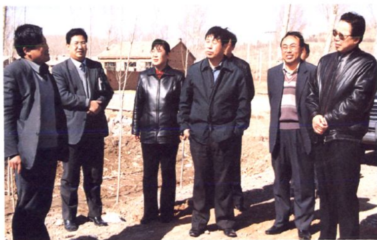
2002年3月8日，赤峰市人民政府市长呼尔查视察松山区农村工作