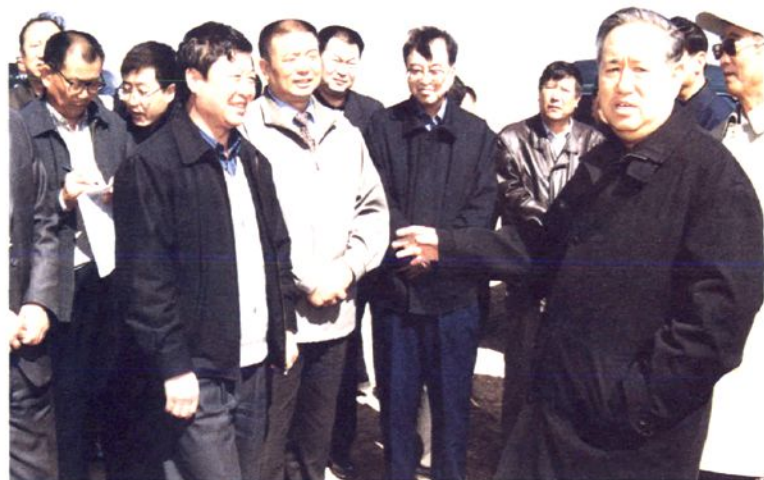
2002年4月18 ~ 21日， 中共中央政治局委员、全国 人大常委会副委员长姜春云 考察松山区生态建设