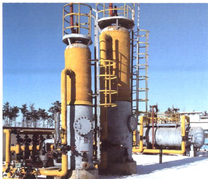
赤峰太平地油气田CNG站