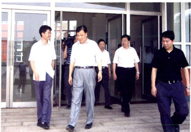
2009年7月30日，中 共中央政治局委员、书记 处书记、中宣部部长刘云 山在松山区视察