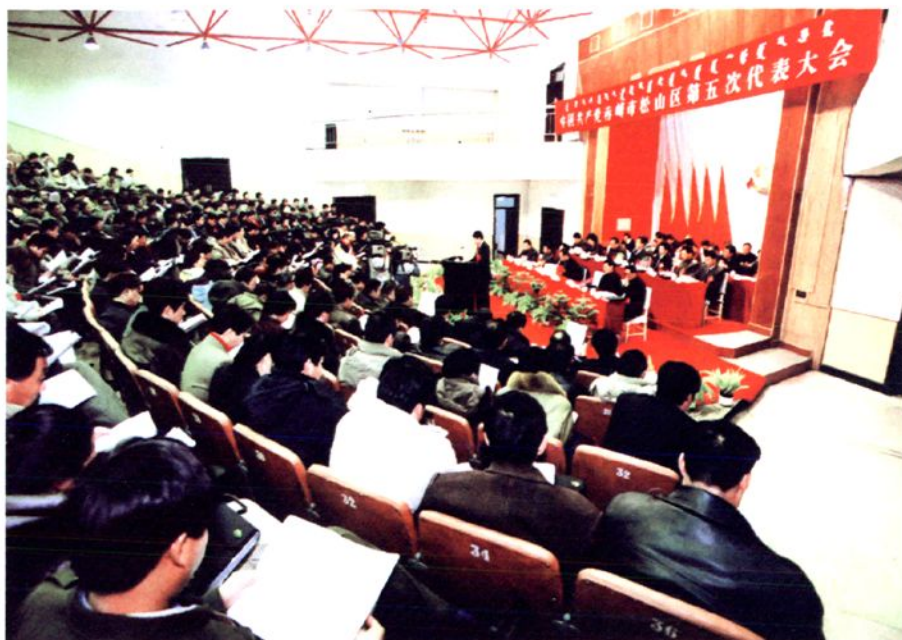
中共赤峰市松山区第五次代表大会会场