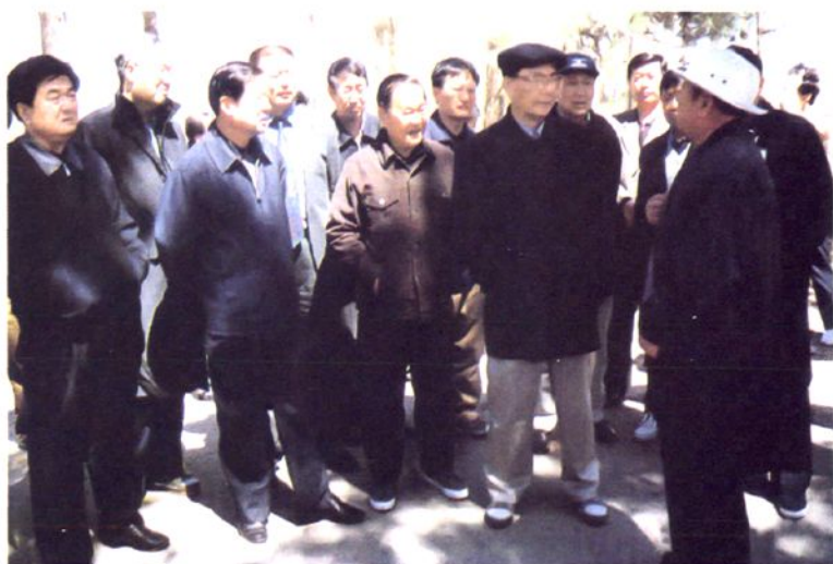
2002年4月24日， 全国政协副主席赵南起 在当铺地村考察