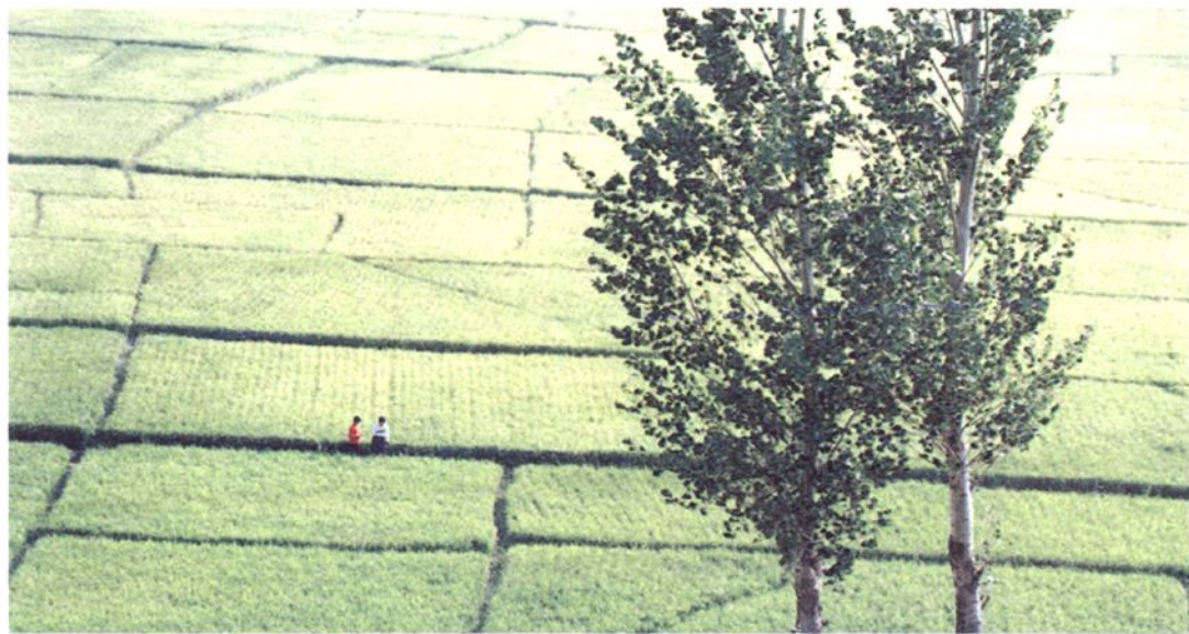
太平地镇万亩稻田