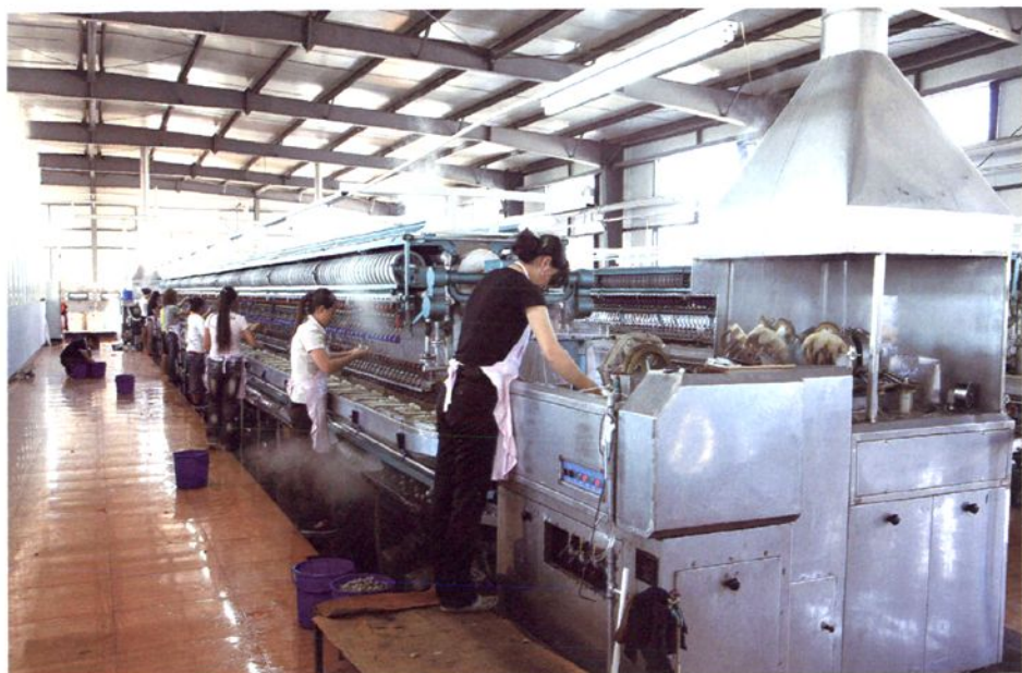
赤峰赤阳春蚕业开发有限公司生产车间