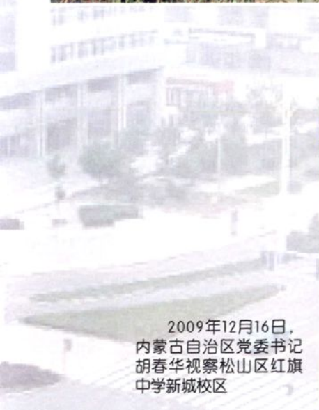
2009年12月16日，内蒙古自治区党委书记胡春华视察松山区红旗中学新城校区