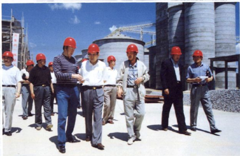
1999年6月24~25日，内蒙古自治区主席云布龙视察松山国家粮食储备库扩建项目