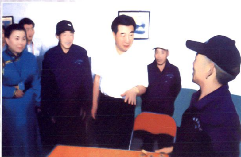
2007年8月10日，中 共中央政治局委员、国务院副总理、中央代表团副 团长回良玉率中央代表团 二分团在当铺地满族乡敬 老院慰问老人