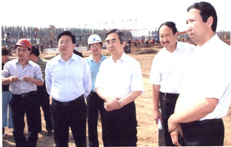
2009年9月2日，中共赤峰市委书记杭桂林在松山区视察