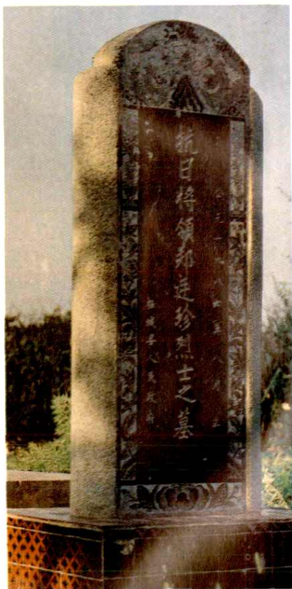
抗日将领郑廷珍烈士墓