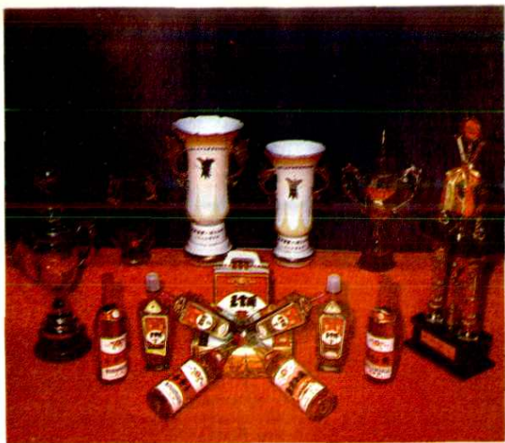
驰名中外的王贡酒