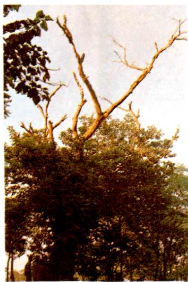
孟庄前商遗址上之千年白果树