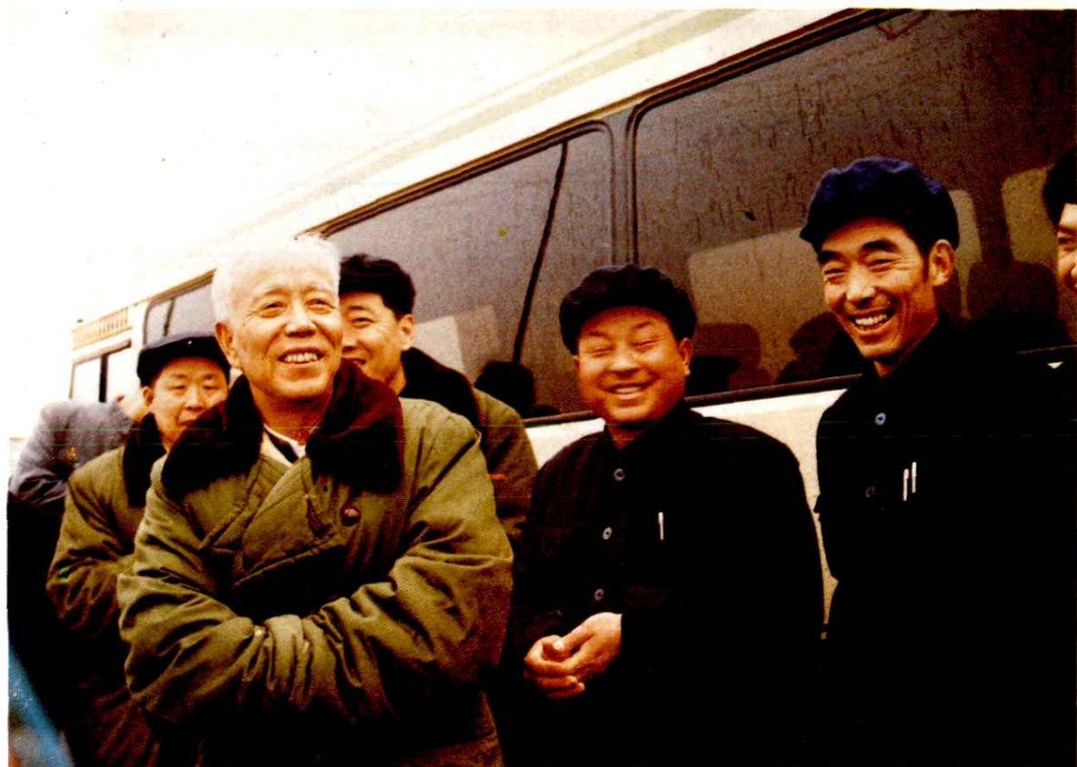
国务院副总理万里1985年3月8日来柘视察林业生产