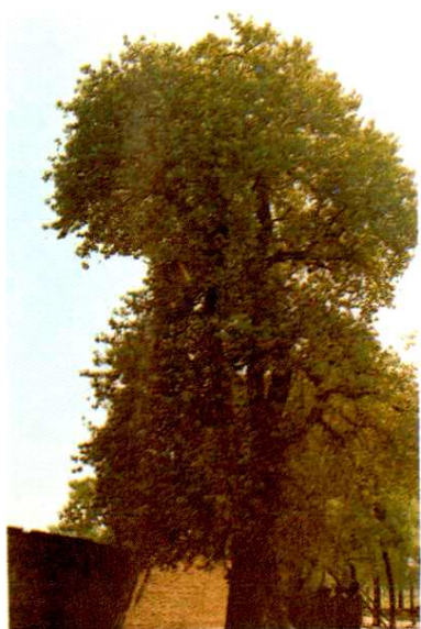
前扳曾口村明初植的柘桑树