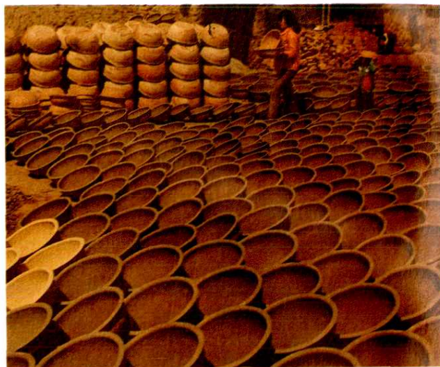
盆窑村生产的盆坯一角