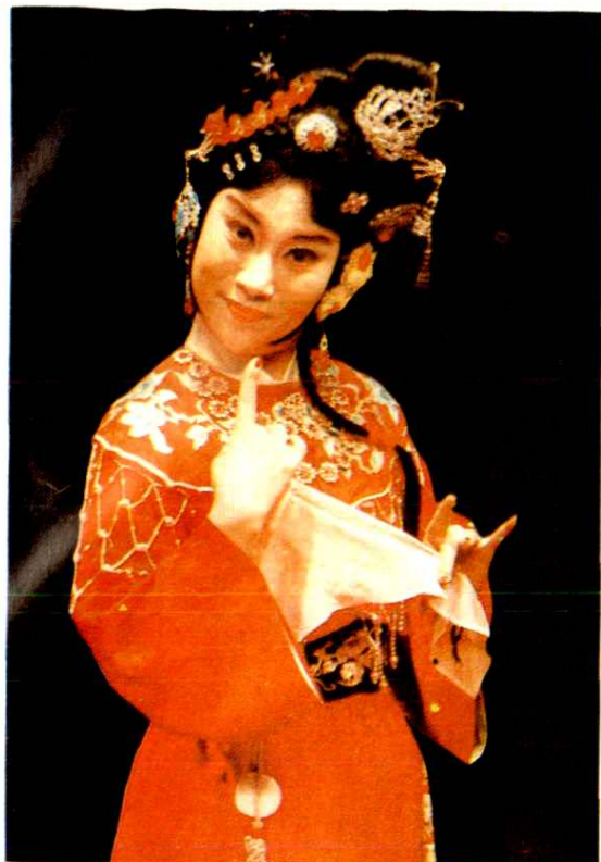
著名豫剧表演艺术家牛淑贤剧照