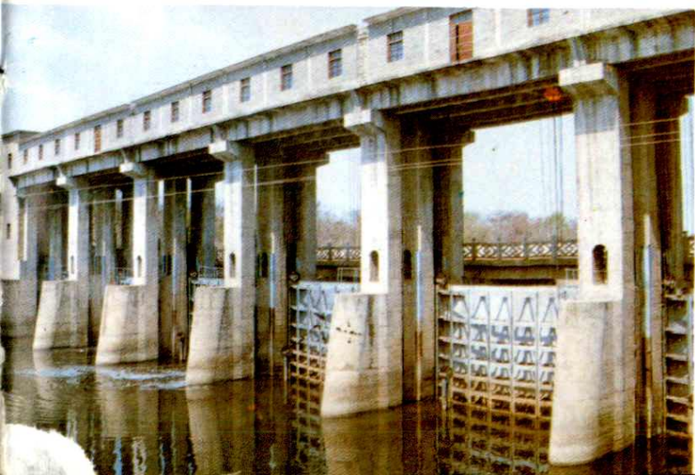
豫东最大拦河闸——砖桥水闸