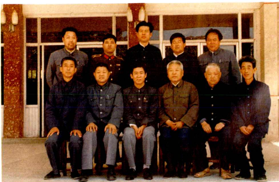
县地名委员会全体委员合影