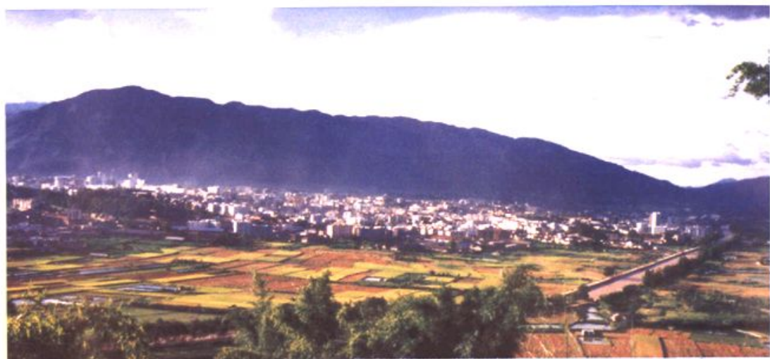
凤翔镇是地、县机关所在地,是全区政治、经济、文化的中心