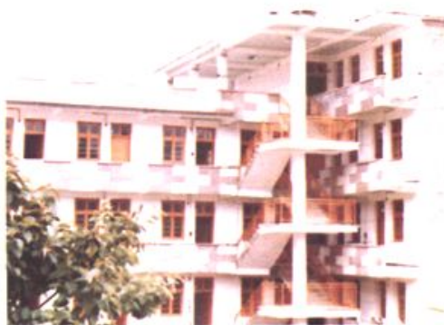
80至90年代凤翔镇办公楼