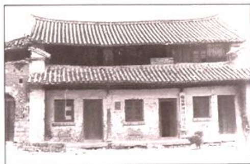
60至70年代城区办公楼