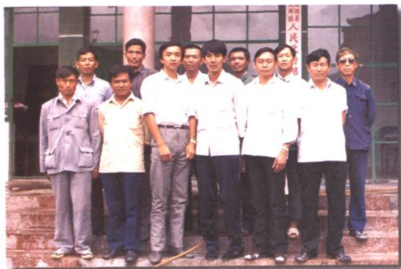
1990年镇 三班子领导人和县领导人合 影