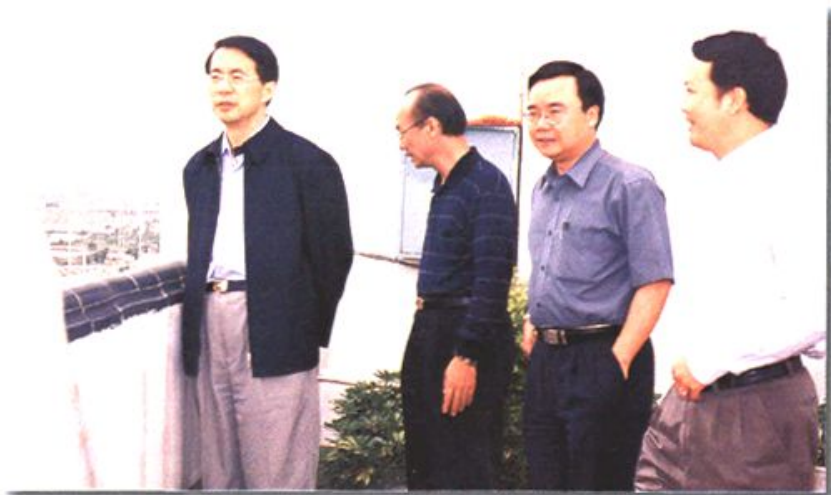
省长徐荣凯等省、地 领导视察市政建设工程