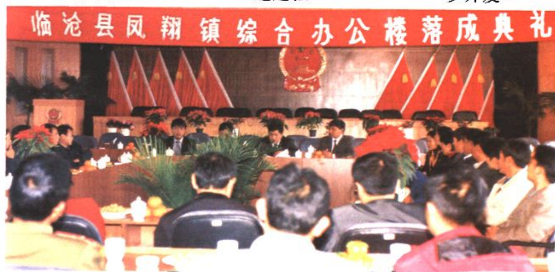
凤翔镇综合办公楼落成典礼