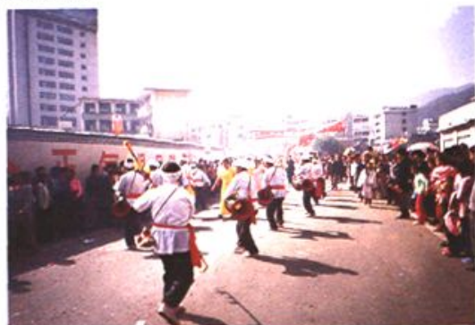
南屏傣族象脚鼓表演