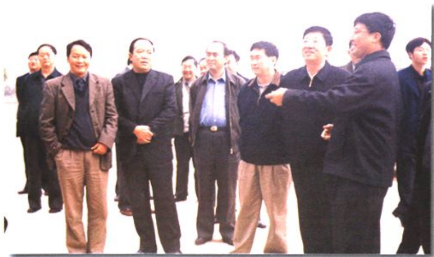
省委书记白恩培等 省、地领导视察市政建设工程