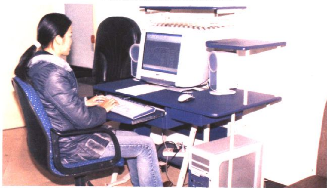
镇机关各站所、社区实现了办公自动化