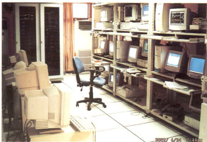
图为广东证券公司新兴营业部电脑机房一角