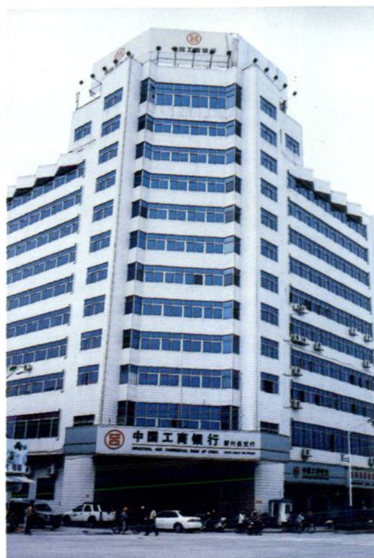
图为2000年12月投入使用的中国工商银行新兴县支行营业办公大楼，地址：县城大园路1号