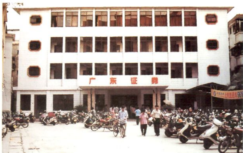
图为广东证券公司新兴营业部营业大楼外景