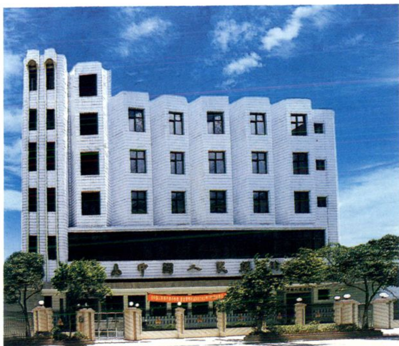
图为中国人民银行新兴县支行办公大楼