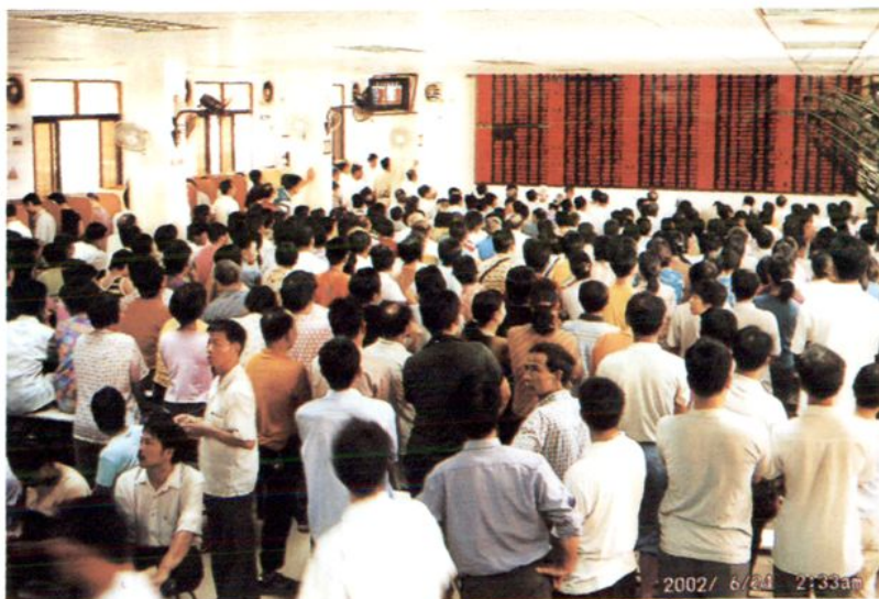
图为新兴县证券营业部股票交易市场一景