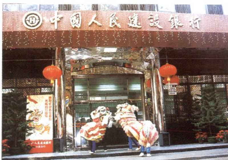
1992年12月28日，建设银行新兴县支行举行办公大楼落成庆典