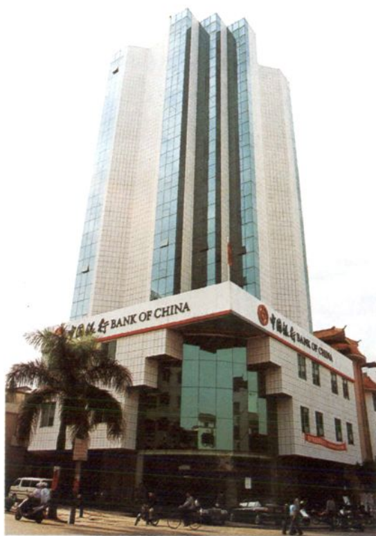
图为1999年1月投入使用的中国银行新兴支行营业办公大楼，地址：县城环城东路1号