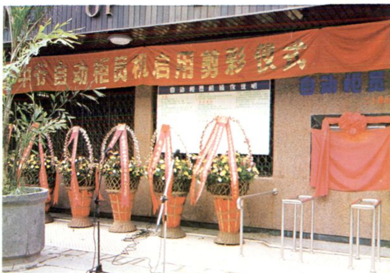
中国银行新兴支行于1993年6月2日推出的新兴县第一台自动柜员机