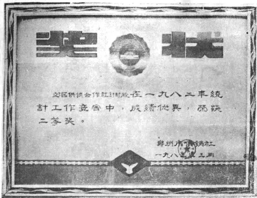
一九八二年优胜奖留影