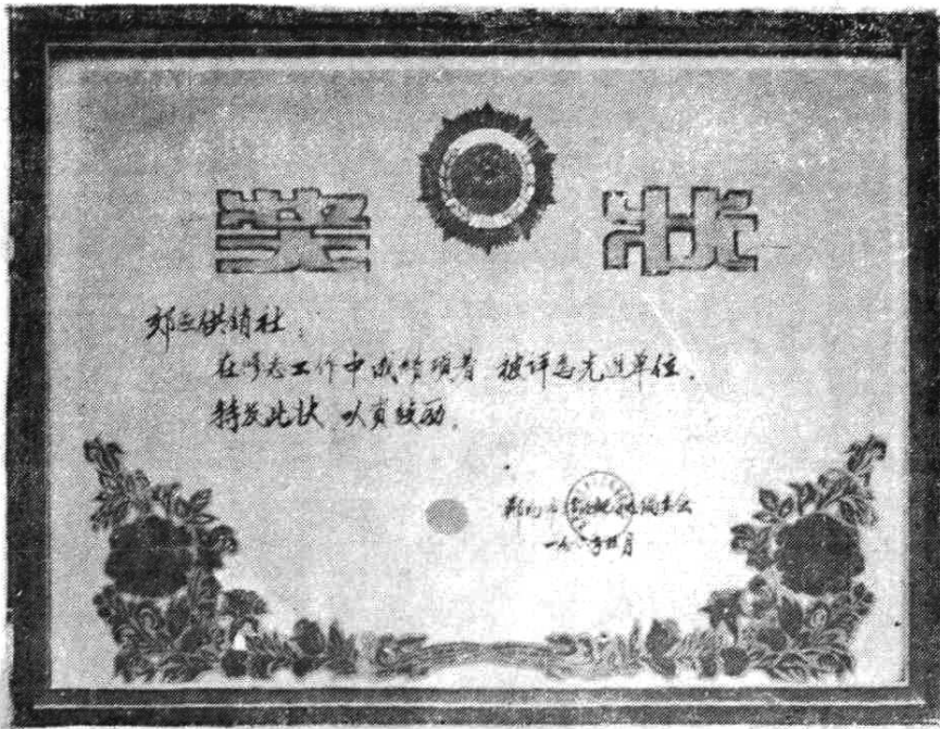
一九八五年优胜奖留影