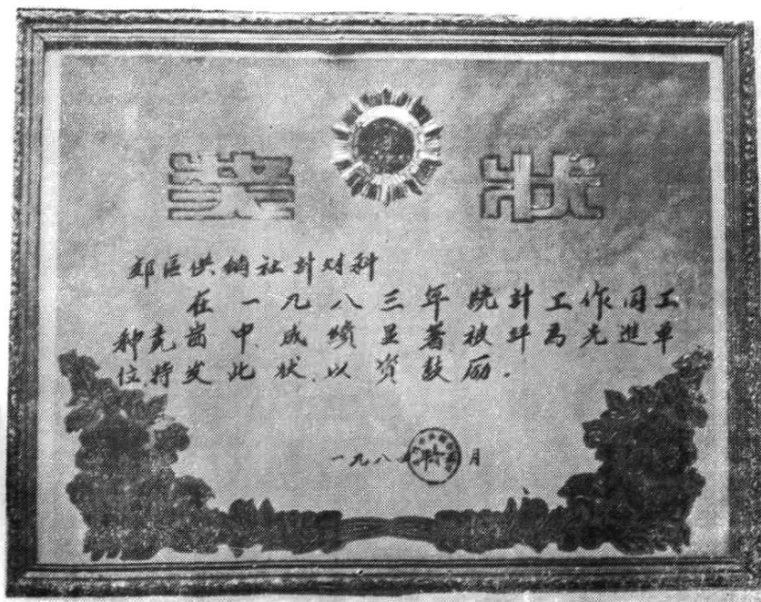
一九八三年优胜奖留影