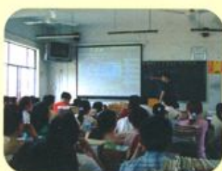
教师运用多媒体教学