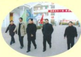
市长赵新中到校指导创建工作