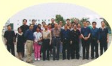
郑州市政协领导来我校视察