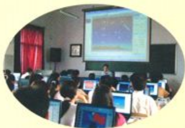
对教师进行多媒体技术培训