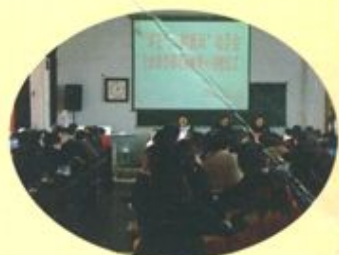
学校讲正气、树新风动员会