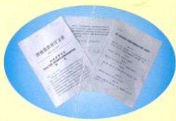
创省示范高中告成