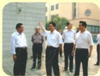
市委书记刘焕成(中)等市四大班子领导莅校指导创建工作