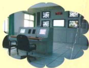
多媒体教学主控室