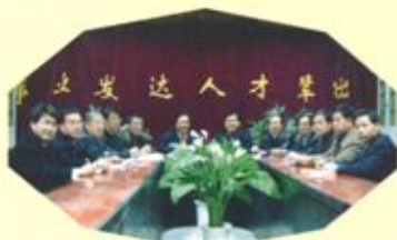
团结、务实、创新的学校领导班子