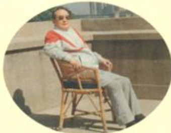
著名校友、原西安市委书记尚寅宾莅校指导 老校友酒泉卫星发射中心老干部董书丹回校报告