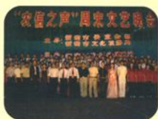
校领导与参演“农信之声”周末文艺晚会师生合影