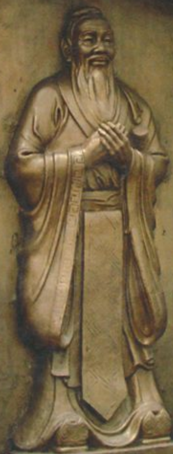
名师苑孔子行教像