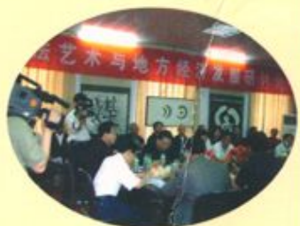
书法艺术与地方经济研讨会