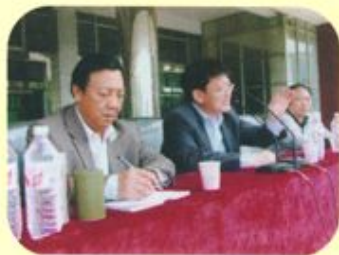
著名校友、华东理工大学教授刘坐镇回校作报告