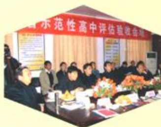
一高省示范性高中评估验收会场