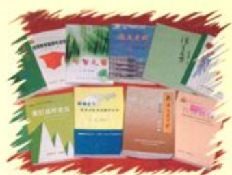
新密一高校本教研成果