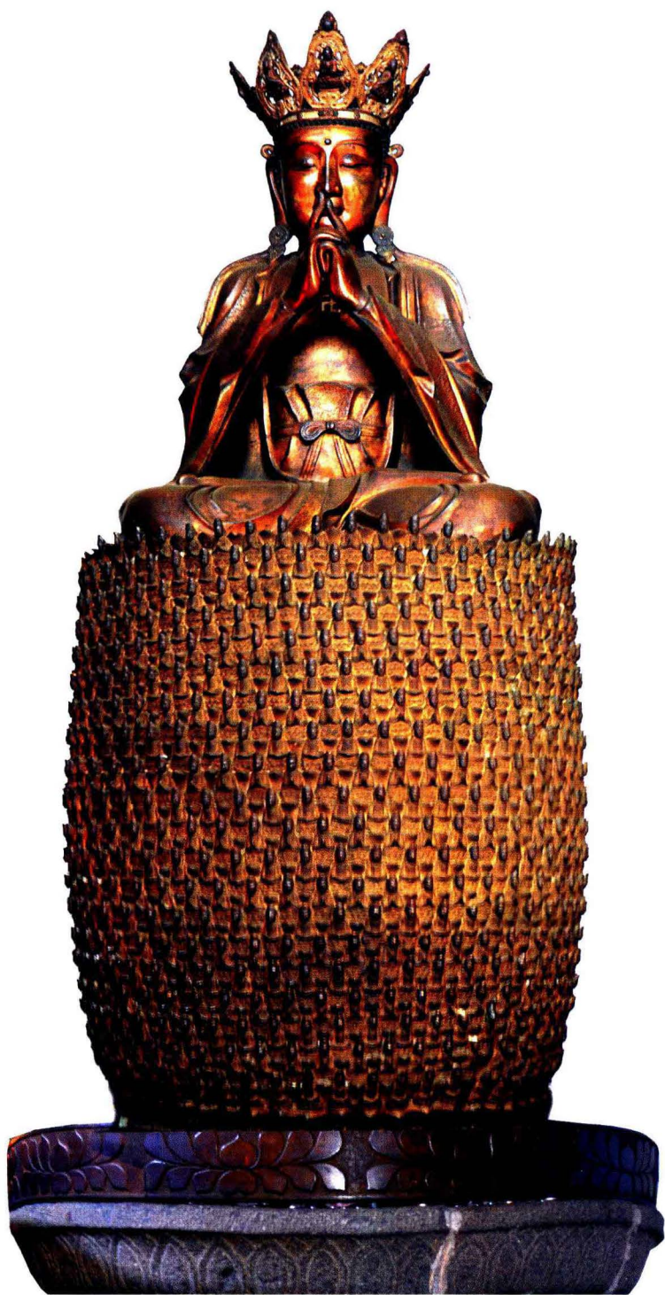
明万历二十六年（1598）李太后赐千叶宝莲毗卢佛像