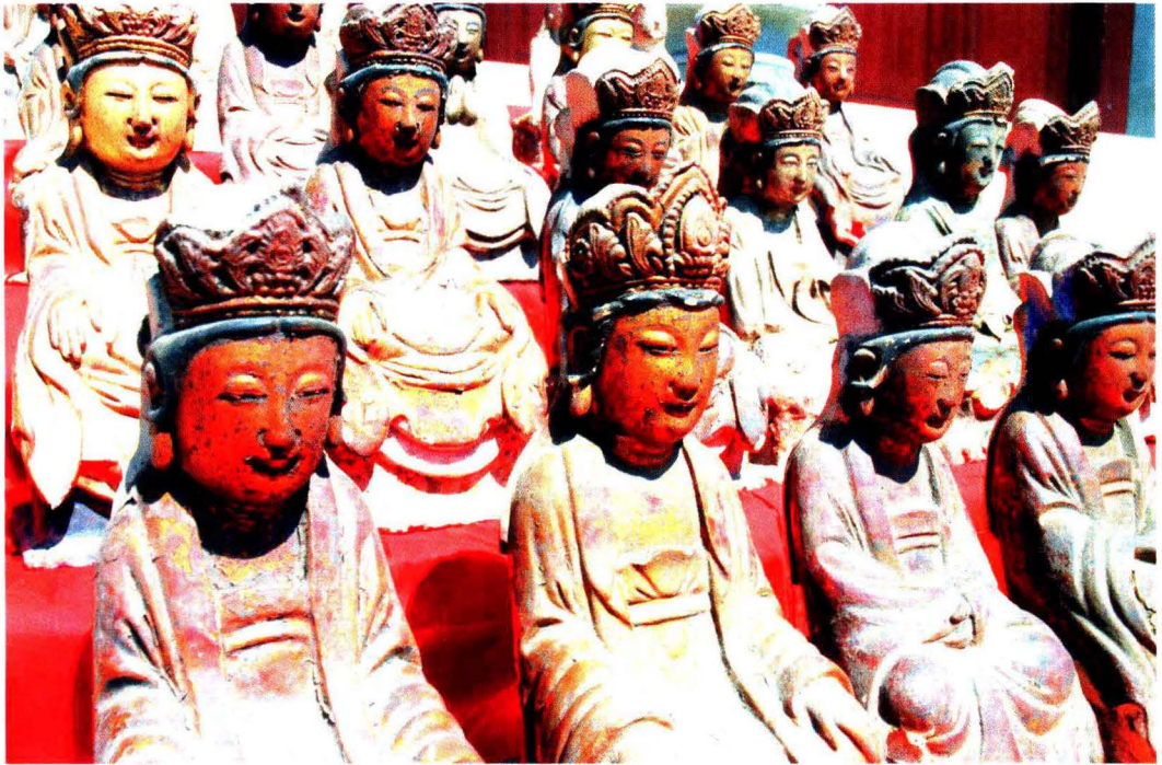
明永乐五年（1407）徐皇后施造天冠菩萨像