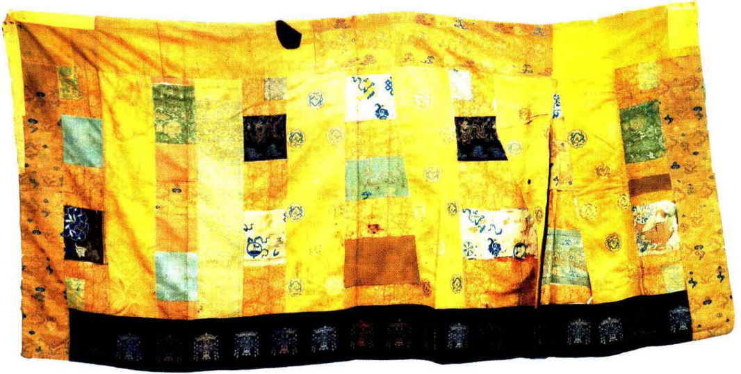
明万历年间大迂国师赐紫袈裟