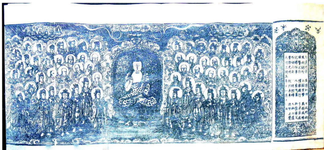
明万历十八年（1590年）敕赐《大藏经》