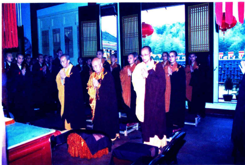
1999年4月，福鼎太姥山平兴寺礼请传印法师为得戒和尚，妙果法师为羯摩阿阇黎，界诠法师为教授阿阇黎，传授三坛大戒法会。(前排左起：妙果、传印、界诠)