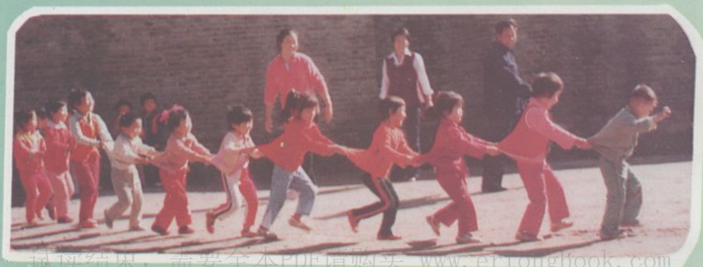
代县职工幼儿园一角