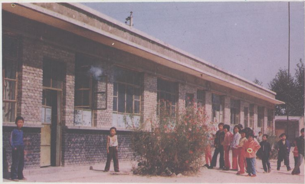
下官院寄宿制小学校舍一角