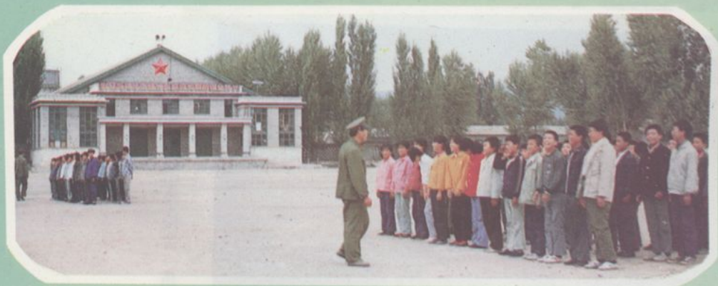
代县二中学生搞军训