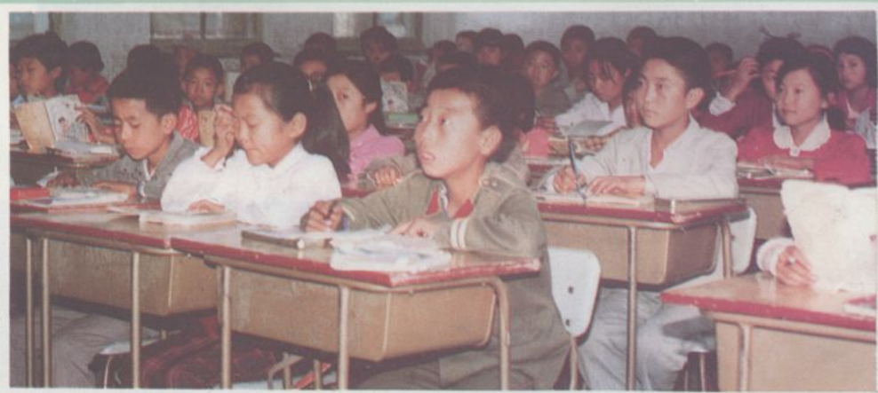
代县实验小学学生在上课