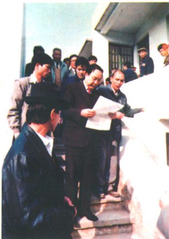
司马义·艾买提同志 视察我校图书馆。