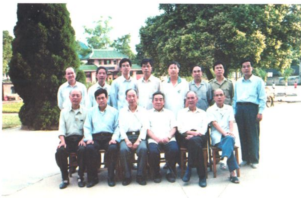
本书部分编委成员合影。