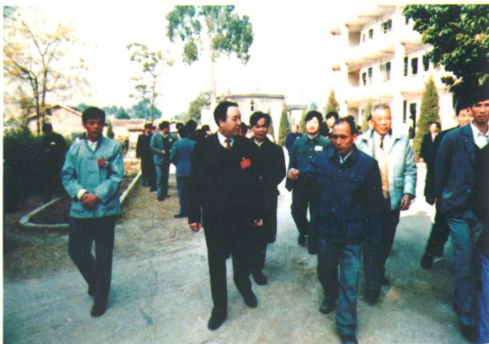
1988年12月15日，国家政协副主席、国家民委主任司马义·艾买提（前中）在罗城县委书记银星灿的陪同下到我校视察。