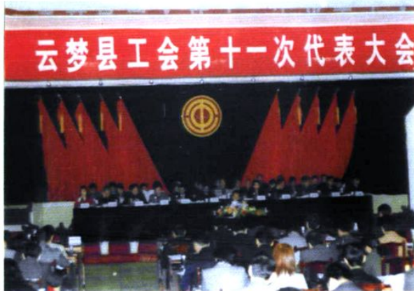
2004年，云梦县工会第十一次代表大会在县宾馆举行。