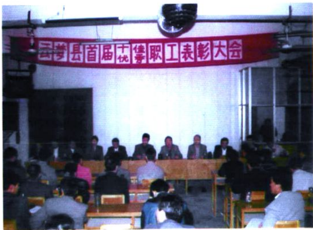
1997年，云梦县首届「十佳职工」命名表彰大会在县邮电局会议室举行。