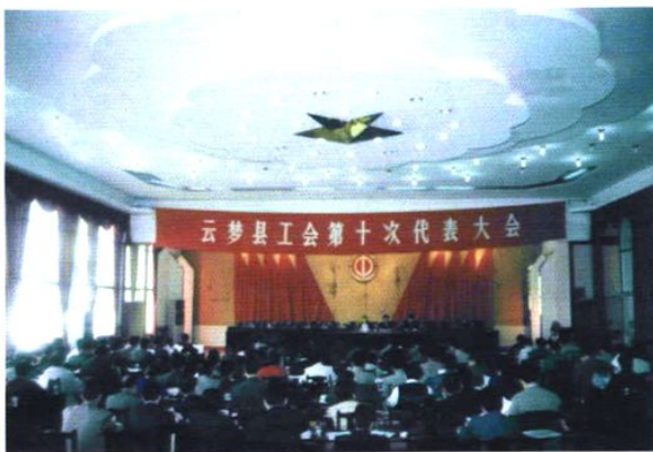
1999年，云梦县工会第十次代表大会在县招待所举行。