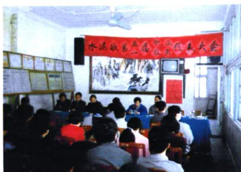
1996年，县水泥厂职代会讨论通过企业改制方案，图为职工代表全体会议。