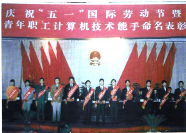
2001年，县总工会举办了青年职工计算机技能比赛，12名优秀选手被命名为「计算机技术能手」，图为命名表彰大会与笔试现场。