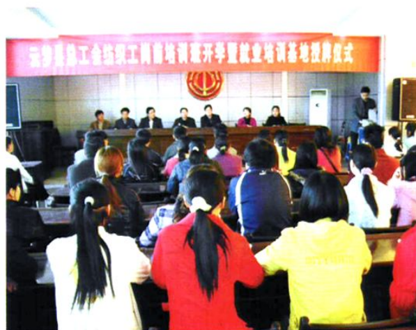
2007年，县总工会与企业联合举办职 工就业技能培训班。