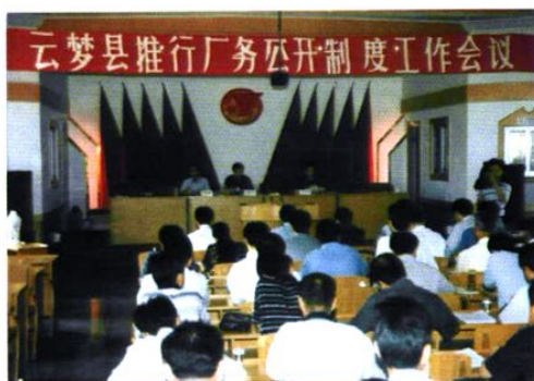
1999年，云梦县厂务公开协调领导小组在县盐硝厂召开全县厂务公开工作会议，深入推行厂务公开制度。