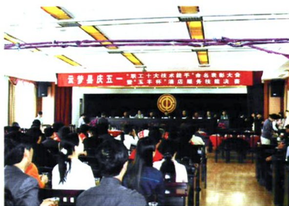
2007年，县总工会授予十人行 业「技术能手」五一劳动奖章。