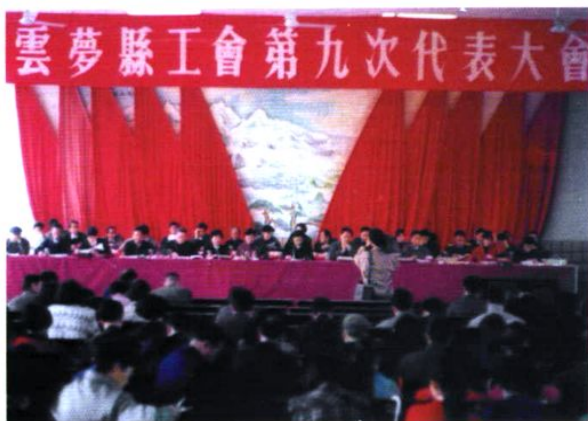
1993年，云梦县工会第九次代表大会在县招待所举行。