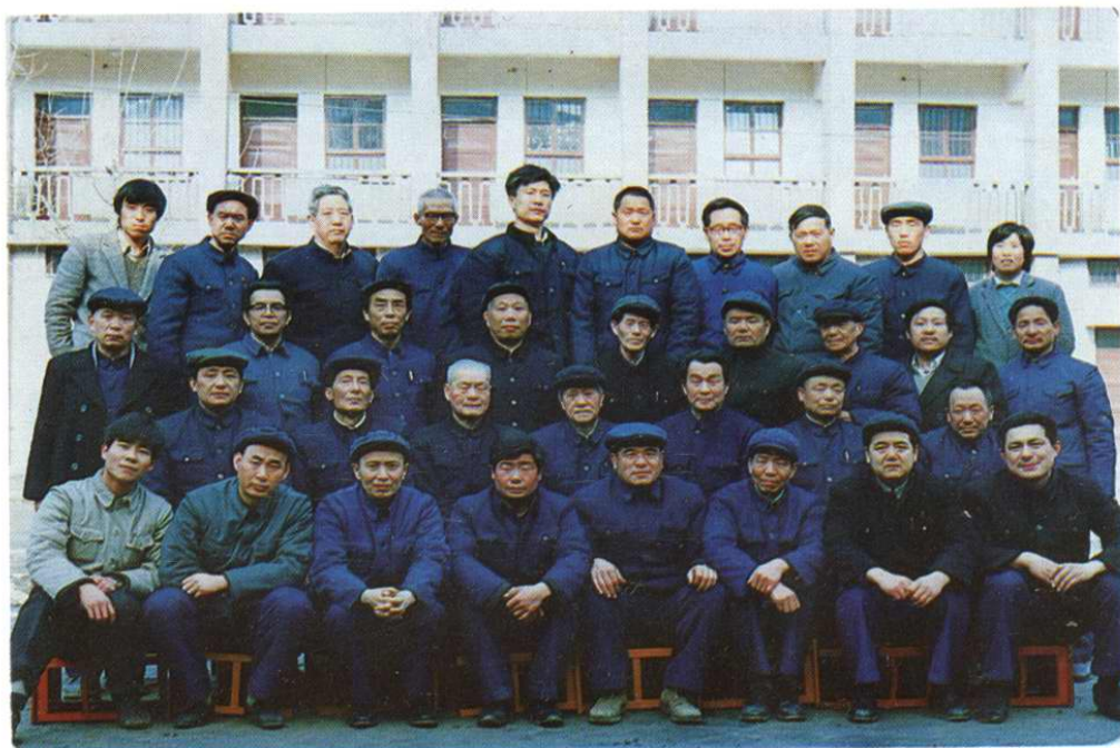
省水利厅水志办组织全省十地市及有关专家学者、水利界前辈等对《铜川市水利志》进行评审，此照为全体参加会议人员。