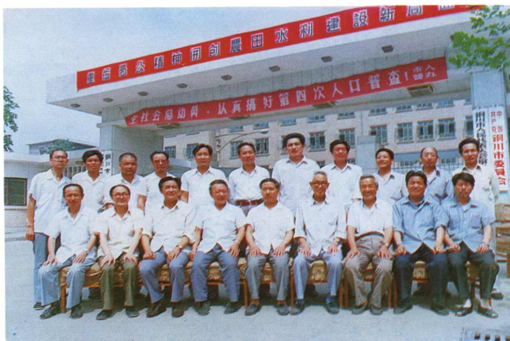
市水利局邀请市志顾问、市农口老领导、老前辈及有关同志对“水利志”进行评审，此照为全体会议人员。