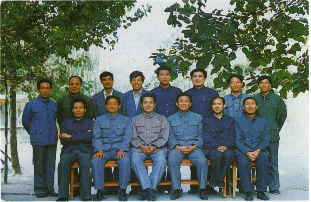
市水利水保局系统科级以上干部合影