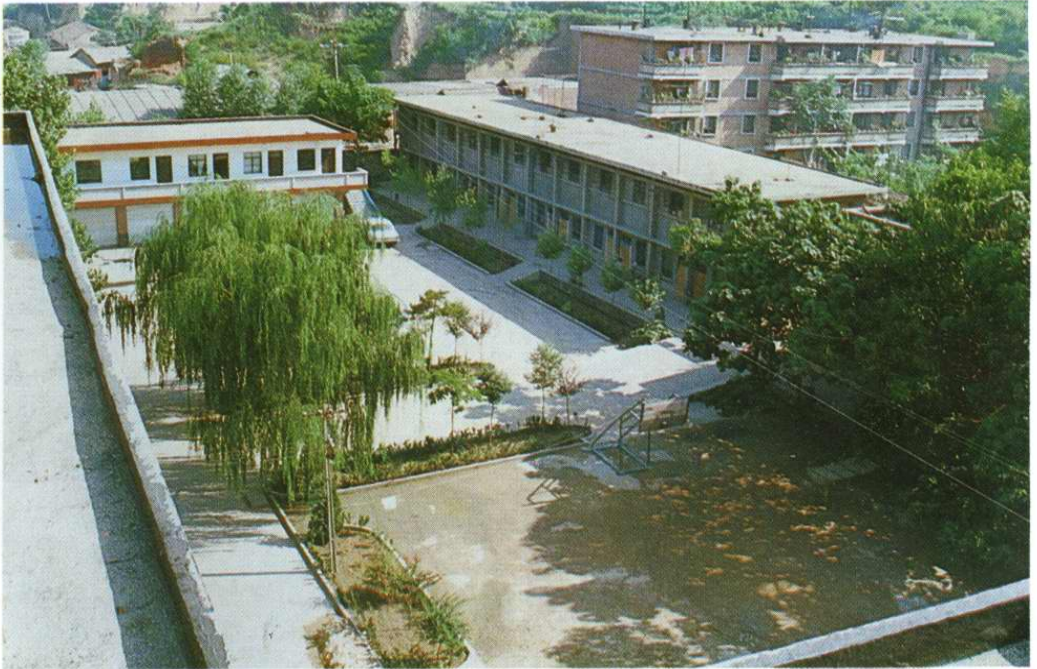
市水利水保局机关大院办公及住宅区鸟瞰图