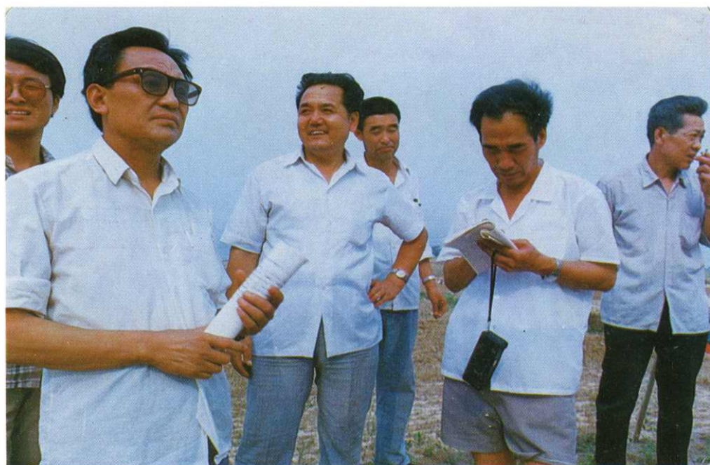
省水保局副局长郭志贤（前排右一）率领省农田基建检查团来本市检查工作